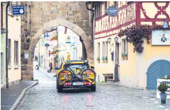
Für den Transport von E-Bikes bieten sich Kupplungsträger am Auto an.

Luftpumpe im Gepäck zu haben. Bei der Routenwahl sollten Urlauber nicht nur die individuelle Fitness, sondern auch eigene Präferenzen, etwa bei der Tourenauswahl, beachten. Vernetzte Displays wie „Nyon“ von Bosch bieten die Möglichkeit, Routen vorab zu planen und zu navigieren. Für den Transport von E-Bikes zum Urlaubsziel sind Kupplungsträger fürs Auto erste Wahl. Währenddessen sollte der Akku entfernt und sicher verstaut werden. Auch die komfortable Reise mit dem Zug ist möglich. Im Regional- und Fernverkehr dürfen meistens E-Bikes bis zu einer Höchstgeschwindigkeit von 25 Stundenkilometern an Bord, wenn man zuvor eine Fahrradkarte kauft. Auch in vielen Fernbussen ist die Mitnahme mittlerweile erlaubt.