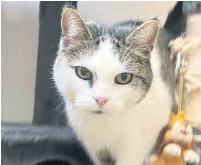
Luna ist sehr lieb und unkompliziert.

Die hübsche Luna kam leider wegen Umzug aus beruflichen Gründen aus der Vermittlung ins Tierheim Kall zurück. Am neuen Wohnort hätte man ihr keinen Freigang mehr geben können, diesen braucht sie aber unbedingt. Die elfjährige Katze ist absolut lieb