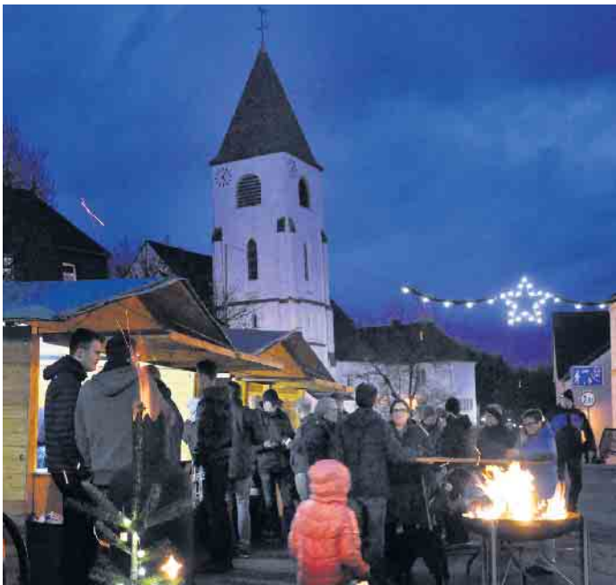
Im Schatten der Pfarrkirche sorgen Glühwein- und Imbissstand für abendliche Weihnachtsmarkt-Stimmung.

Weihnachtsmarkt am Sonntag, 3. Dezember, ab 11 Uhr - Sieger des Malwettbewerb werden geehrt - Kinder der St. Nikolaus-Kita schmücken wieder den Weihnachtsbaum Kall - Es ist bereits der fünfte Weihnachtsmarkt, den der „Verein zur Erhaltung Gaststätte Gier“ am Sonntag, 3. Dezember, ab 11 Uhr im Saal der denkmalgeschützten Gaststätte veranstaltet. Und weil es ein kleines Jubiläum ist, hat sich Conny Burmeister, die Haupt-Organisatorin des Marktes, etwas Besonderes für Kinder ausgedacht. Im Vorfeld des Weihnachtsmarktes veranstaltet der Kneipen-Verein einen Malwettbewerb zum Thema „Weihnachten“ für Kinder im Alter von 5 bis 12 Jahren. „Es gibt tolle Preise zu gewinnen“, kündigt Conny Burmeister an. Der