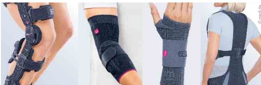
Direktversorgung von Bandagen und Orthesen