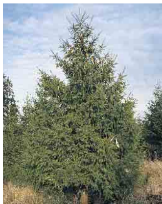
Die Bäume werden erst kurz vor dem Verkauf frisch geschlagen.