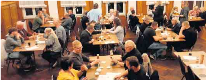
An neun Spieltischen kämpften 36 Würfelartisten im Saal Gier um Punkte für die neunte Meisterschaft und den Gewinn des Luisjen-Cups.