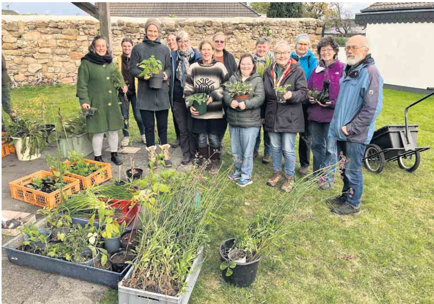
Pflanzen für den Garten kostenlos abzugeben - begeisterte Gartenliebhabende freuen sich über die üppige Vielfalt für ihren Garten.

Erste Pflanzentauschbörse der Initiative „Kall blüht auf“: Austausch von Pflanzen, Knollen, Zwiebeln und Samen für einen bunten Blühgarten.