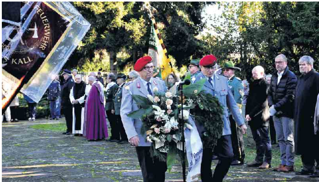
Gedenkfeiern anlässlich des Volkstrauertages finden statt im Kaller Kernort und in Steinfeld.