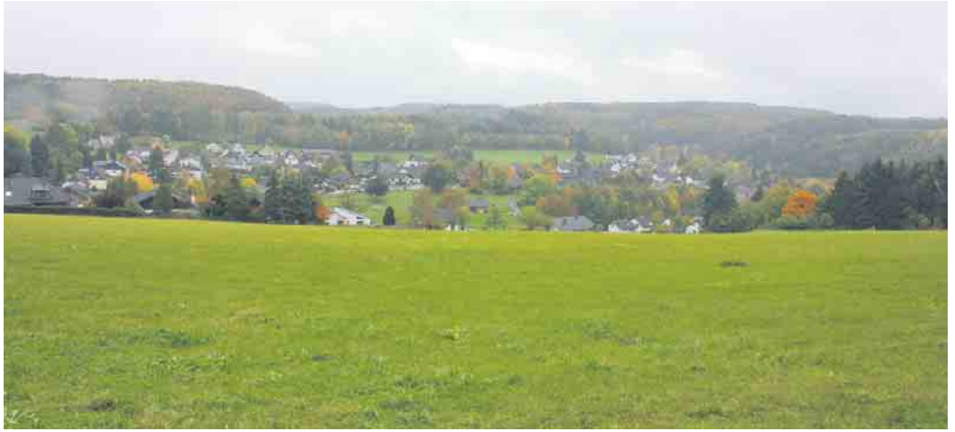
Vom Standort oberhalb der Straße „Zum Elzenberg“ hat man einen schönen Ausblick auf Sötenich.