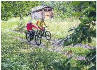
Genug Power für jede Etappe: Vernetzte Bordcomputer helfen bei der Tourenplanung und der Nutzung der Akku-Kapazitäten.

Nicht immer muss es eine längere Strecke sein: Mit Baggerseen und Naturschutzgebieten locken auch in der näheren Region reizvolle Ziele, die sich bequem von zu Hause aus erreichen lassen. Praktisch sind dabei Lastenräder