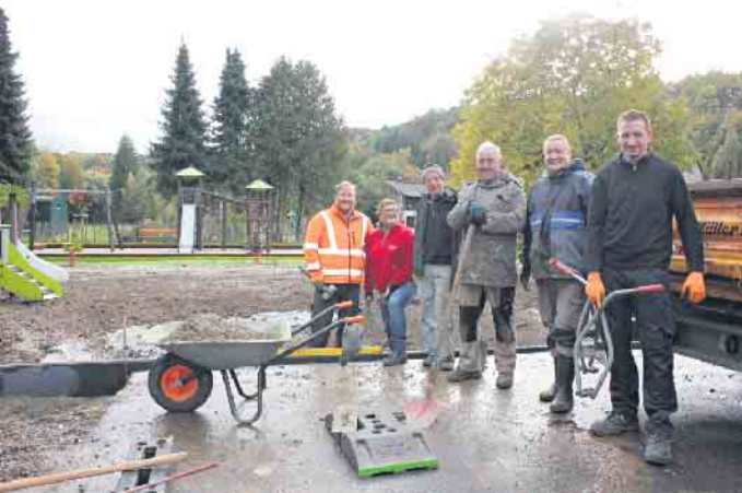
Rund 1000 Arbeitsstunden haben die Ehrenamtlichen eingebracht und sich auch von schlechtem Wetter nicht abhalten lassen.