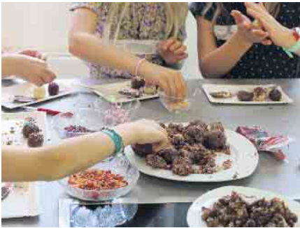
Candy zum Selberformen in der Lehrküche.

Ab 8:30 Uhr ist Zeit zum Ankommen und Orientieren, dann starten die einzelnen Aktionen und Programme ab 9:15 Uhr. Bis 13:00 Uhr kann nach Herzenslust das Gebäude in selbstständigen Gängen oder mit geführten Rundgängen erkundet werden. Eine Anmeldung hilft uns bei der Vorbe-