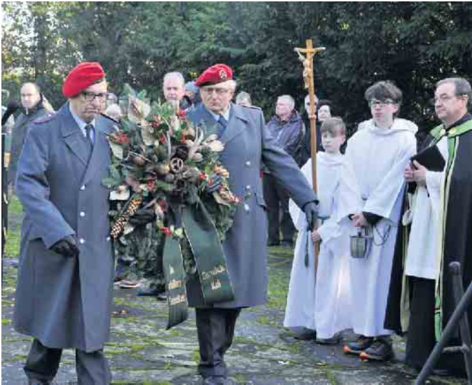
Gedenkfeiern anlässlich des Volkstrauertages finden statt im Kaller Kernort und in Steinfeld.