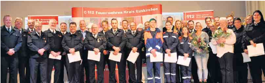
Zahlreiche Mitglieder des Löschzuges Kall wurden beim Kameradschaftsabend im Hans-Kaiser-Saal in Keldenich geehrt oder befördert.

Steigende Mitgliederzahl bei der Feuerwehr - Auch die Einsätze nehmen rasant zu - Erfolgreiche Jugendfeuerwehr - Beförderungen und Ehrungen durch den Bürgermeister und den Wehrleiter