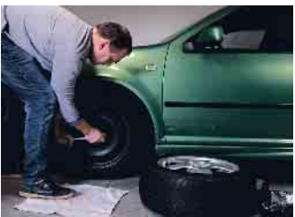
Reifenwechsel muss sein. Wer selber Hand anlegt, kann viel Geld sparen und ist auf der sicheren Seite.

Wer hat das nicht schon einmal selber erlebt. Auf nasser Straße bricht plötzlich der Wagen aus. Schrecksekunden sind dann angesagt und fast jeder weiß, dass er diesen „Höllentritt“, der leicht zu Unfällen führen kann, den nicht mehr verkehrsgerechten Reifen an seinem Fahrzeug zu verdanken hat. Das muss nicht sein und die schlechte Bereifung auf höhere