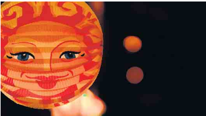
Ich gehe mit meiner Laterne...

10.11.2023, 18 Uhr: Keldenich, Treffen in der Kirche 10.11.2023, 18 Uhr: Rinnen, Bürgerhaus Rinnen 10.11.2023, 17:30 Uhr: Sötenich, Am Pfarrheim 11.11.2023, 17:15 Uhr: Dottel, Messe/anschließend Zug 11.11.2023, 18 Uhr: Golbach, ab Ecke Ronnstraße/Oberstraße 11.11.2023, 17:30 Uhr: Krekel, Treffen in der Kirche 12.11.2023, 17 Uhr: Sistig, Treffen in der Kirche