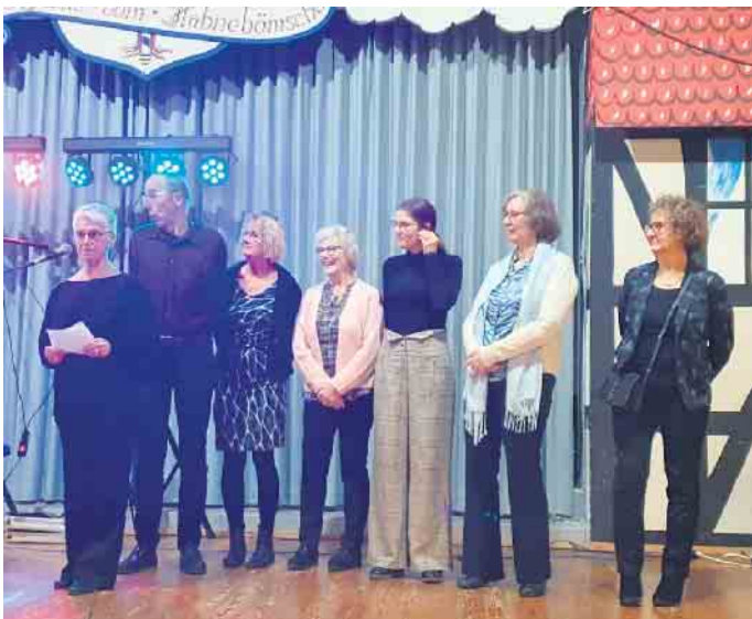
Der aktuelle Vorstand des Kirchenchors Dettel-Scheven-Wallenthal.