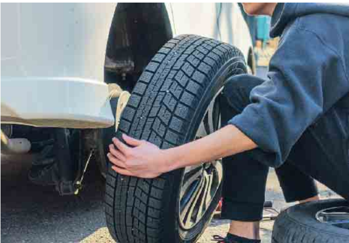
Reifenwechsel muss sein. Wer selber Hand anlegt, kann viel Geld sparen und ist auf der sicheren Seite.

Und der muss keine Frage des Geldbeutels sein