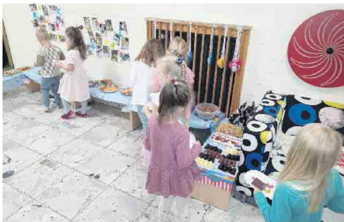
Ein leckeres Buffet steuerten die Eltern bei.

Familienzentrum Hüttenstraße feierte Weltkindertag