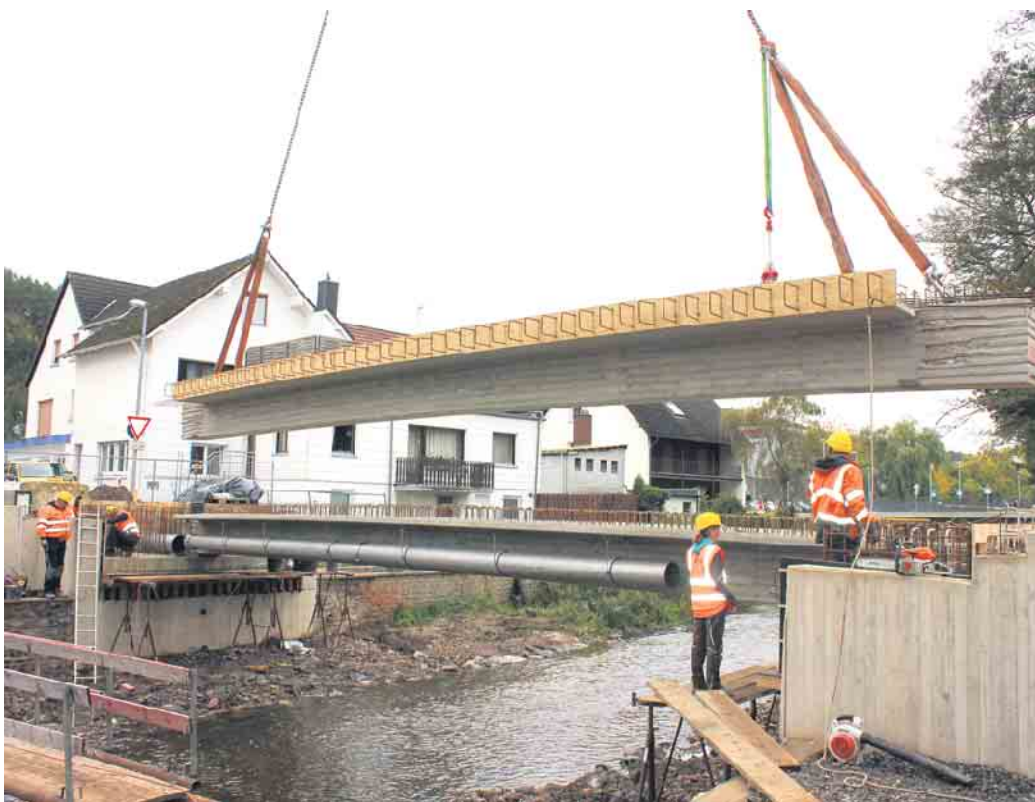
Knapp 30 Tonnen wiegt jedes der drei Betonelemente, aus denen die neue Brücke zusammengesetzt wird.