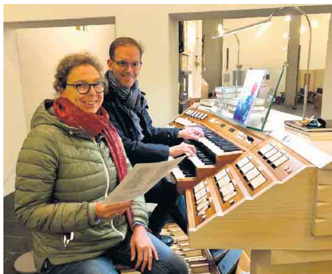
Am 12. November findet in der Pfarrkirche St. Nikolaus das nächste Orgelkonzert im Rahmen des 25. Geburtstags der Weimbs-Orgel in St. Nikolaus statt.