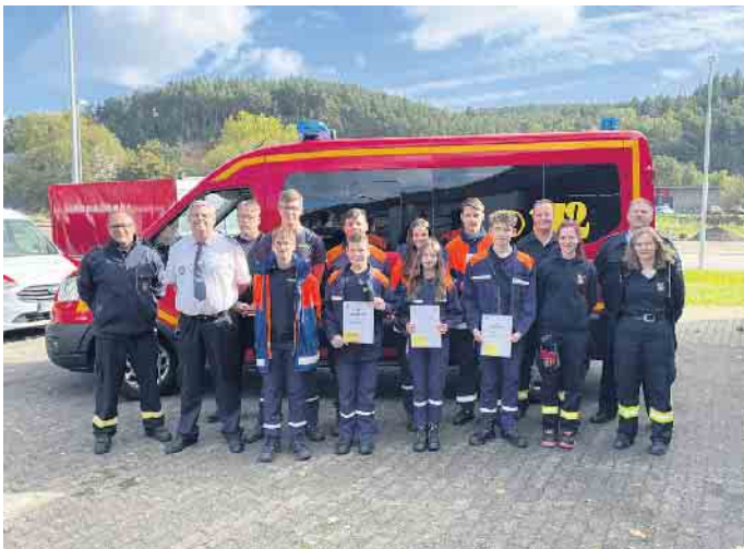
Strahlende Gesichter bei der Jugendfeuerwehr.

Am 14. Oktober stellten sich acht Mädchen und Jungen der Jugendfeuerwehr Gemeinde Kall ihrer ersten Wissensprüfung im Feuerwehrleben. Sie waren angetreten, um die Jugendflamme der Stufe 1 zu erhalten. Mit der Jugendflamme Stufe 1 wird das erste von drei möglichen Abzeichen der Deutschen Jugendfeuerwehr erworben. An verschiedenen Stationen mussten die Jugendlichen Aufgaben rund um das Thema Feuerwehr absolvieren. Dies macht einen wichtigen und wesent-