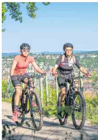
Im Jahr 2021 wurden in Deutschland zwei Millionen neue E-Bikes verkauft. Auch bei ihnen ist es wichtig, dass sie optimal auf die Nutzerinnen und Nutzer eingestellt sind.