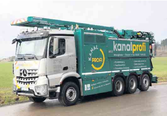
Vor der Kamerabefahrung wird der Kanal gereinigt.

Kall - Als Betreiber des Kanalnetzes im Gemeindegebiet ist die Gemeinde verpflichtet, die-