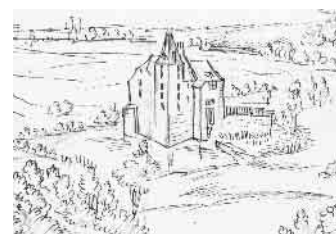
Dieser Ausschnitt einer 300 Jahre alten Skizze zeigt Burg Mauel von Osten.