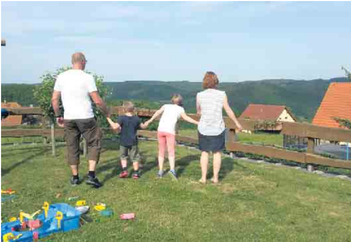
Erziehungsstellen bieten Kindern, die nicht bei ihren Herkunftseltern leben können, ein neues Zuhause.

Informationsabend am 7. November im Hermann-Josef-Haus Urft