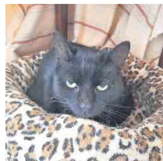
Katze Isi ist bei weitem nicht so grimmig, wie sie hier schaut.

So böse, wie Katze Isi auf dem Foto schaut, ist sie bei weitem nicht. Die ca. acht Jahre alte Isi hieß früher Miezi und stammt von einem Hof, auf dem sich niemand mehr um sie kümmern konnte. Auch wenn sie auf dem Foto etwas grimmig guckt, ist sie doch eine sehr freundliche und liebe Katze, die ein neues Zuhause mit Zeit für Streicheleinheiten und Freigang sucht. Interessenten für Isi sind im Tierheim Kall unter der Tel.Nr.02441-778664 herzlich willkommen!