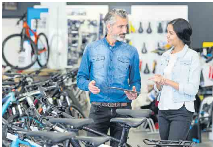
Beim Fahrrad stößt der Onlinekauf an Grenzen: Eine gute Beratung im Fachhandel ist durch nichts zu ersetzen.

Ärger oft schon vorprogrammiert. Wer sich hauptsächlich für den Weg zur Arbeit, zum Einkauf oder für die Wochenendtour aufs Rad schwingt, ist mit einem Citybike gut ausgestattet. Wer komfortabel längere Strecken unterwegs sein möchte, für den ist ein Trekkingrad die beste Wahl. Sportler und Geländefahrer entscheiden sich für ein Mountainbike.