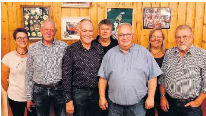
Neu gewählt wurde der Vorstand des Vereins zur Erhaltung der Gaststätte mit Geschäftsführung und erweitertem Vorstand.

Der Verein zur Erhaltung der Gaststätte Gier zog im Rahmen der Jahreshauptversammlung Bilanz. Probleme bereitet der Handwerksmangel.