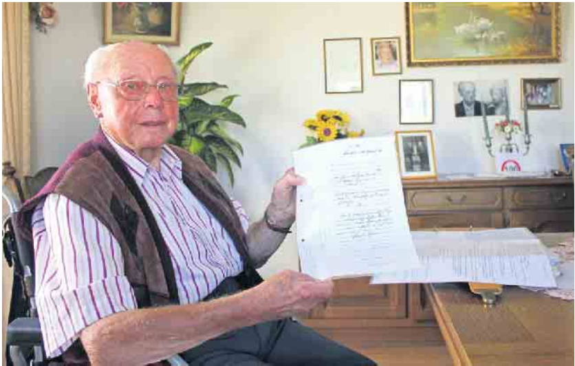
Emil Feyens Geburtsurkunde, datiert auf den 21. September 1923, wurde noch in Sütterlin verfasst.

Der Schevener Emil Feyen feierte am 21. September seinen 100. Geburtstag - Bewegtes Leben und feste Familienbande