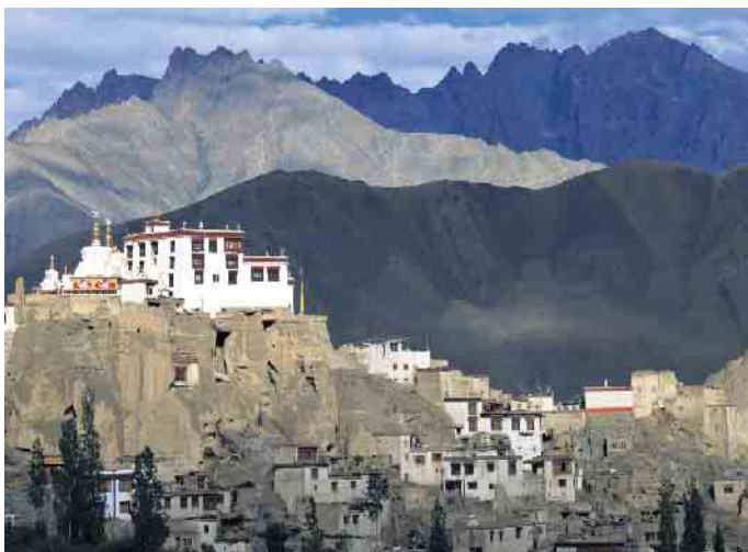
Am 21. Oktober um 19.30 Uhr wird Bruno Baumann über das „Magische Asien“ referieren.

Wie von vergangenen Veranstaltungen im HJK gewohnt, wird es auch bei dieser neuen Vortragsreihe zu erschwinglichen Preisen Kleinigkeiten zu Essen und auch zu Trinken geben. Und mit etwas Glück gehören einige Zuschauer zu den glücklichen Gewinnern der kleinen „ Die Welt zu Gast in Steinfeld - Verlosung “, die bei jeder Veranstaltung durchgeführt wird.