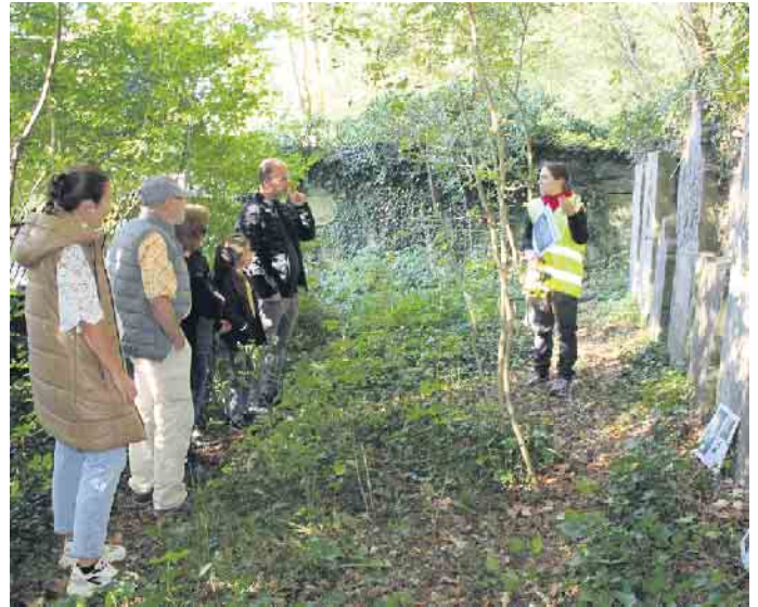
Expertinnen der LVR-Bodendenkmalpflege erläuterten die Archäologiestation nahe der Burg Dalbenden.