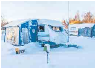
Auch in der kalten Jahreszeit muss man nicht auf Camping verzichten.

und die Möglichkeit zum Gasflaschentauch vor Ort sind im Winter von Vorteil. Unerlässlich ist ein winter-taugliches Fahrzeug. Wichtig sind unter anderem eine Heizung, eine frostgeschützte Wasserversorgung und eine gute Isolierung. Neben warmer Kleidung inklusive Mützen und Handschuhen gehören Schaffelle oder Sitzkissen, warme Decken, Thermoskanne, Wärmeflaschen, Handwärmer, festes Schuhwerk, Sonnenbrille und Regenschirm ins Gepäck jedes Wintercampers. Extrem hilfreich ist ein Vorzelt. Es schützt nicht nur vor Schnee, Regen und Wind, sondern bietet zusätzlichen Stauraum, etwa für Ski, und eignet sich zum Trocknen von Kleidung. Ist der Stellplatz von einer Schneedecke bedeckt, ist es wichtig, bei Caravans oder Wohnmobilen große Bretter unter die Hubstützen zu legen. Das verhindert bei Tauwetter ein Einsinken oder Umkippen der Fahrzeuge. Außerdem gilt: Einen