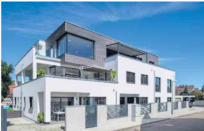
Mehrgenerationenhäuser in Holz-Fertigbauweise sind im Kommen.

ist auch, dass sich alle Parteien mal zurückziehen und gemütlich für sich sein können. Daher geht es nicht ohne individuelle Hausplanung, in die jede und jeder zukünftige Bewohner - von Oma und Opa bis zum Kleinkind und dem Haustier - einbezogen sein sollte", so Tews.