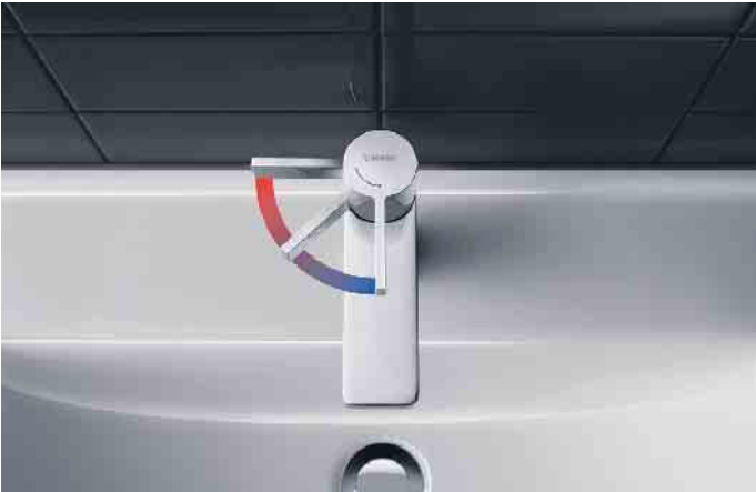
Die energiesparende FreshStart-Funktion bei Einhebelmischern sorgt dafür, dass die Beimischung von Heißwasser erst erfolgt, wenn der Hebel bewusst nach links bewegt wird.