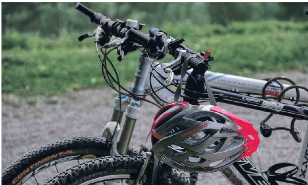
Wer sein Fahrrad auf der Anhängerkupplung seines Autos transportieren will, sollte deren Eignung überprüfen.

Der ADAC rät: Bei Nachrüstung einer Anhängerkupplung sollte man sich von der Werkstatt schriftlich bestätigen lassen, dass sie für die Nutzung mit Fahrradträgern freigegeben ist. Kaufinteressenten sollten besonders auf den D-Wert achten: In der Anleitung des Heckträgers werden Mindestwerte angegeben, die die Anhängerkupplung erfüllen muss. Der Wert der Kupplung steht auf deren Typschild. (mid/ak-o)