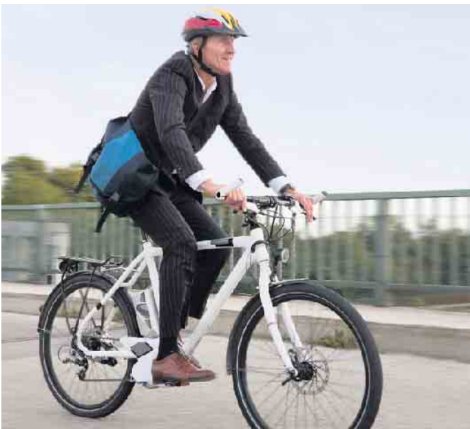
Wenn es um nachhaltige Mobilität geht, ist für viele Mieter das Fahrrad die erste Wahl. 38,6 Prozent sprechen sich in einer Umfrage für mehr Zweiradstellplätze aus.

Menschen befragt hat. In der Stadt ist das Interesse besonders hoch Das Interesse an Angeboten für eine klimafreundliche Mobilität ist stark davon abhängig, ob die Befragten in der Stadt oder auf dem Land wohnen: Je geringer die Bevölkerungsdichte, desto niedriger fällt die Resonanz der befragten Mieter aus. Mit 52 Prozent ist das Interesse an Fahrradstellplätzen in Gebieten mit einer sehr hohen Bevölkerungsdichte mehr als doppelt so hoch wie in ländlichen Regionen (25 Prozent). Auch regional ist das Interesse sehr unterschiedlich ausgeprägt: Während mehr als 62 Prozent der Befragten aus Hamburg Fahrradstellplätze befürworten, sind es in Bayern lediglich 30 Prozent. Ladestationen für E-Fahrzeuge sind unter den Berlinern am beliebtesten