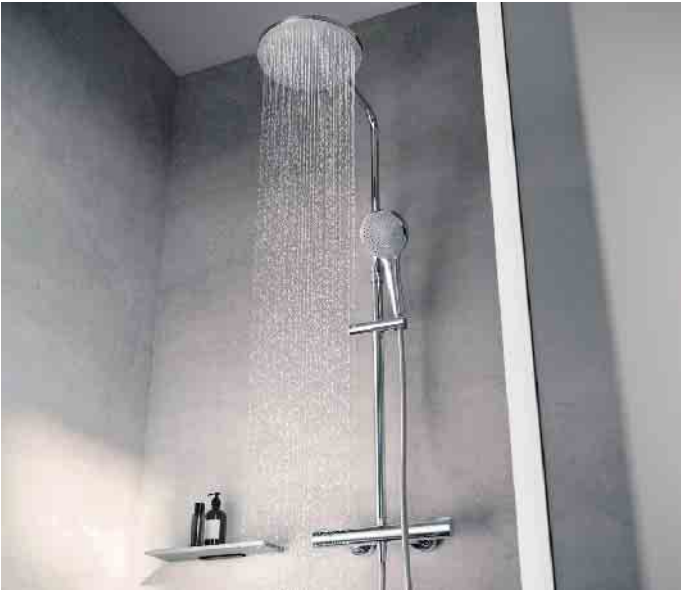
Thermostatarmaturen für Duschen helfen Energie zu sparen: An ihnen werden Höchst- und Durchschnittstemperatur des Wassers festgelegt, die dank des eingebauten Messfühlers konstant gehalten werden.

dann, wenn es wirklich genutzt wird. Manche Armaturenhersteller versprechen dadurch Einsparungen bis zu 70 Prozent. Angenehmer Nebeneffekt sind die bessere Hygiene und Reinigungsfreundlichkeit der Armatur. In den Fachausstellungen des Großhandels und beim SHK-Fachhandwerk sind viele weitere Ideen rund ums Energiesparen im Bad zu sehen. In den Bad-Profis finden sich hier auch die richtigen Ansprechpartner für individuelle Fragen und für eine Umsetzung der Ideen im eigenen Badezimmer. (akz-o)