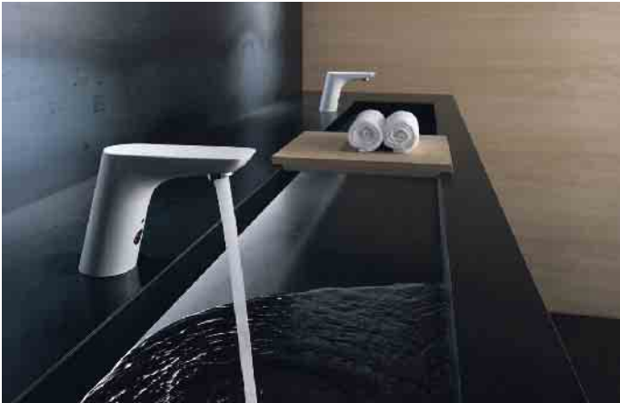
Auch im Privathaushalt stellen berührungslose Armaturen den Wasserfluss sensorgesteuert an und ab. Das Wasser fließt also nur dann, wenn es wirklich genutzt wird. Manche Armaturenhersteller versprechen dadurch Einsparungen bis zu 70 Prozent.