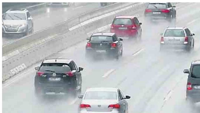
Starkregen kann zur echten Gefahr für Autofahrer werden.