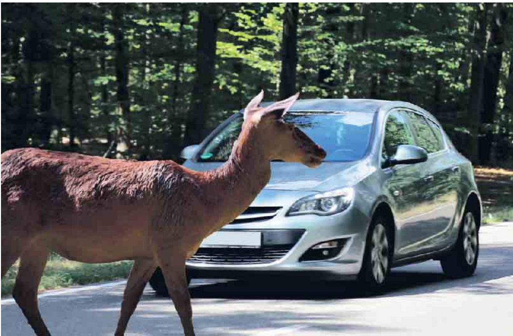
Im Herbst sind Wildschwein, Fuchs und Reh besonders aktiv und können jederzeit und vor allem in den Morgenstunden oder der Abenddämmerung die Fahrbahn kreuzen.