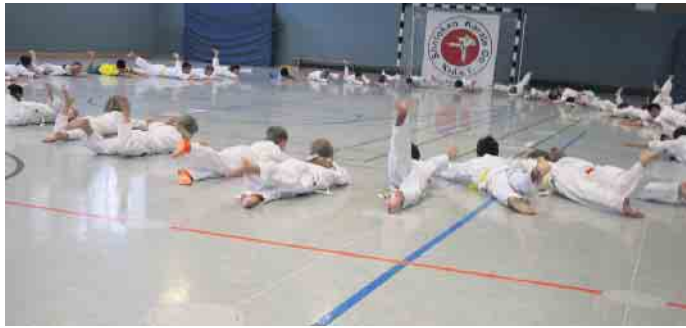
Aufwärmspiele im Karateunterricht