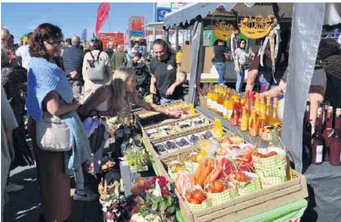
Auch landwirtschaftliche Produkte sind bei der 37. Kaller Herbstschau zu erwerben.