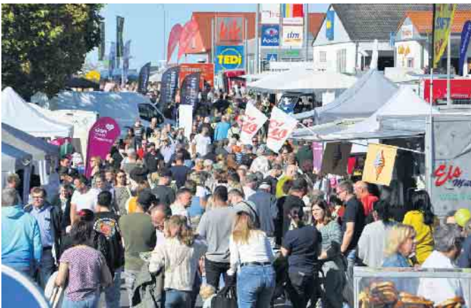
Zur Gewerbeschau am 29. September werden wieder tausende Besucher in Kall erwartet.

Am Sonntag, 29. September, soll das Gewerbegebiet von 11 bis 18 Uhr wieder zum Magnet für tausende Besucher werden.