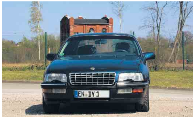
Autokennzeichen müssen von Gesetzes wegen gut lesbar sein.

Schmutzig, verblasst oder durch einen Unfall beschädigt: Manche Autokennzeichen sind kaum noch erkennbar - doch eine gute Lesbarkeit ist gesetzlich vorgeschrieben. Was tun, wenn Reinigen nicht hilft? Wer das Nummernschild selbst ausbessert, kann sich in Schwierigkeiten bringen. Die Kennzeichen aller Fahrzeuge müssen auch auf ausreichende Entfernung jederzeit lesbar sein: Das ist gesetzlich klar geregelt. Deshalb sollten Verschmutzungen durch Dreck oder Schneematsch regelmäßig entfernt werden. Sonst ist ein Verwarngeld von fünf Euro fällig. Dasselbe gilt, wenn die Kennzeichen beschädigt oder verblasst sind: Diese müssen möglichst schnell ausgetauscht werden. Das Schild selbst auszubessern, ist hingegen keine gute Idee - und kann teuer werden. Bei Veränderungen