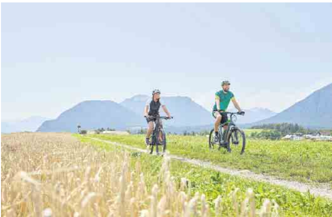
Nach längeren Ausflügen kennen die meisten Radlerinnen und Radler das Phänomen, dass Po, Rücken und Nacken immer wieder mal schmerzen. Mit der richtigen Einstellung des Bikes lässt sich das vermeiden.

Beim Onlinekauf kann man sparen, das gilt auch fürs Fahrrad. Gerade hier ist die Bestellung im Netz aber nicht die beste Wahl. „Was man im Internet nicht kau-