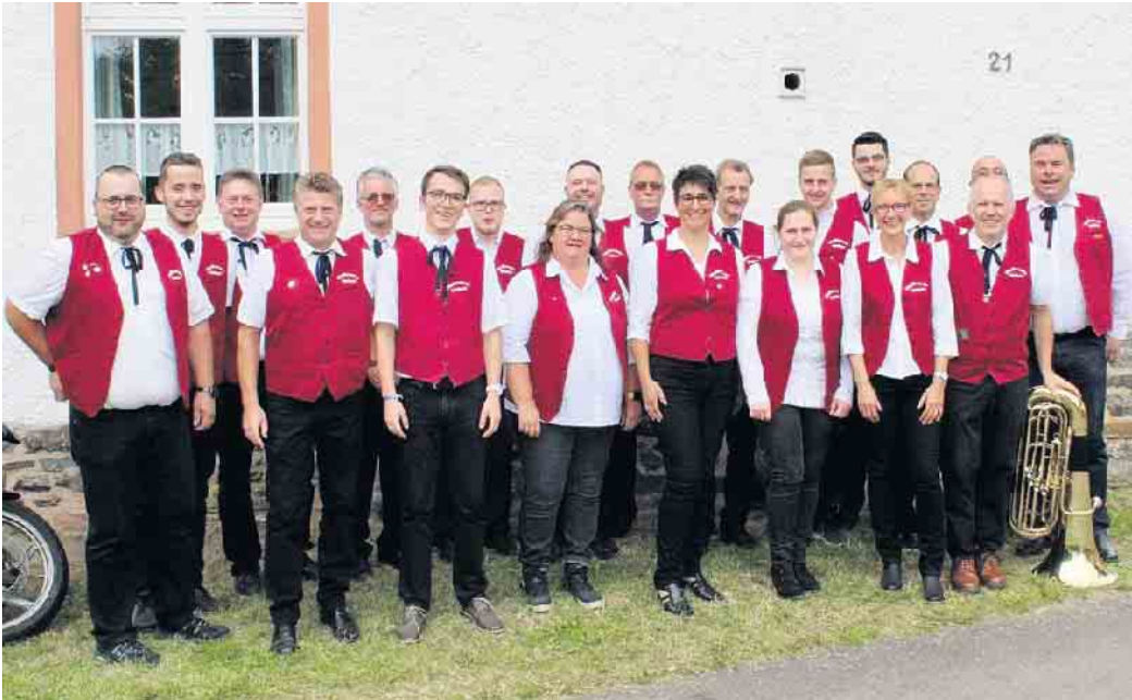
Der Musikverein Nöthen inszeniert zwei Tage voller Konzerte und Mitmachmöglichkeiten.