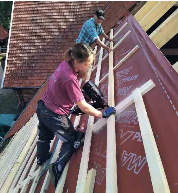
Höhentauglich, handwerkliches Geschick, mathematisches Grundverständnis und gerne teamfähig: das sind die wichtigsten Dachdeckereigenschaften- geschlechtsunabhängig.

lohnt. Gute Voraussetzungen zum Dachdeckerberuf sind neben handwerklichem Geschick ein mathematisches Grundverständnis, Höhentauglich- und Teamfähigkeit. Außerdem sollte man sich gerne an der frischen Luft aufhalten. Übrigens: Der Beruf ist durchaus für Frauen geeignet, auch hier nehmen die Zahlen jedes Jahr zu. Alle wichtigen Infos zum Dachdeckerberuf gibt es hier: www.dachdeckerdeinberuf.de (akz-o)