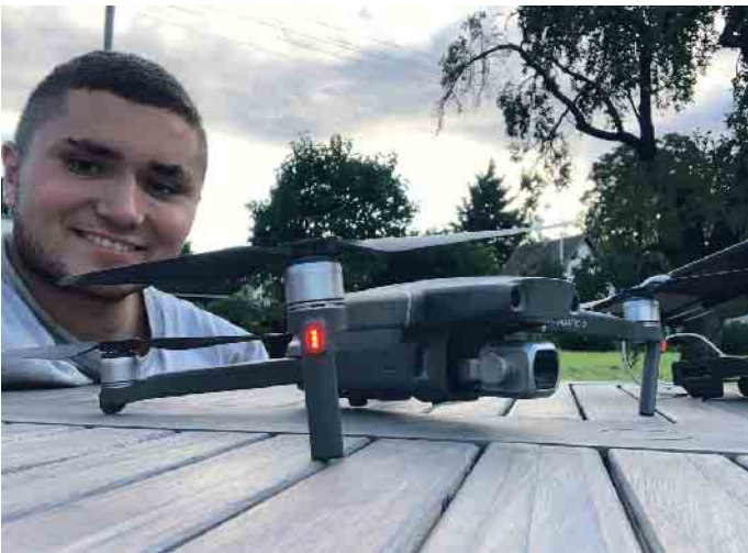
Das Dachdeckerhandwerk nutzt neue Technologien: Mit Drohnen werden Dächer inspiziert.

Voraussetzung für eine Ausbildung Ob man für den Beruf des Dachdeckers oder der Dachdeckerin geeignet ist, stellt man am besten bei einem Schülerpraktikum fest. Viele Dachdeckerbetriebe bieten heute ein Praktikum an, nehmen am Girls' Day teil und informieren auf Azubimessen über den Beruf. Dabei kann man sich dann gleich kennenlernen, erhält den ersten Einblick ins Unternehmen und wird vielleicht sogar mit einem Ausbildungsvertrag be-