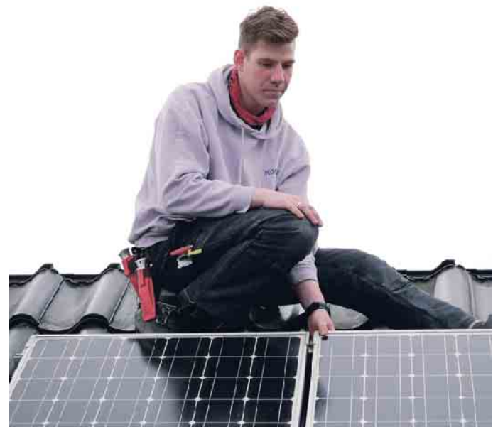
Dächer sind mehr als Ziegel. Auch die Montage von Photovoltaikanlagen gehört zum Dachdeckerhandwerk.

Was aber auch wichtig ist: Dachdeckerhandwerk ist und bleibt Handwerk: das heißt, es wird angepackt, man ist viel draußen und auch oft hoch oben. Dafür gibt es tolle Aussichten, vielfältige Aufgaben und am Ende des Tages sehen Dachdecker:innen, was sie geschafft haben. Das macht stolz. Und wer heute eine Ausbildung im Handwerk startet, hat auch danach gute Chancen auf Karrierechancen. Nach erfolgreicher Ausbildung, die in der Regel drei Jahre dauert, sind Weiterbildungen möglich: Vom Vorarbeiter über den Baustellenleiter, Energieberater oder bis hin zum Dachdeckermeister, um beispielsweise einen eigenen Betrieb zu führen.