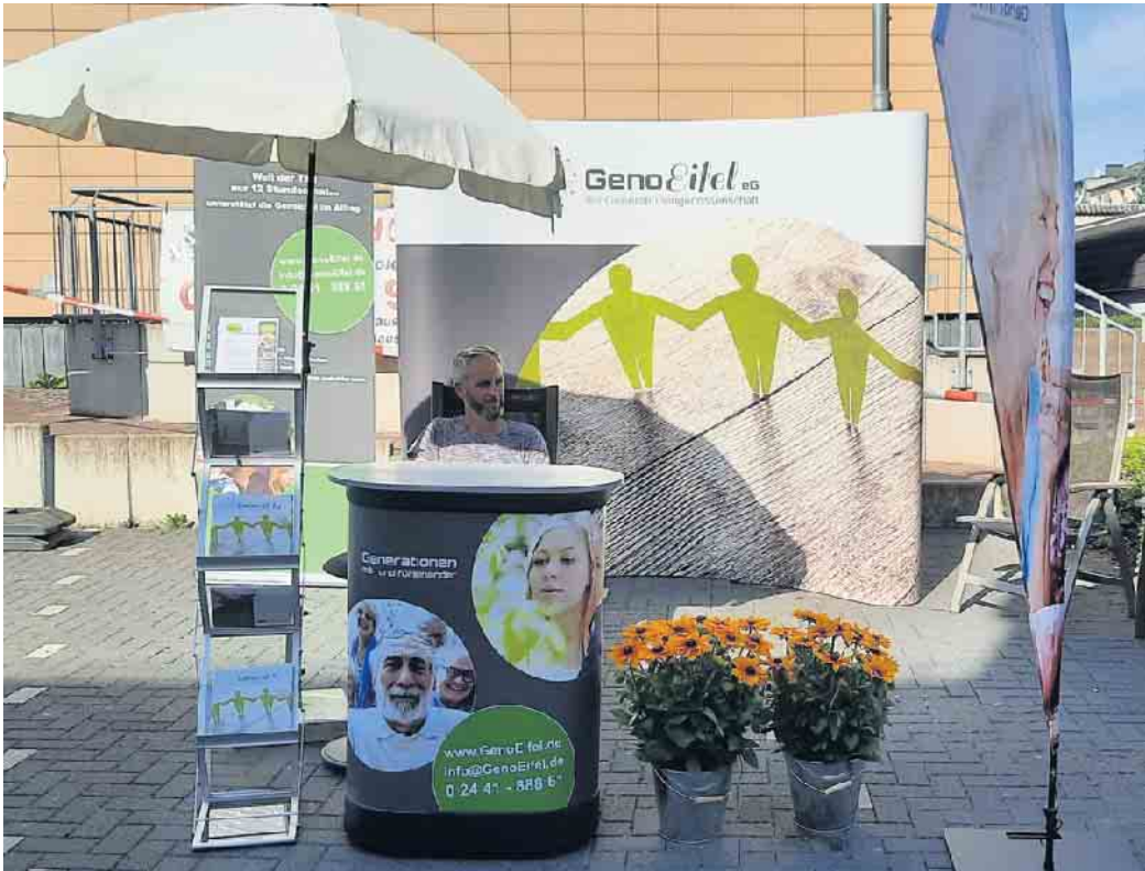
Wie beim Brunnenfest in Mechernich wird die GenoEifel im September gleich drei Mal ihren Infostand bei Veranstaltungen im Kreis Euskirchen aufbauen.