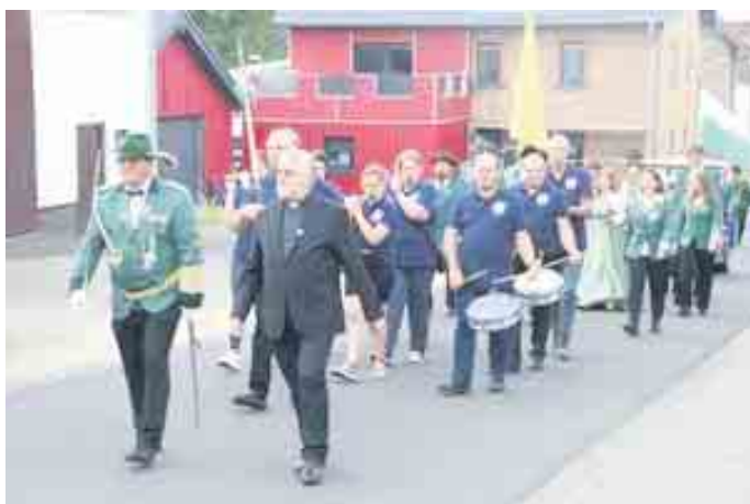
Das Königspaar wird abgeholt.

Spielmannszug aus Wahlen, abgeholt und die neuen Majestäten gekrönt wurden, konnten die Wahleiner gelassen feiern. Sonntag begann der Tag schon früh für die Schützen, da Pater Wieslaw mit seiner mobilen Kirche auf den Schützenplatz kam, um die heilige Messe um 10 Uhr mit den