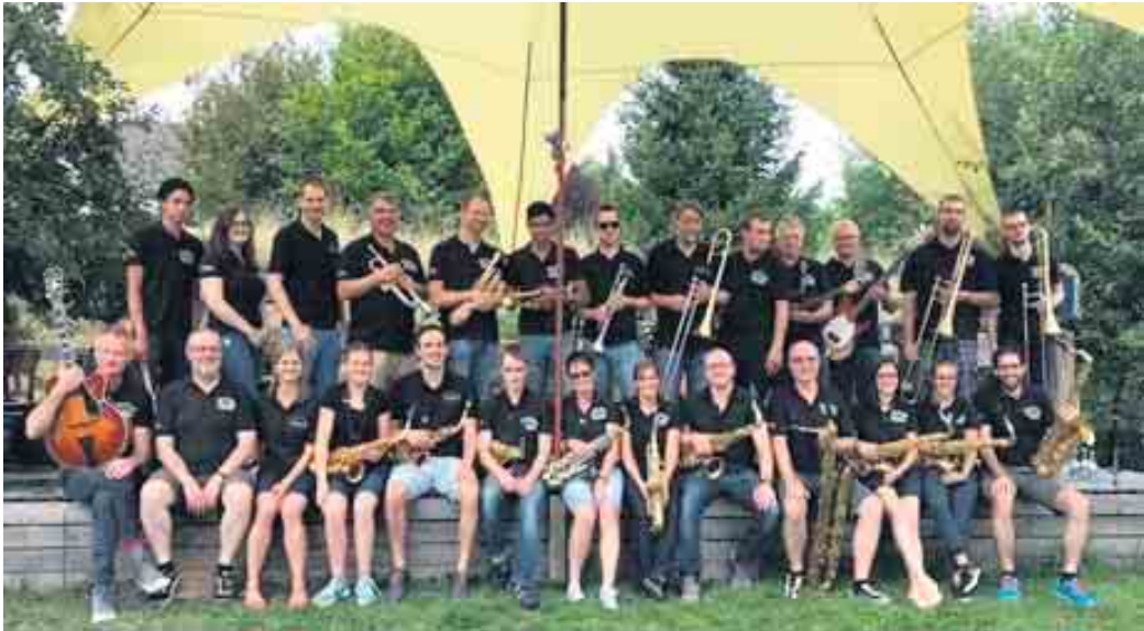
Is besonderes Highlight präsentiert am Samstag, den 7. September, um 19.30 Uhr im großen Kursaal, die BIGBAND der Musikschule Schleiden.

Schleiden - Zum ersten Mal finden am 7. und 8. September im Kurhaus Gemünd die EIFELER MUSIKTAGE, präsentiert vom Musikschulzweckverband Schleiden, statt. Neben zahlreichen Konzerten, abwechslungsreichen Workshops und Vorträgen erwartet Sie ein Musiker-Flohmarkt mit gebrauchtem Musik-Equipment sowie ein Instrumentenkarussell, bei dem Sie verschiedene Musikinstrumente anspielen können. Als besonderes Highlight präsentiert am Samstag, den 7. September, um 19.30 Uhr im großen Kursaal, die BIGBAND der Musikschule Schleiden unter der Leitung von Engelbert Schneider zusammen mit Gästen des Rockgenres bekannte Rockklassiker. Ganz unter dem Motto „Rock/Pop meets Classic“ hauchen die Musiker in außergewöhnlichen Arrangements