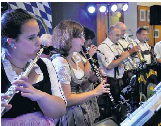
Hoch geht es im Saal Gier wieder her, wenn die Ahrhüttener Musikanten am 1. Oktober zum sechsten Oktoberfest aufspielen.