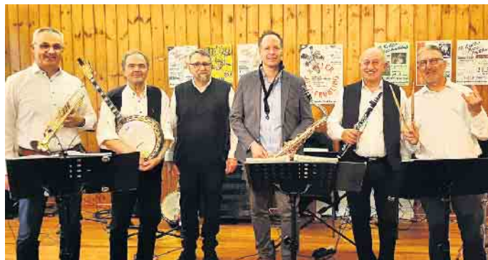
Gastieren am Freitag, 30. August, zum „Kaller Herbst-Jazz-“ im Saal Gier in Kall. Die Jazz-Band „Copper Town Dixie Cooperation“, die in diesem Jahr ihren 40. Geburtstag feiert.