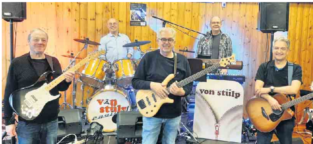
Spieren am Freitag, 23. August, im Saal Gier zum Warm-up der Kaller Kirmes auf. Die Band „Von Stülp“ hat in der Eifel eine große Fangemeinde.