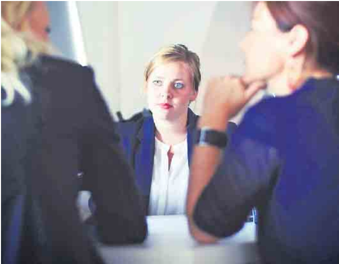
Mit gezielten Fragen können Bewerber im Vorstellungsgespräch ihr Interesse an einem Job untermauern.

persönliche Einblicke in die Büros oder die Fertigung zu bitten. „In jedem Fall empfiehlt es sich, jedes Vorstellungsgespräch individuell vorzubereiten und sich zuvor intensiv mit dem jeweiligen Unternehmen, seinen Produkten, der Marktposition sowie den wichtigsten Wettbewerbern zu befassen“, erklärt Henrik Straatmann vom Personaldienstleister Adecco. Fragen wie „Welche Qualitäten weisen die besten Mitarbeiter im Unternehmen auf?“ oder „Passe ich ihrer Meinung nach in das Unternehmen?“ unterstreichen zusätzlich das große Interesse des Bewerbers. Und eine Frage sollten Bewerber am Ende des Gesprächs keinesfalls vergessen: „Wann kann ich damit rechnen, wieder von ihnen zu hören?“ (djd)