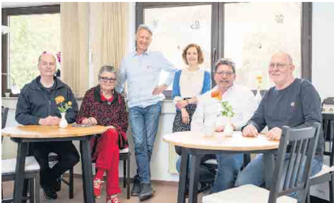
Das Ärztinnen-Therapeuten-Team der IPSU steht von der Flut 2021 belasteten Menschen aus Schleiden, Hellenthal und Kall mit seiner Expertise noch bis Ende 2024 kostenfrei zur Verfügung.

Traumazentrum IPSU steht Flutbetroffenen noch zur Verfügung Gemünd. Das, was sich am 14. Juli vor drei Jahren ereignet hat, dürfte den meisten von der Jahrhundertflut Betroffenen wohl für immer in Erinnerung bleiben. Wie sich einschneidende Erlebnisse auf die eigene Zukunft auswirken, hängt jedoch oft mit dem Umgang solcher Erfahrungen ab. Bei traumatischen Auswirkungen auf das Seelenleben bietet die Interkommunale Psychosoziale Unterstützung (IPSU) der drei Betreiberkommunen, Schleiden, Hellenthal und Kall, mit Fachpersonal der Malteser Fluthilfe NRW kostenlose Hilfsangebote. Menschen aus den drei Kommunen, die vom Hochwasserereignis im Juli 2021 betroffen waren, erfahren auf Wunsch seit Januar letzten Jahres kostenfrei unterschiedlichste Unterstützungsangebote zur Bewältigung des Erlebten. Auf der ersten Etage des HIZ (Hilfszentrum Schleidener Tal) an der Kölner Straße 10 bietet ein Team aus