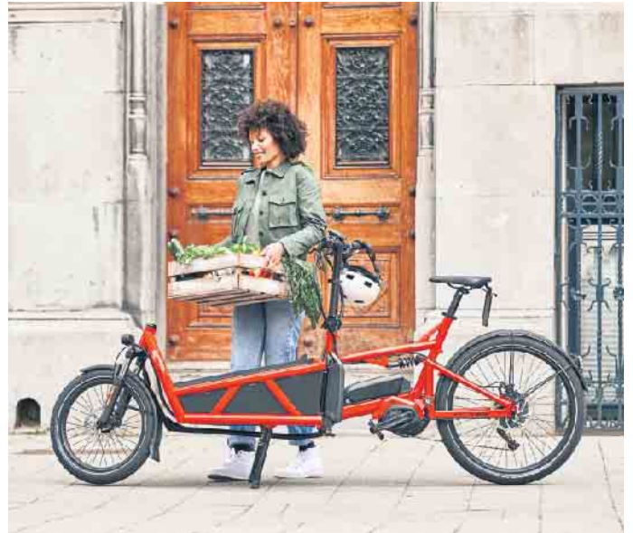
Lastenräder gehören in vielen Städten zum Alltagsbild. Mit elektrischer Unterstützung ermöglichen E-Cargobikes den bequemen Transport zum Beispiel von Wocheneinkäufen.

Sie entlasten nicht nur den Straßenverkehr, sondern schonen auch die Umwelt, da sie weniger Platz als ein Auto benötigen, keinen Lärm und keine Luftschadstoffe verursachen. Aufgrund der geringen laufenden Kosten dürften E-Cargobikes somit vielfach das bisherige Zweitauto der Familie ersetzen. Hinzu kommen zeitliche Vorteile, wenn man morgens im Berufsverkehr entspannt am Stau vorbeiradeln kann. Für Eltern, die den Nachwuchs beispielsweise zur Kita bringen möchten, eignen sich sogenannte Long-John-Modelle mit einer Ladefläche vor dem Lenker. Der Vorteil: Hier haben Mama oder Papa ihre Kids stets im Blick. Aber auch mit Long-Tail-Modellen, bei denen sich der Stauraum hinter dem Sattel befindet, lassen sich größere Kinder noch