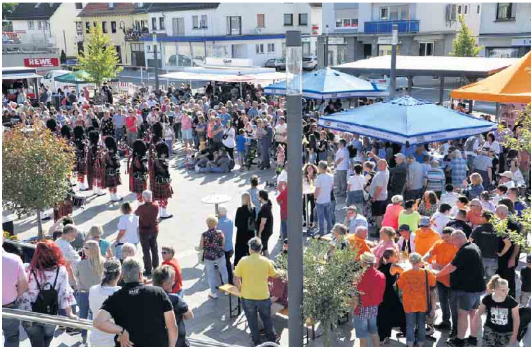
Ein Jahr danach - Kall sagt Danke: Auch am zweiten Tag des Gedenk- und Dankesfestes war der Bahnhofsvorplatz voll von Menschen.