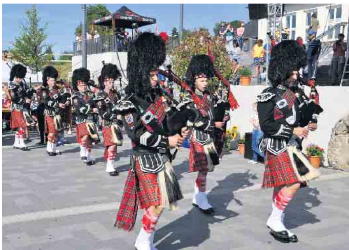
Sie begeisterten das Publikum beim Helferfest in Kall: Die Dreiborner Schotten „Drums & Pipes.

Die Kids nahmen das Spielangebot auf dem Rewe-Parkplatz