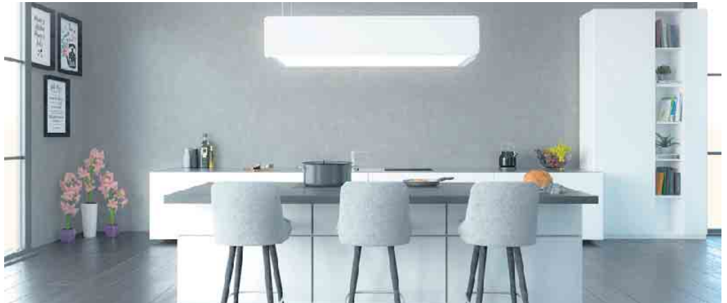
Per Liftfunktion höhenverstellbares, mehrfach ausgezeichnetes und vernetzbares Design-Modell - z. B. für einen komfortablen, automatischen Haubenbetrieb durch Zusammenschalten von Kochfeld und Haube.