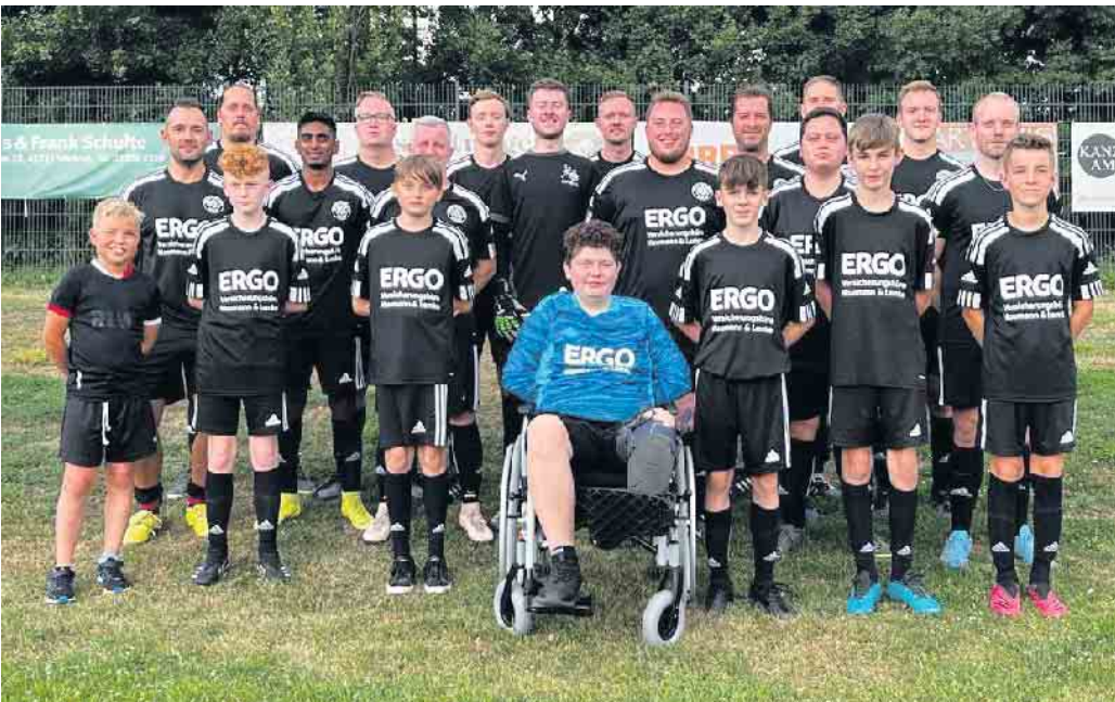
Auch der Kaller SC war mit von der Partie und nahm erfolgreich am Benefizspiel teil.

Am Samstag, dem 9. Juli erlebte der Kaller SC „auswärts“ einmal anders. Knapp 50 Vereinsmitglieder aller Riegen und Altersklassen fuhren zum Sommer- und Familienfest des FC Spvgg Oberwiese 01