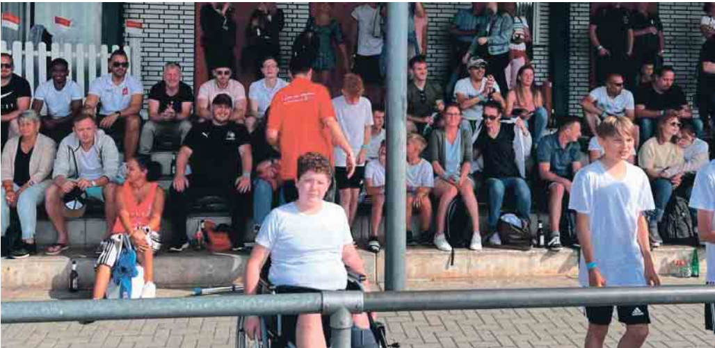
Insgesamt waren etwa 1.500 Besucherinnen und Besucher zum Sportevent der Oberwieser gekommen.