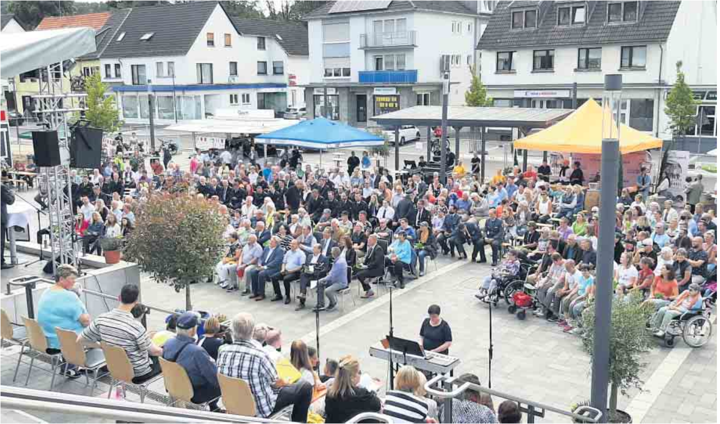
Ein Jahr nach der verhängnisvollen Flut fand auf dem neuen Bahnhofsvorplatz die zweitägige Gedenk- und Dankesfeier statt. An beiden Tagen kamen hunderte Besucher zu den Veranstaltungen.

der große Dank der Gemeinde, so der Bürgermeister: „Fühlen Sie sich alle in diesen Dank eingeschlossen, egal, ob Sie einen Bagger oder Trecker gefahren, den Schutt von der Straße geschippt oder Essen und Trinken verteilt haben; egal, oder Sie im Hintergrund gewirkt haben, in dem Sie den Keller der Nachbarn vom Unrat befreit, Worte des Trostes unter Nachbarn und Freunden gespendet, beim Ausfüllen von Formularen geholfen, oder ob Sie Sachen oder Geld gespendet haben“.