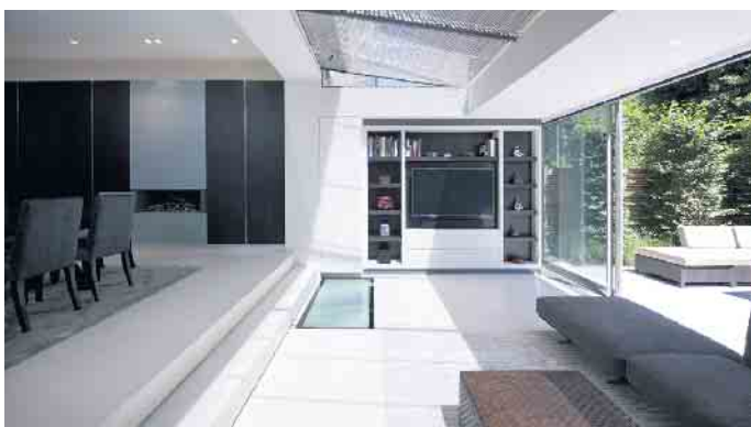
Bei Panoramafenstern bieten sich Sonnenschutzverglasungen besonders an.