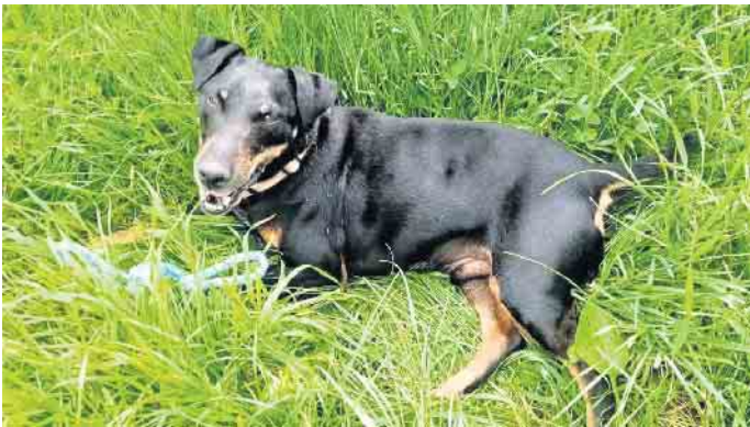
Terry sucht ein neues Zuhause mit netten und agilen Menschen für gemeinsame Unternehmungen an der frischen Luft.

Terry wurde von einem älteren Herrn im Tierheim Kall abgegeben, weil er aufgrund einer Lungenerkrankung nicht mehr genügend Luft hatte, um mit dem bewegungsfreudigen Rüden spazieren zu gehen. Terry (geb. 15. Oktober 2014) merkt man sein „reifes“ Alter nämlich überhaupt nicht an. Er ist ein agiler, freundlicher und unkomplizierter Terrier, der sehr gerne spielt, im Auto mitfährt und spazieren geht. Unterwegs und auch Zuhause verhält er sich gegenüber Menschen und z. B. Autos tadellos.