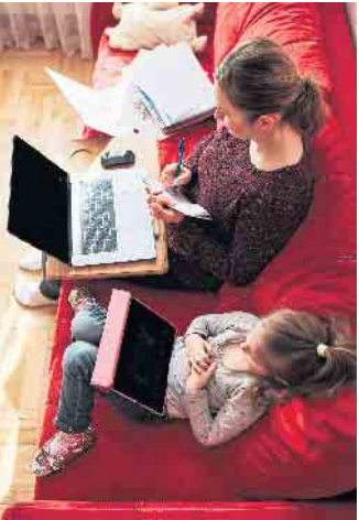
Mobiles Arbeiten kann bequem, aber gleichzeitig auch belastend sein.