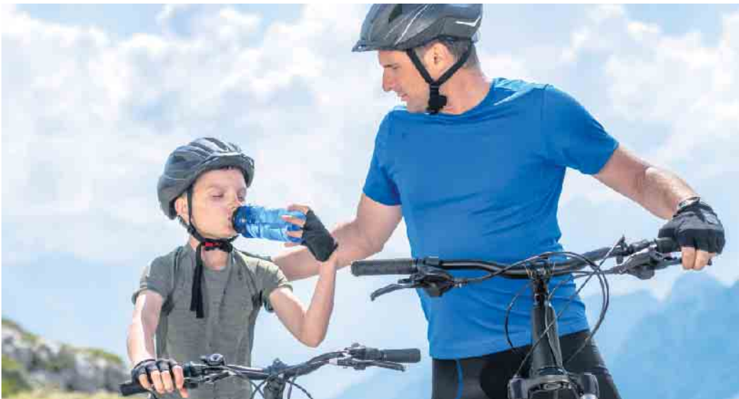
Bei Radtouren gilt es regelmäßig zu trinken, bevor der erste Durst zu spüren ist, zum Beispiel eine selbst angerührte Apfelschorle mit einer Prise Kochsalz.

Beim Radausflug auf den Elektrolythaushalt achten