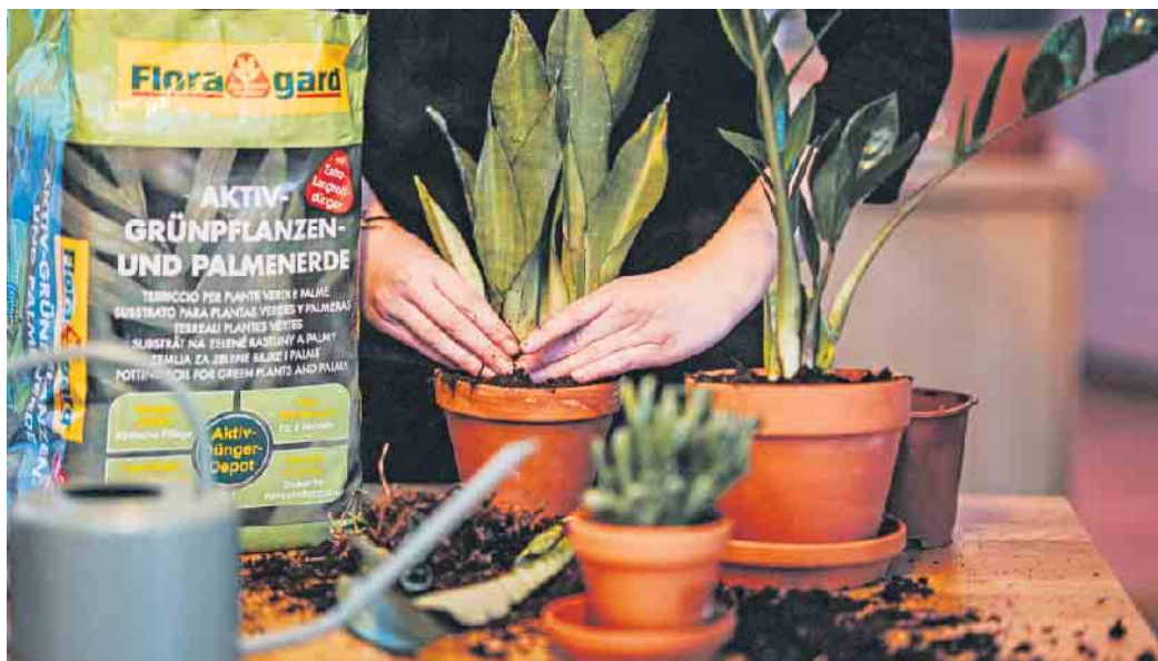
Praktisch sind Erden mit Langzeitdünger, sodass für bis zu drei Monate nicht nachgedüngt werden muss.

Die Natur ins eigene Zuhause holen: Pflanzen sorgen in jedem Raum im Handumdrehen für eine wohnliche Atmosphäre und dekorative Abwechslung, gleichzeitig fördern sie ein gesundes Raumklima. Wenn nur die aufwendige Pflege nicht wäre. Wer nicht mit einem grünen Daumen geboren wurde, tut sich oft schwer damit. Entweder wird das Grün viel zu viel oder zu wenig gewässert oder die Nährstoffzufuhr ist nicht für die jeweilige Pflanze angepasst. Dabei gibt es dauergrüne Vertreter, die ohne allzu viel Aufwand nahezu überall gedeihen.