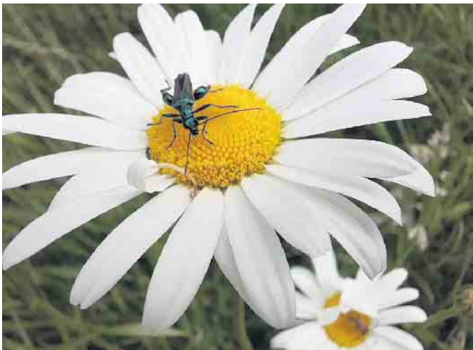
Ein Schenkeltäfer sucht Nahrung in einer Margerite.

Schleiden-Vogelsang: Im Juli und August finden im Naturschutz-Bildungshaus Eifel-Ardennen-Region in Schleiden-Vogelsang zwei Wochenendkurse zum Erkennen von Wildbienen und Käfern statt.