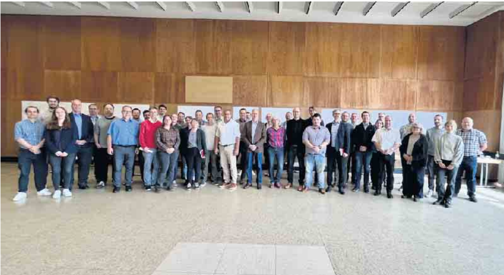
Die zahlreichen Teilnehmerinnen und Teilnehmer am Workshop in Hellenthal.

Workshop diskutiert Vorschläge zu potenziellen Maßnahmen