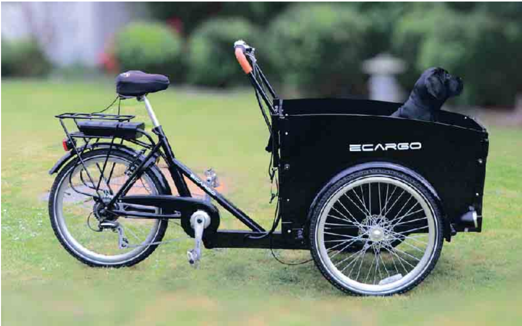
Grundsätzlich ist das Lastenrad eine sichere Methode, nicht nur Güter, sondern durchaus auch Kinder oder Tiere zu befördern.

Was darf transportiert werden und mit welchem Gewicht? Sachgüter, Tiere und Kinder sind als „Last“ erlaubt; bei bestimmten Modellen auch Erwachsene. Wichtig: Das maximale Gesamtgewicht errechnet sich aus dem Eigengewicht des Rades sowie des Fahrers und aus dem Gewicht der Fracht und darf nicht überschritten werden. Es unterscheidet sich von Modell zu Modell; Auskunft gibt das CE-Zeichen auf dem Rad-Rahmen. (mid/ak-o)