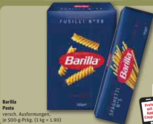
Barilla Pasta versch. Ausformungen, je 500-g-Pckg. (1 kg = 1.90)