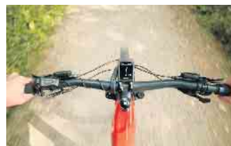
Am Display erkennen die E-Biker unter anderem, ob sie gerade über oder unter ihrer persönlichen Leistung und Trittfrequenz fahren.

fordern. Zudem sollten sich auch Sport-Enthusiasten zwischen jeder intensiven Einheit ein bis zwei Ruhetage zur Regeneration gönnen. Ein weiterer Tipp: E-Biken in der Gruppe macht noch mehr Spaß und fördert erfahrungsgemäß die persönliche Motivation. (DJD)