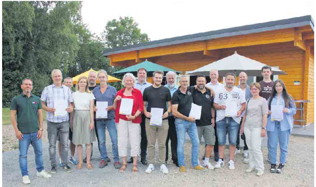
Am neuen Schevener Dorfhaus übergaben die Leader-Verantwortlichen die Förderbescheide an acht begünstigte Projektverantwortliche aus dem Kreis Euskirchen.

Das Schevener Vereinshaus war bereits 2021 komplett in Eigenleistung und mit Förderung des Landessportbundes entstanden. Mit der Förderung aus dem Regionalbudget soll es nun weiter ausgestattet werden, um auch als Jugend- und Seniorentreff genutzt zu werden und so die Dorfgemeinschaft zu stärken. „Der FC Scheven macht seit Jahren vieles im Dorf, das über den Sport hinausgeht - und das soll auch so bleiben“, so Kalle Klinkhammer bei der Vorstellung des Projektes. Bereits seit über 25 Jahren werde die Altpapiersammlung organi-