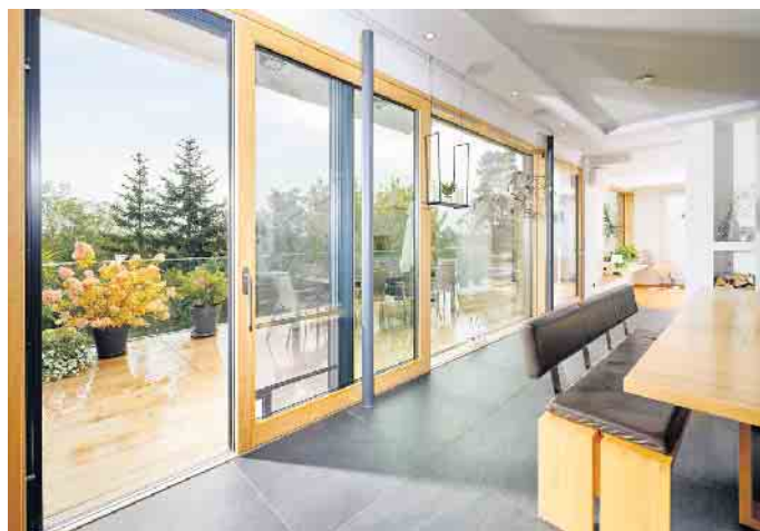
Holzfenster: der nachhaltige Klassiker.

Expertentipp: „Egal ob Holz-, Kunststoff- oder Aluminiumfenster: Ein- bis zweimal im Jahr sollte man seine Fenster pflegen und die Beschläge ölen, die Dichtungen fetten und die Rahmenprofile reinigen. Gerade im Herbst vor der kalten Jahreszeit ist das wichtig. Das erhöht die langfristige Funktionssicherheit von Fenstern und Balkontüren beträchtlich.“ (VFF/FS)