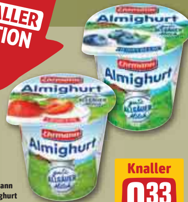
Ehrmann Almighurt versch. Sorten, je 150-g-Becher (1 kg = 2.20)