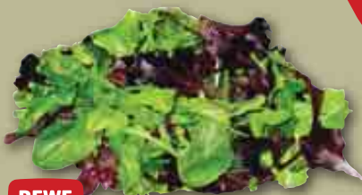
REWE Beste Wahl Italien: Wildkräuter Salat je 125-g-Schale (1 kg = 9.52)