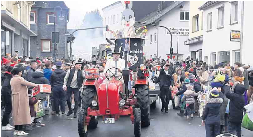
Dank der großen Spendenbereitschaft der Kaller Bevölkerung konnten die „Löstige Bröder“ einen tollen Karnevalszug auf die Beine stellen.

Gaststätte Gier, die Kindersitzung finde am Samstag, 13. Januar, und die Proklamations-Sitzung am Samstag, 20. Januar, im Dorfsaal in Scheven statt. Eine Woche später, am 27. Januar, erfolge die Eröffnung des Standquartieres im Saal Gier. Am Weiberdonnerstag, 8. Februar, werden die Löstige Bröder mit Möhnen und Prinzengarde das Rathaus erstürmen, der traditionelle Karnevalsgottesdienst ist am Samstag, 10. Februar. Sonntags, 11. Februar, startet der Karnevalszug, und am Dienstag, 13. Februar, heißt es im Saal Gier „Bye, Bye Karneval“ mit Ausklang und Auskleiden der Tollitäten. Bezüglich des Karnevalszuges und des Zugausklanges herrsche noch Unklarheit über den Zugweg, berichtete Simone Saßmann, weil man derzeit noch nicht absehen könne, wie weit die Bauarbeiten in der Bahnhofstraße dann fortgeschritten seien. „Wir werden dann spontan entscheiden“, so die Vereins-Chefin. Sie sei froh, mit Daniele Goebel und Uwe Schubinski ein engagiertes Zugleiter-Duo gefunden zu haben, das trotz Wind und Regen bei seiner Zug-Premiere im Februar dieses Jahres mit einer entsprechenden Aufgabenverteilung einen guten Job gemacht habe. Wie Simone Saßmann berichtete, hat der Verein in der Hüttenstraße eine kleine Wohnung zu einem