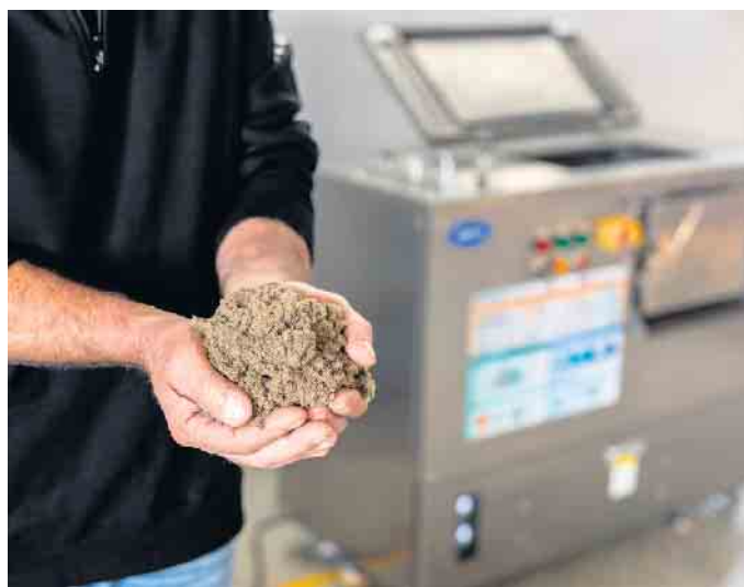
Nach der Faseraufbereitung im Bio-Konverter bleibt ein sehr zellulosehaltiger Sekundärrohstoff, der zu Industripappe weiterverarbeitet werden kann.

Herstellung weiterer biobasierter Kunststoffe wiederverwendet werden kann.