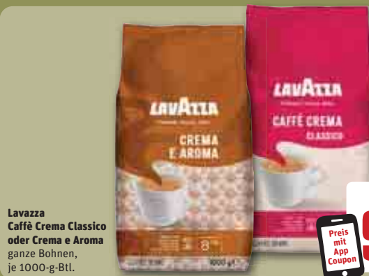
Lavazza Caffè Crema Classico oder Crema e Aroma ganze Bohnen, je 1000-g-Btl.