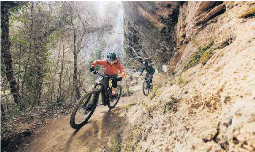
Das E-Bike ist das passende Trainingsgerät für alle, die gezielt ihre Fitness verbessern möchten.

So lässt sich das E-Bike als digitaler Trainer und Sportgerät nutzen