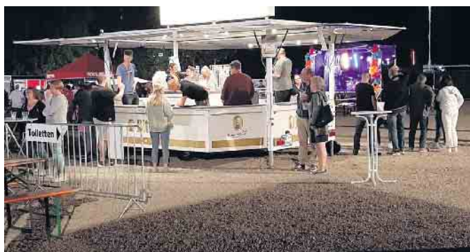
Obwohl annähernd 2.000 Besucher bei der 23. Oldienacht fast acht Stunden lang gefeiert hatten, blieb der Festival-Platz (hier gegen 1 Uhr nachts) frei von Müll.