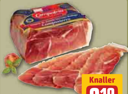
Campofrio Serrano-Schinken je 100 g