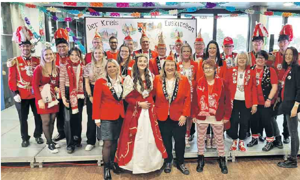
Viel „op Jöck“ waren die „Löstige Bröder“ in der ersten Session nach Corona und Flut. Unser Foto zeigt den Verein beim Prinzenempfang des Landrates.