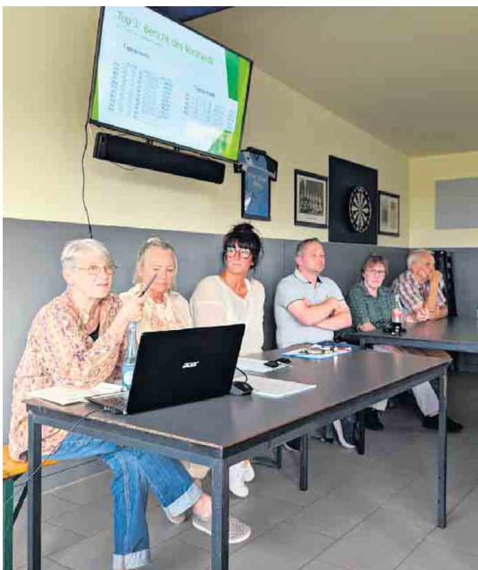
Über die schwierige finanzielle Situation der Frischegenossenschaft eG berichteten Vorstand und Aufsichtsrat bei der Jahreshauptversammlung.

Bürgermeister Esser möchte die Akteure der Sistiger Frische- genossenschaft mit Aufsichtsräten und Vorständen anderer, nicht-gewinnorientierter Genossenschaften, die sich dauerhaft über passende Förderprogramme refinanzieren, in Kontakt bringen. Darüber hinaus sagte Esser zu, erneut bei der Bewilligungsbehörde anzufragen, ob die Frische- genossenschaft Mittel aus dem „Stärkungspakt NRW“ erhalten kann, welcher insbesondere zur Kompensation gestiegener Energiekosten gedacht ist.