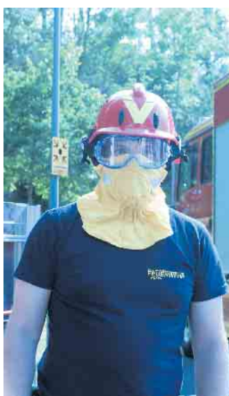
Beim Austausch zur Vegetationsbrandprävention und -Bekämpfung im Nationalpark Eifel stellten die Feuerwehren u.a. Schutzkleidung und Spezialausrüstung vor.

Alle Beteiligten sind sich einig, dass der Austausch fortgeführt werden soll. Gemeinsame praktische Übungen im und am Nationalpark Eifel sind geplant. Die Nationalparkverwaltung bietet außerdem alle zwei Jahre an, bei örtlichen Befahrungen mit den Feuerwehren die Eignung der Wege für Einsatzfahrzeuge zu prüfen. Die protokollierten Kontrollen für dieses Jahr sind bereits erfolgt und Maßnahmen wurden abgeleitet.