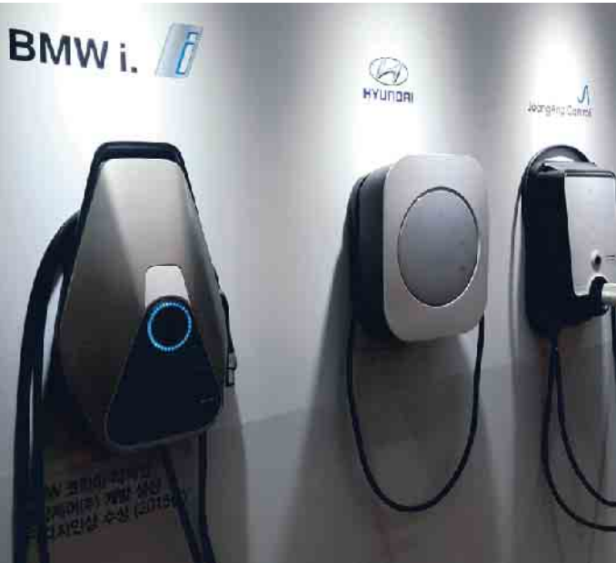
Für Autofahrer ist das Ladeangebot noch recht unübersichtlich.

Damit E-Autos für alle attraktiver werden, braucht es laut ACE aber seitens der Hersteller mehr Modellvielfalt. Vor allem Kleinwagen und preiswerte Familienautos seien jetzt gefragt, nicht Pkw aus dem Luxussegment. Auch der Ausbau der Ladeinfrastruktur müsse weiter konsequent vorangetrieben werden. E-Mobilität dürfe nicht nur für Besitzer eines Eigenheims alltagstauglich und erschwinglich sein. Insbesondere Mieter bräuchten Lösungen, um unkompliziert laden zu können. (mid/ak-o)