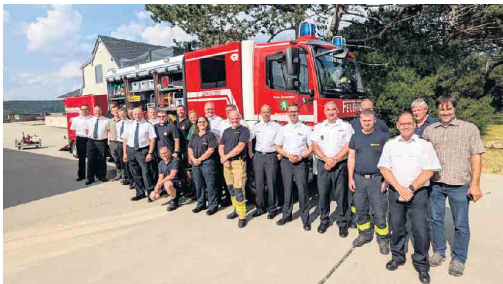
Die Nationalparkverwaltung Eifel tauschte sich mit den Feuerwehren der Nationalpark-Gebietskörperschaften zur Prävention und Bekämpfung von Vegetationsbränden aus.

Um dennoch entstehende Vegetationsbrände im Nationalpark Eifel im Notfall besser bekämpfen zu können, trafen sich am 23. Juni Vertreter*innen der Nationalparkverwaltung Eifel, der StädteRegion Aachen, der Kreise Düren und Euskirchen sowie der Feuerwehren der Nationalpark-Städte und -Gemeinden Heimbach, Hellenthal, Kall, Mechernich, Monschau, Nideggen, Schleiden und Simmerath zu einem Abstimmungsgespräch im Nationalpark-Zen-