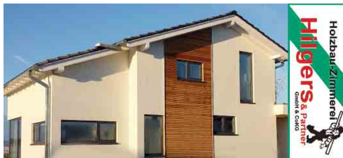
Hilgers & Partner GmbH & Co KG der Weg zu Ihrem Eigenheim Trierer Str. 5-9, Schleiden (02445) 852450 www.holzbau-hilgers.de