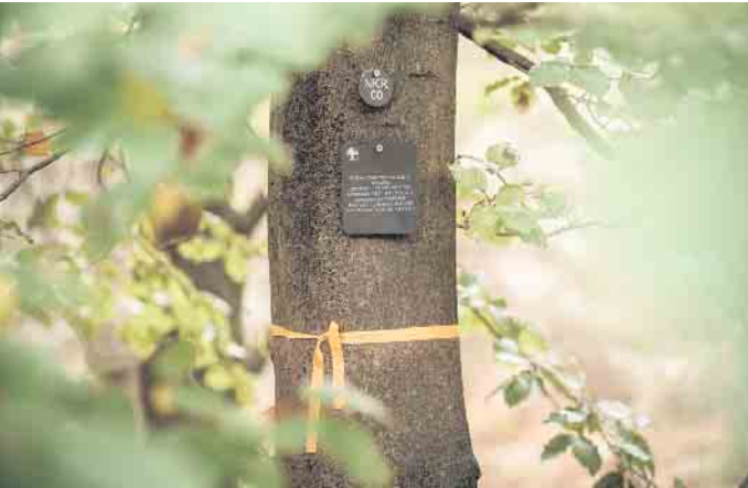
Ein Grab in einem Bestattungswald kann über die Baumnummer und eine Namenstafel gefunden werden.