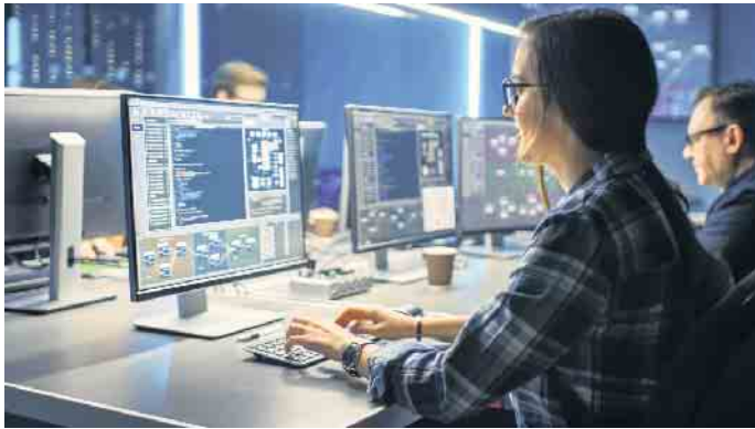
Cybercrime hat sich in den vergangenen Jahren zu einer ernstzunehmenden Bedrohung für die Wirtschaft und die öffentliche Sicherheit entwickelt. In einem berufsbegleitenden Fernstudium lernen IT-Fachkräfte, Cybercrime aktiv zu bekämpfen.

den Fernstudiengängen gibt es unter www.wings.de/it-forensik . Umfassende Ausbildung gegen Hacker Rund 300 IT-Forensiker und Sicherheitsexperten haben bereits ihren staatlichen Hochschulabschluss gemacht. Insbesondere für IT-Fachkräfte bietet das Fernstudium die Möglichkeit, sich neben dem Beruf praxisnah und wissenschaftsbasiert spezifisches Fachwissen anzueignen. Die angehenden IT-Sicherheitsexperten setzen sich vor allem mit dem technischen Vorgehen von Hackern auseinander: Dem Datendiebstahl von Smartphones und Tablets, dem Hacken persönlicher Profile in sozialen Netzwerken oder dem Lahmlegen