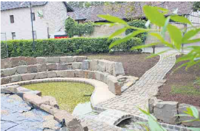
Fast fertig: Ein noch schmuckeres Plätzchen wurde mit der Sanierung des Beckens an der „Klus“ geschaffen.

stellen, und das Verfahren zog sich über zwei-einhalb Jahre hin. Reiff: „Schließlich hat die Denkmalbehörde entschieden, dass es kein Denkmal ist.“ Endlich konnte es weitergehen - jedenfalls beinahe, denn nun musste noch die wasserrechtliche Genehmigung für den Umbau beantragt werden. Als auch das geschafft war, konnte es Mitte Mai 2024 endlich losgehen. Bei der Ausschreibung der Arbeiten erhielt eine Firma aus dem Gemeindegebiet den Zu-