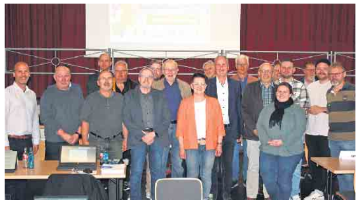
Einstimmiges Votum und ein klares Zeichen: Der Rat der Gemeinde Kall hat sich der „Trierer Erklärung“ des Deutschen Städtetages angeschlossen.

In unseren Städten leben Menschen unterschiedlicher Herkunft zusammen - als Nachbarinnen und Nachbarn, als Kolleginnen und Kollegen, als Freundinnen und Freunde, als Familie. Das ist die Lebensrealität in unseren Stadtgesellschaften. Das macht unsere Städte aus. Unsere Städte gehören allen Menschen, die hier leben. Wir akzeptieren nicht, dass Bürgerin-