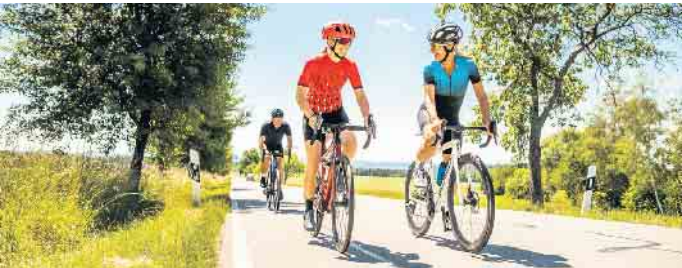
Alles Typsache: Für sportliches Fahren mit hoher Geschwindigkeit ist ein Rennrad das Richtige.

nicht schon das richtige Fahrrad ist und mit passendem Zubehör wieder fit gemacht werden kann. Soll es doch ein neues sein, kann man an unseren Service-Points in Dresden und Berlin ein professionelles Bike Sizing mit Körpervermessung nutzen.“ Denn für das perfekte Radgefühl muss nicht nur der Typ, sondern auch die Größe stimmen. (DJD)