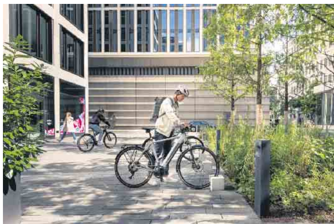
Sorgenfreier unterwegs: Mit einem digitalen Diebstahlschutz wird das Abstellen von E-Bikes noch sicherer.

Das E-Bike schlägt selbst Alarm Daneben sind zusätzliche digitale Schutzfunktionen wie „eBike Alarm“ von Bosch sinnvoll. Diese lässt sich über die „eBike Flow App“ aktivieren und sorgt für noch mehr Sicherheit und besseren Schutz. Wird das E-Bike abgestellt und ausgeschaltet, aktiviert sich das Alarm-Feature automatisch. Das Smartphone dient