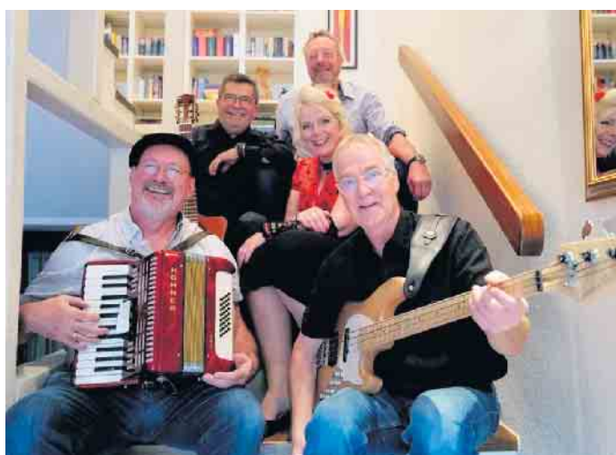
Den Samstagabend gestaltet die Band „Die Oldtimer“.