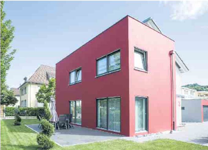
Fassadenfarben setzen markante Akzente und bieten oft weitere Funktionen, wie den Schutz vor dem Ausbleichen oder Aufheizen der Fassade durch die Sonne.

für die individuellen Wünsche empfiehlt, dazu können Profis aus dem Handwerk beraten. Unter www.sto.de/fachhandwerkersuche etwa finden sich Ansprechpartner aus der Region.