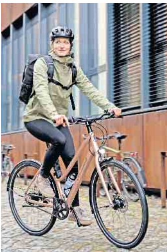
Durch die Stadt radelt es sich am besten mit Citybikes. In der modernen Variante Urban Bike punkten sie mit Purismus und Schnelligkeit.