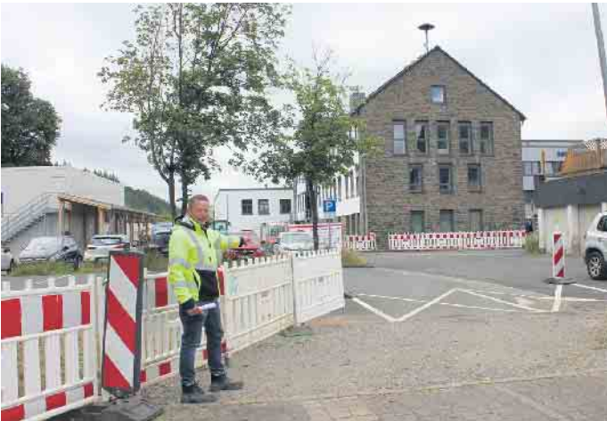
Ab dem 1. Juli ist der Rathausparkplatz für mehrere Wochen nur über eine Zufahrt vom Parkplatz hinter der „Alten Post“ aus erreichbar.

Kall - Die Zufahrt zum Parkplatz hinter dem Rathaus muss in der 27. Kalenderwoche (ab 1. Juli 2024) für mehrere Wochen gesperrt werden. Die Parkplätze hinter dem Rathaus sind in dieser Zeit über die Zufahrt am Gebäude „Alte Post“ anfahrbar. Hintergrund ist, dass im Zuge der Sanierungsarbeiten in der Bahnhofstraße die Bordsteine und Bürgersteige im Bereich Rathauszufahrt sowie zudem auch der Rathausvorplatz selbst