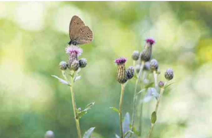
Wildblumen dekorieren die Baumgräber in einem Bestattungswald und locken natürliche Gäste an.

Wie Angehörige und Freunde im Bestattungswald trauern und gedenken