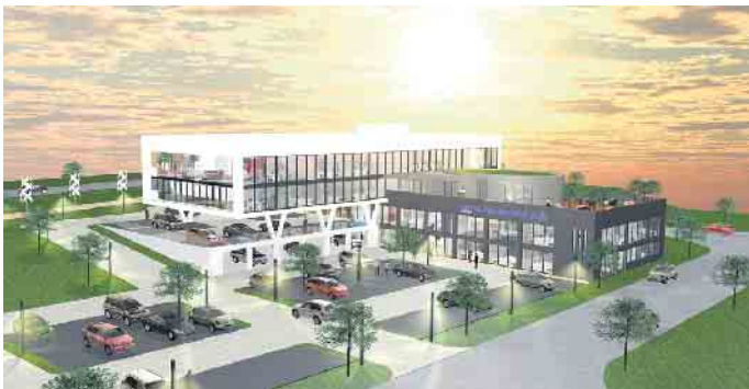
So soll die neue Hauptstelle der VR-Bank Nordeifel in Kall aussehen. Grafik: Architekturbüro Michael Graf/pp/Agentur ProfiPress