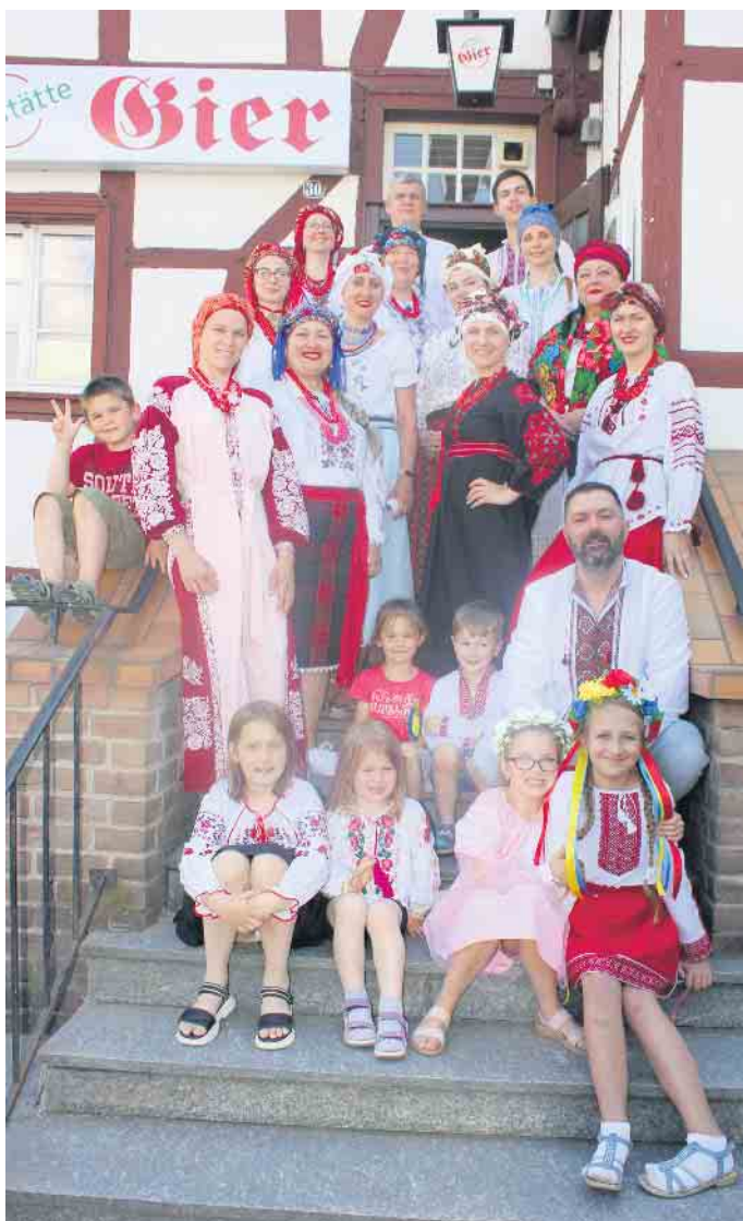
In traditionellen Trachten präsentierte der Projektchor im Saal Gier alte ukrainische Volkslieder.

Begegnungscafé stand diesmal unter „blau-gelbem“ Motto - ukrainische Speisen, Musik und Tänze