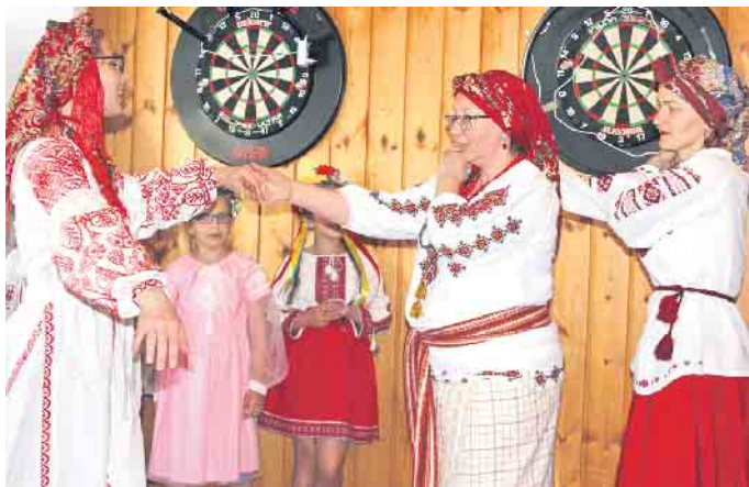
Die Sängerinnen und Sänger zeigten auch traditionelle Tänze.