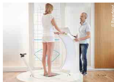
3D-Vermessung für Kompressions- strümpfe und orthop. Einlagen