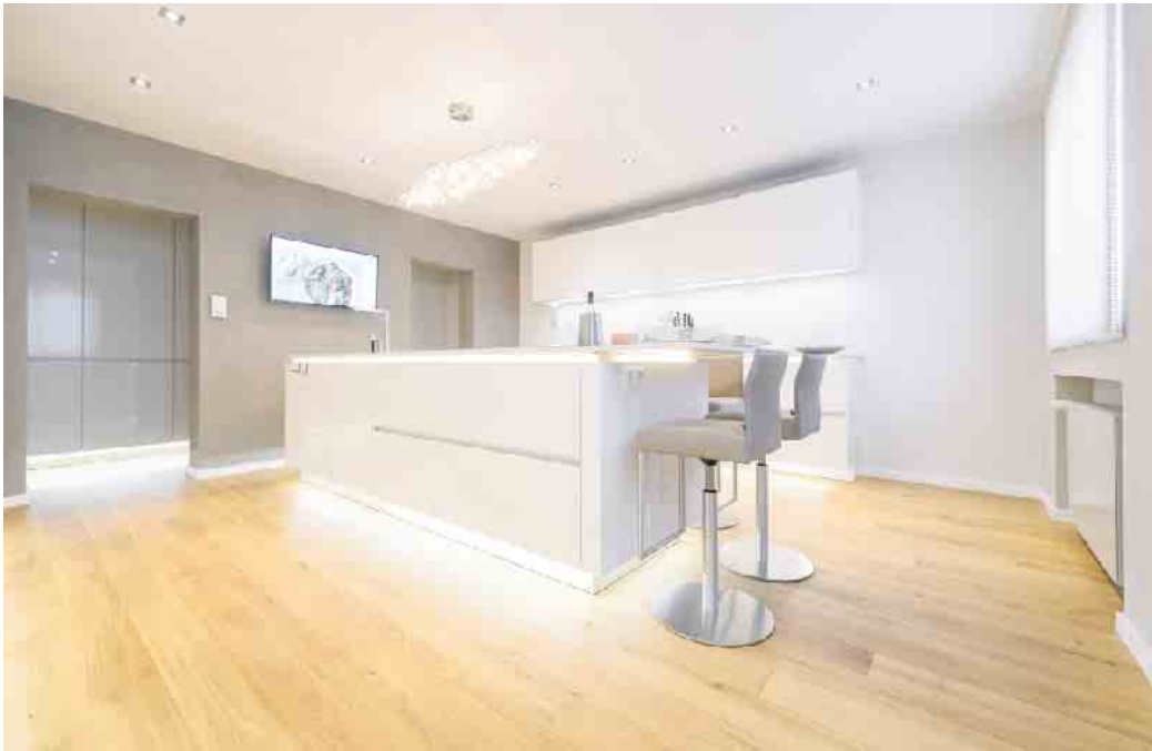
Eiche, der Liebling unter den Parketthölzern, erfreut das Auge mit seiner markanten Maserung. Darüber hinaus ist es robust und deshalb auch problemlos für den Einsatz in Bad und Küche geeignet. Eiche stammt wie einige andere Holzsorten aus heimischen Wäldern und ist daher besonders nachhaltig.

für Parkett ist nach wie vor Eiche. Rund 80 % des verkauften Parketts in Deutschland sind nach Branchenangaben aus diesem Holz. Verbraucherinnen und Verbraucher schätzen an Eichenholz neben der markanten Maserung, dass es hart und robust ist und auch stärkerer Beanspruchung standhält. Dank dieser Eigenschaften ist es selbst für den Einsatz in Bad und Küche geeignet. Weitere Holzsorten, die für Parkettböden verwendet werden, sind Buche, Esche, Ahorn, Kirsche, Nussbaum und Birke. Die Verwendung von weiche Nadelhölzern wie Kiefer und Fichte ist für Parkett nicht