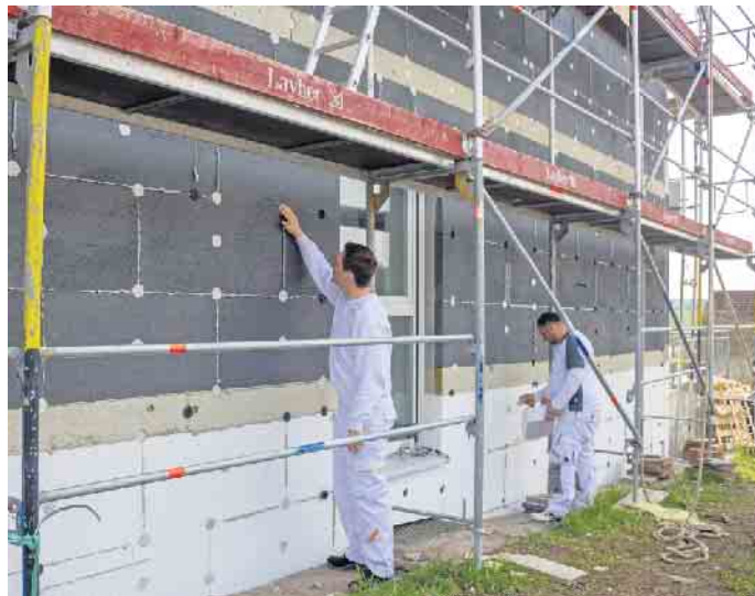
Angesichts hoher Energiepreise amortisiert sich das energetische Sanieren noch schneller.