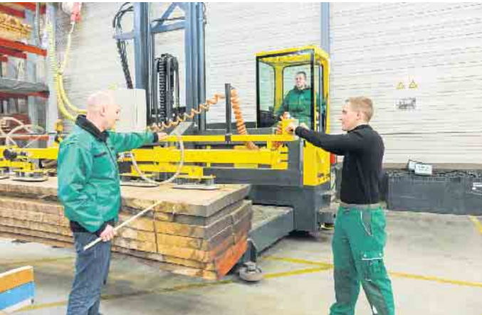
Ob im kaufmännischen Bereich, in der Verarbeitung oder der Logistik: Der Holzfachhandel bietet attraktive Ausbildungs- und Berufsperspektiven.

Vielfältige Ausbildungs- und Karrierechancen im örtlichen Fachhandel