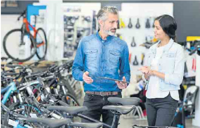
Beim Fahrrad stößt der Onlinekauf an Grenzen: Eine gute Beratung im Fachhandel ist durch nichts zu ersetzen.

Zweiradboom: So hat man auch bei längeren Touren Freude am neuen Fahrrad