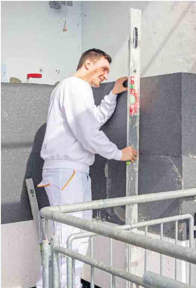
Dämmen durch den Profi: Die fachgerechte Ausführung stellt Langlebigkeit und Wirksamkeit des Wärmeschutzes sicher.

gem Gewicht - wichtig gerade für die Altbausanierung. Zudem ist das Material langlebig, sicher und dank heutiger Technik nach Jahrzehnten der Nutzung anschließend recycelbar. (djd)