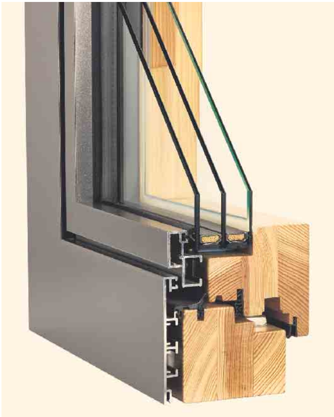
Das Beste zweier Welten miteinander verbinden: Querschnitt durch einen Holz-Aluminium-Fensterrahmen.

Kunststofffenster, bevorzugt im Wohnungsbau verwendet, sind wahre Allrounder. Wie auch bei Holzfenstern ist ein hoher technischer und gestalterischer Anspruch bei diesen Fenstern heute Standard. Kunststofffenster sind besonders leicht zu pflegen und zeichnen sich durch ihre hohe Witterungsbeständigkeit, ihre Schlagfestigkeit und besonders glatte Oberflächen aus. Ein Nachstreichen ist nicht erforderlich, was Folgeaufwand deutlich reduziert. Die Pflege und Wartung beschränken sich überwiegend auf das Ölen und Einstellen der Beschläge, Fetten der Dichtungen und