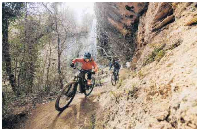
Das E-Bike ist das passende Trainingsgerät für alle, die gezielt ihre Fitness verbessern möchten.

So lässt sich das E-Bike als digitaler Trainer und Sportgerät nutzen