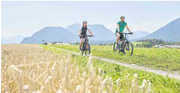
Nach längeren Ausflügen kennen die meisten Radlerinnen und Radler das Phänomen, dass Po, Rücken und Nacken immer wieder mal schmerzen. Mit der richtigen Einstellung des Bikes lässt sich das vermeiden.