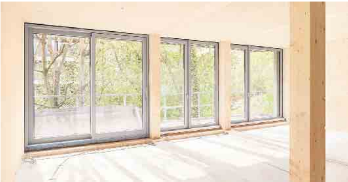
Lichtdurchflutete Räume, eingerahmt von eleganter Metall-Optik: Fensterrahmen aus einem Aluminium-Holz-Verbund bieten viele Gestaltungsmöglichkeiten gerade für großformatige Fenster.

Reinigen der Rahmenprofile. Kunststofffenster werden in einer großen Farbpalette angeboten. Zudem bieten sie gute Wärmedämmwerte. In der Anschaffung sind sie in der Regel preisgünstiger als Holz- oder Aluminiumfenster. Werden Kunststofffenster ausgetauscht, können sie nach jahrzehntelanger Nutzung übrigens nahezu vollständig recycelt werden.