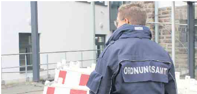
Das Ordnungsamt informiert zum Schutz der Mittagsruhe.

ist an Werktagen (Mo.- Sa.) während der Zeit von 13 Uhr bis 14.30 Uhr (allgemeine Ruhezeit) jede Tätigkeit untersagt, die mit einer besonderen Lärmentwicklung verbunden ist und die allgemeine Ruhezeit stören könnte. Als solche Tätigkeiten gelten insbesondere 1. der Betrieb von Rasenmähern mit Benzinmotor 2. Holzhacken, Hämmern, Benutzung von Baumaschinen und -geräten, Kreis- oder Motorsägen, usw. Die Bevölkerung wird gebeten, diese allgemeine Ruhezeit zu beachten und einzuhalten.