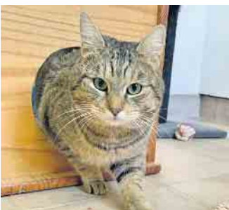
Kater Teddy sucht ein neues Zuhause.