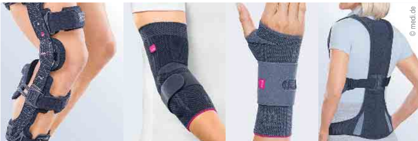
Direktversorgung von Bandagen und Orthesen