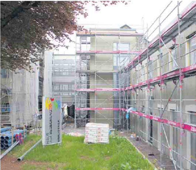
Gut 1,3 Millionen Euro wurden mit dem Wiederaufbauplan zur Wiederherstellung des Hauses der Begegnung bewilligt.

minarmöbel und -technik, eine Küche und zwei Büros mit Equipment. Die rund 20 Partner/innen wie die GenoEifel eG; die VHS, die Euroschulen, das DRK, der Jugendmigrationsdienst und andere mussten sich nach der Flut kurzfristig alternative Räumlichkeiten suchen. Mittlerweile haben einige von ihnen bereits zugesagt, 2024 wieder ins Haus der Begegnung zurückzukommen.