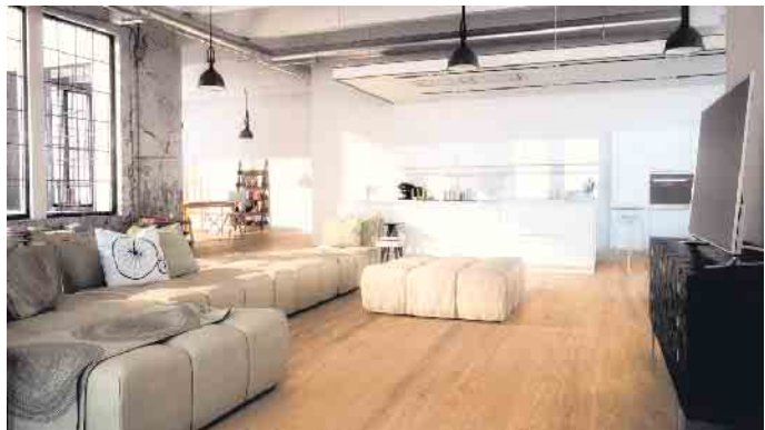
Parkett: nachhaltig, langlebig, umweltfreundlich.

nen Parkettboden, liegen einem nicht nur die vielen ästhetischen Vorteile von echtem Holz zu Füßen“, betont Schmid abschließend. „Mit der Wahl für Parkett wird es einem auch die Umwelt danken.“ (vdp/fs)