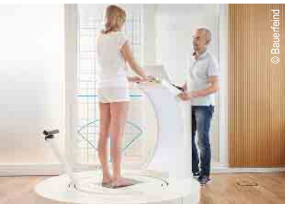
3D-Vermessung für Kompressions- strümpfe und orthop. Einlagen