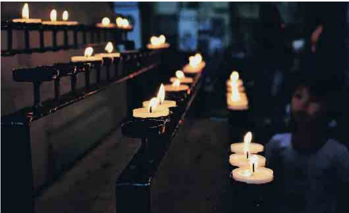
Sterben und Abschiednehmen gehören zum Leben dazu und jeder hat ein Recht auf seine persönlichen Trauerrituale.

Jahr um Jahr erleben die allermeisten von uns Urlaube und Feiertage als wohltuende Unterbrechung unseres Alltags. Wir versuchen zur Ruhe zu kommen und nehmen uns Zeit für Familie und Freunde. Wir gönnen uns eine gedankliche Auszeit von den vielen Fragen, die im Privat- und im Berufsleben unsere Aufmerksamkeit fordern. Für Trauernde sind Feiertage seit jeher eine Herausforderung. Wer den Verlust eines geliebten Menschen verarbeitet, der fühlt sich im üblichen Rummel und angesichts der allgemeinen Vorfreude oft fehl am Platz. Insbesondere das erste Fest ohne einen nahen, vielleicht sogar ohne den nächsten Menschen ist für viele Trauernde eine emotionale Belastung. Mancher sucht vielleicht gerade den Anschluss und möchte die Feiertage in Gesellschaft verbringen; mancher ist lieber