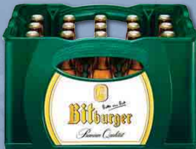
Bitburger Stubbi Pils je 20 x 0,33-l-Fl.-Kasten (1 l = 1,21) zzgl. 3.10 Pfand