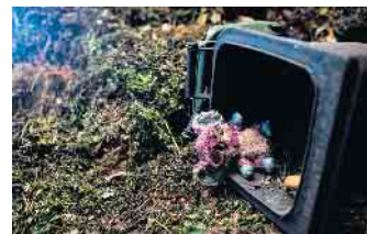
Am 26. Mai ist offizieller „Tag der Biotonne“.

Weitere Informationen gibt es bei der Kreisabfallberatung unter abfallberatung@kreis-euskirchen.de oder unter Tel. 02251-15-371 oder unter