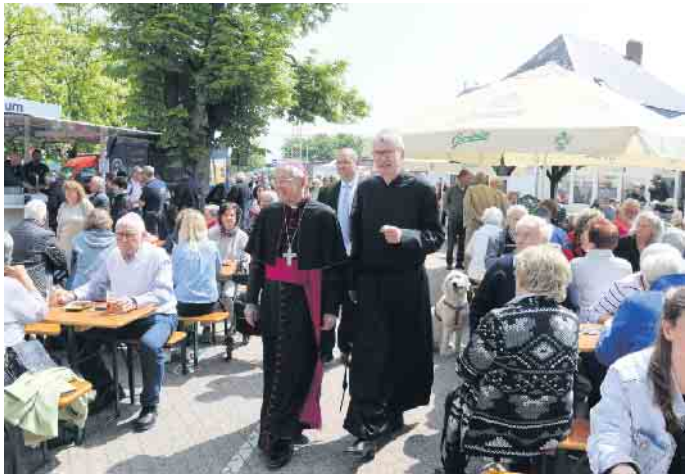
Mit dem Hermann-Josef-Markt kehrt ein traditionsreiches Fest an seine Ursprünge zurück - eine richtige Entscheidung wie die Besuchermassen zeigen.