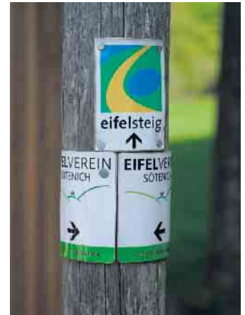
Die Sistiger „Arnikarunde“ ist Teil des Eifelsteigs