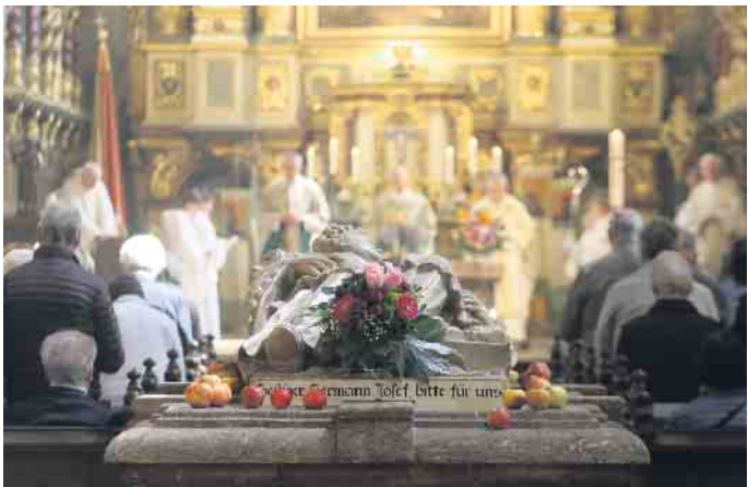
Die erste nachweisliche urkundliche Erwähnung des Klosters wurde am Sonntag beim Hochamt mit Dr. Ludwig Schick, Erzbischof em. von Bamberg, gefeiert.