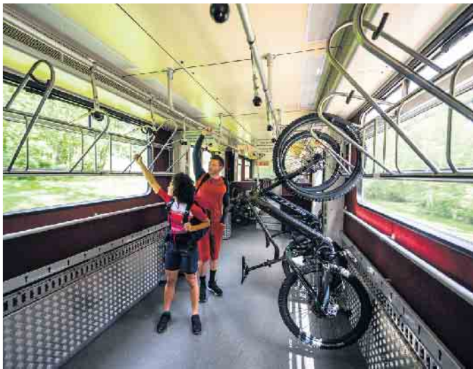
Auch mit der Bahn lassen sich E-Bikes an den Urlaubsort transportieren.

netzte Displays wie „Nyon“ von Bosch bieten die Möglichkeit, Routen vorab zu planen und zu navigieren. Für den Transport von E-Bikes zum Urlaubsziel sind Kupplungsträger fürs Auto erste Wahl. Währenddessen sollte der Akku entfernt und sicher verstaut werden. Auch die komfortable Reise mit dem Zug ist möglich. Im Regional- und Fernverkehr dürfen meistens E-Bikes bis zu einer Höchstgeschwindigkeit von 25 Stundenkilometern an Bord, wenn man zuvor eine Fahrrad-