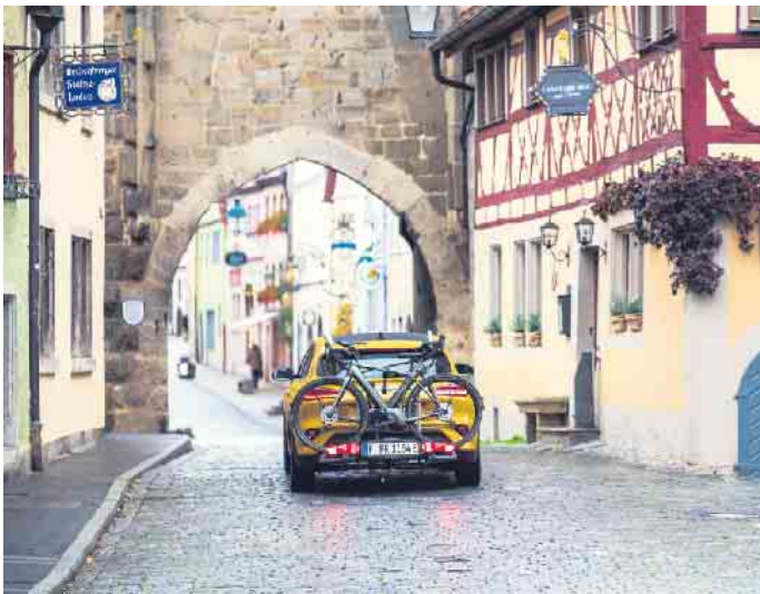
Für den Transport von E-Bikes bieten sich Kupplungsträger am Auto an.

prinzip mit mehreren Schichten bewährt: luftig und leicht für bergauf, winddicht für bergab. Ein Rucksack mit Akkufach eignet sich, um einen Zweitakku oder ein Ladegerät sicher zu verstauen. Für kleinere Reparaturen empfiehlt es sich, ein Multitool, einen Ersatzschlauch und eine Luftpumpe im Gepäck zu haben. Bei der Routenwahl sollten Urlauber nicht nur die individuelle Fitness, sondern auch eigene Präferenzen, etwa bei der Tourenauswahl, beachten. Ver-