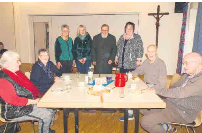
In Kooperation mit der Pfarre St. Nikolaus in Kall bietet die Fluthilfe des Caritasverbandes für die Region Eifel einen offenen Spieletreff für Erwachsene an.