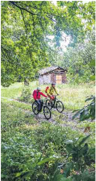
Genug Power für jede Etappe: Vernetzte Bordcomputer helfen bei der Tourenplanung und der Nutzung der Akku-Kapazitäten.

Utensilien für ein Picknick zu transportieren. Kraftvolle Unterstützung im richtigen Moment und ein sicheres Fahrgefühl bietet etwa die Cargo Line von Bosch. Beim „Long John“ mit der Ladefläche zwischen Lenker und Vorderrad hat man die Kids stets im Blick, beim „Long Tail“ sitzen die Kinder gut und sicher hinten auf dem Rad. Ob größere Radreise oder Auszeit vom Alltag - eine Entdeckungstour mit dem E-Bike ist immer eine gute Idee. (djd)