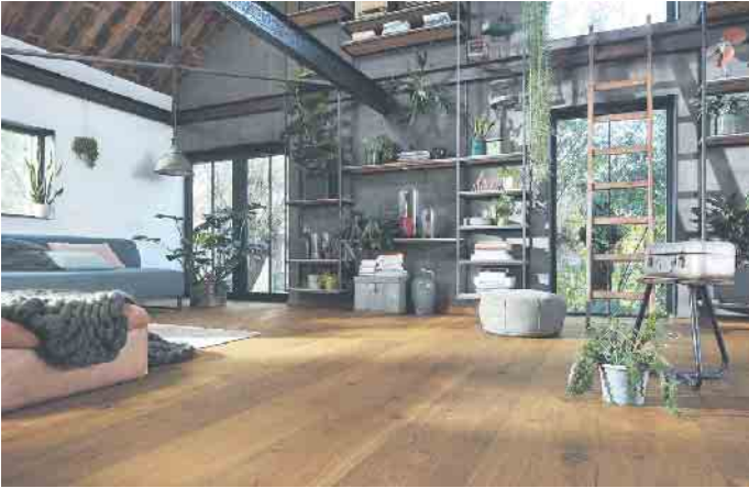
Parkett ist ein Hingucker und echter Umweltschützer.

Parkett - der elegante Klimaschützer für die eigenen vier Wände