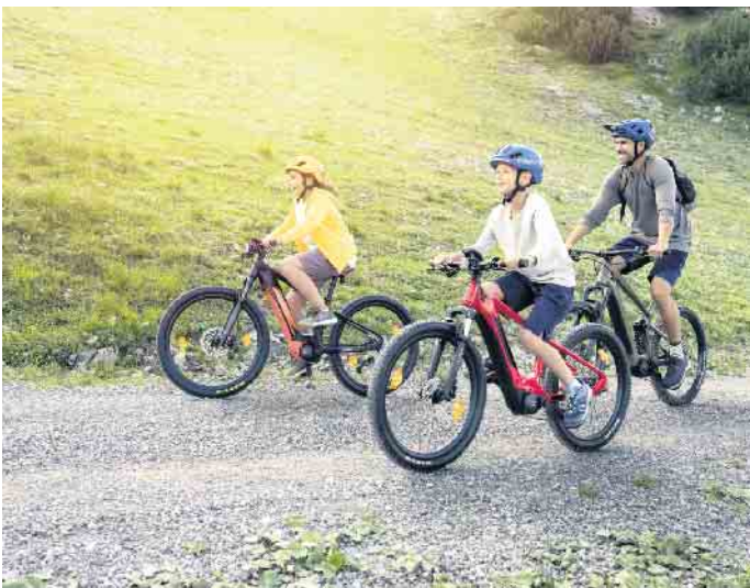
Reisen mit dem Rad: Das ist nachhaltig, abwechslungsreich und ein Spaß für die ganze Familie. Die elektrische Unterstützung eines E-Bikes erhöht dabei die Reichweite deutlich.

besonders nachhaltig. Wer seinen Aktionsradius erweitern möchte, kann die Muskelkraft durch die elektrische Unterstützung eines E-Bikes verstärken. Gut vorbereitet auf größere Touren gehen Wer einen erholsamen Radurlaub verbringen möchte, sollte sich entsprechend darauf vorbereiten. Ein Check von Bremsen, Reifen, Schaltung, Feder- system, Pedalen, Schuhen und Helm vor dem Start sollte selbstverständlich sein. Bei der Kleidung hat sich das Zwiebel-