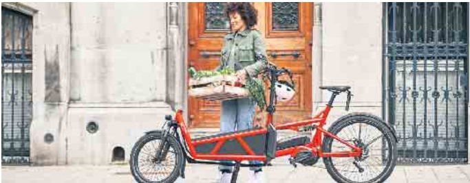
Lastenräder gehören in vielen Städten zum Alltagsbild. Mit elektrischer Unterstützung ermöglichen E-Cargobikes den bequemen Transport zum Beispiel von Wocheneinkäufen.