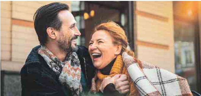
Gesund und zufrieden altern und sich im eigenen Körper wohlfühlen. Schönheit kommt von innen. Antioxidanzien können helfen, straffe Haut und die körperliche Fitness zu erhalten.

Um der Menopause bestmöglich zu begegnen, empfiehlt sich eine Auseinandersetzung mit den einzelnen Phasen. Gesundheitlichen Beschwerden kann mit einer gesunden Lebensweise und ausgewogener Ernährung, idealerweise nikotinfrei und nur mit minimalem Alkoholkonsum, vorgebeugt werden. Ganz besonders Frauen, die Bisphosphonate gegen Osteoporose einnehmen, sollten eine Nahrungsergänzung mit Ubiquinol in Betracht ziehen, denn die körpereigene Produktion des Mikronährstoffs wird durch sie gehemmt. Zudem sinkt der körpereigene Ubiquinolspiegel ab vierzig Jahren. Zeit also, sich zu informieren, zum Beispiel in der Apotheke. (akz-o)