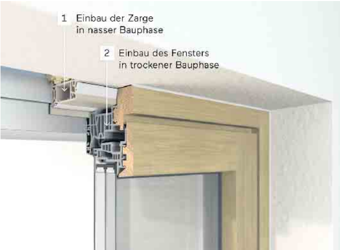
Ein zweistufigeristereineinbau mit Einbaurahmen bietet viele Vorteile.

Einbaurahmen, auch Zargen genannt, sind ein immer wichtiger werdendes Tool bei der Montage von Fenstern. Die Fenster müssen damit nicht schon im Rohbau eingebaut, sondern können in einer späteren Bauphase montiert werden. Bauherren profitieren nicht nur vom reibungslosen Einbau der hochwertigen Bauteile - langfristig sind zweistufige Montagekonzepte sogar um zehn Prozent kostengünstiger, berichtet der Verband Fenster und Fassade (VFF). Üblicherweise werden Fenster beim Hausbau sehr früh in der sogenannten nassen Rohbauphase montiert. Die Gefahr, dass die neuen Fenster durch andere Gewerke beschädigt werden, ist so aber sehr hoch. Mit Hilfe des zweistufigen Montagekonzeptes werden zunächst nur die Einbaurah-