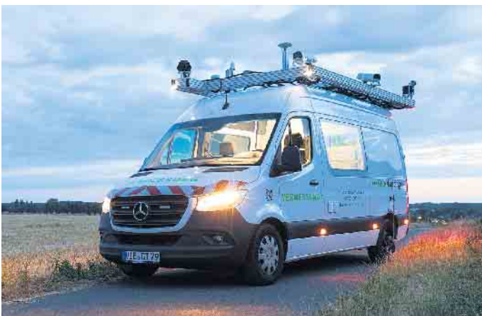
Mit der Erfassung und Bewertung der Straßenzustände im Gemeindegebiet wurde die Firma GDS Geo Daten Service GmbH beauftragt.

Straßenzustände beauftragt. Für die örtliche Erfassung der Straßen haben sich die Stadt und die GDS gemeinsam für den Einsatz modernster Aufnahmetechnik entschieden. Die Grundlage für die Bewertung der Straßenzustände wird mittels einer Bild- und Laserscanaufnahme durch ein mobiles Aufnahmesystem erstellt. Die eigentliche Straßenaufnahme wird mit einem Spezialfahrzeug durchgeführt. Im Rahmen dieser Aufnahmen durchfährt das speziell mit Kameras, Scannern und Positionierungssensoren ausgestattete Fahrzeug die Straßenzüge und erfasst die Fahrbahnen und angrenzenden Bereiche. Die Daten werden dann über spezielle Software ausgewertet, so dass hieraus auch Fahrbahnbreiten, Längen, Flächen und Höhen messbar sind sowie die Straßenzustände erfasst und bewertet werden können. Die aufgenommenen Daten dienen ausschließlich der Verwaltung für interne Verwendungszwecke.