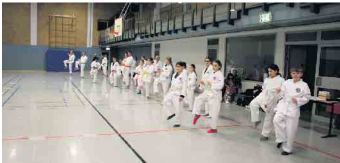
Gemeinsames aufwärmen in der Gruppe

Shotokan Karate-Do in Kall Dienstags in Kall in der Turnhalle der Grundschule Kall, Auelstr 47, 18 bis 19.30 Uhr