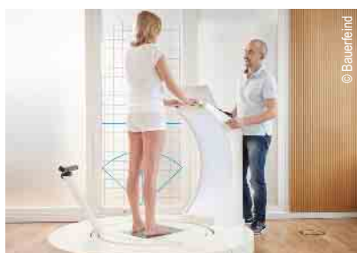
3D-Vermessung für Kompressionsstrümpfe und orthop. Einlagen