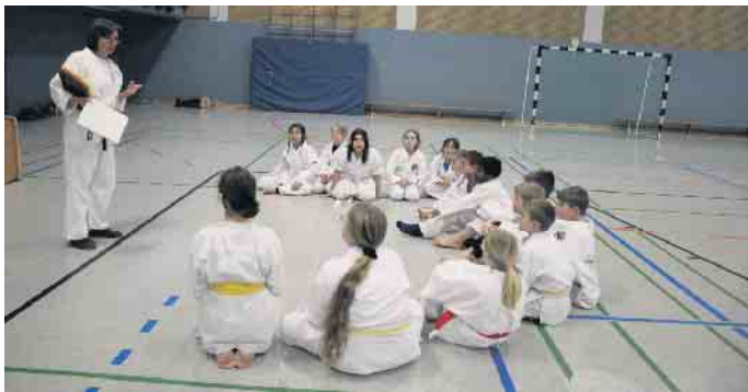
Besprechung eines Themas zur Selbstbehauptung

Infos im Training oder: Koch 0176 57 87 97 07 Erika Krah 0176 57 87 97 06 / Udo (gerne auch über WhatsApp)