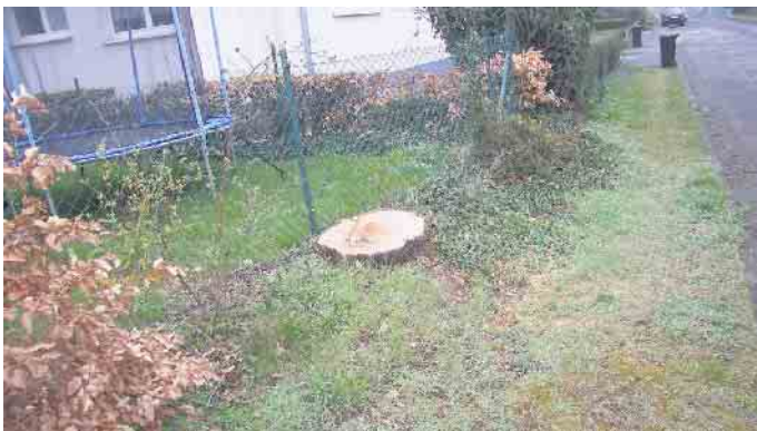
50 jährige Esche gefällt, Verkehrsgefährdung???

Heckenschnitt und Baumfällungen im Frühjahr