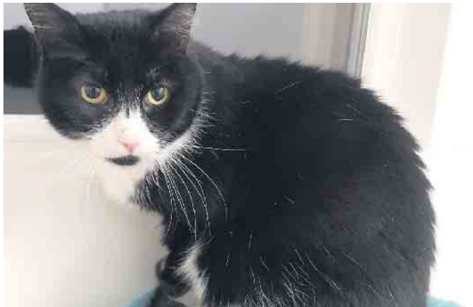
Katze Mietzi sucht ein neues Zuhause.

Katze Mietzi wurde aus beruflichen Gründen im Tierheim Kall abgegeben. Die 2012 geborene Mietzi ist eine eher ruhige und unauffällige Katze und zudem absolut lieb und unkompliziert. Mietzi sucht ein neues Zuhause ohne andere Katzen, aber mit Freigang nach einer Eingewöhnungszeit. Interessenten sind im Tierheim Kall unter der Tel.Nr. 02441/778664 herzlich willkommen.