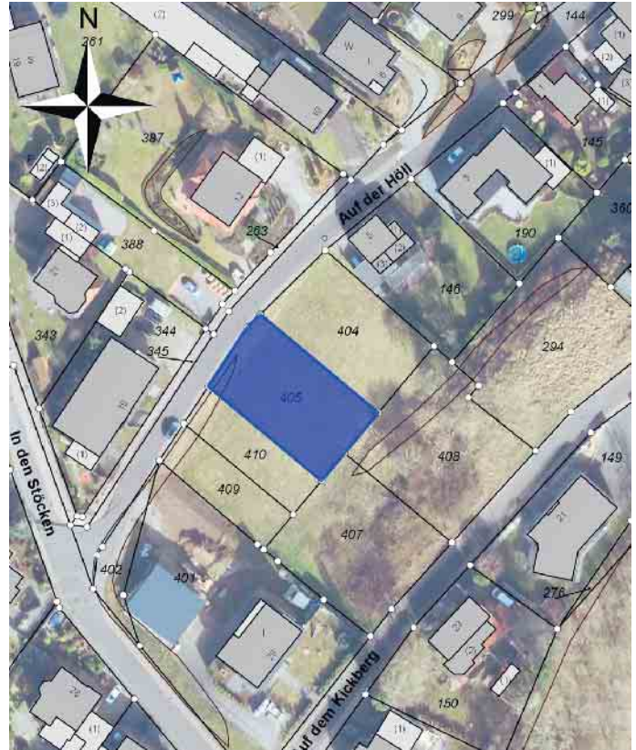
Die Gemeinde Kall verkauft ein Baugrundstück in der Ortslage Sötenich.