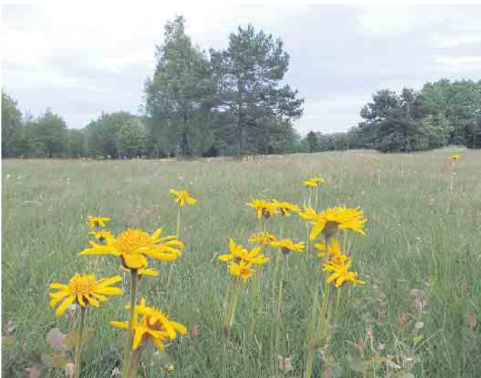
Nach der feierlichen Eröffnung der neuen Schutzhütte gibt es eine geführte Wanderung über die Sistiger „Arnikarunde“.

europäischen Schutzgebietsnetz bedeutsamen Arnika-Borstgrasrasen der Sistig-Krekeler Heide eingerichtet. Der Rundweg ist so konzipiert, dass er auch als eine acht Kilometer lange Eifelsteig-Schleife erwandert werden kann. Er führt durch Sistig, den Kaller Höhenort auf 550-580 Metern über NN, vorbei an der Pfarrkirche St. Stephanus mit ihren überregional bekannten Deckenmalereien des Künstlers Ernst Jansen-Winkeln. Diese waren während des und kurz nach dem 2. Weltkrieg unter schwierigsten Umständen fertiggestellt worden. Weiter geht es über die beiden Heidebereiche der Sistiger und der Krekeler Heide, die für Ihre moorig-nassen Standorte mit zahlreichen seltenen Pflanzengemeinschaften und tausenden Orchideen, Arnika und Lungenenziane bekannt sind. Auf dem „Rückweg“ zum Eifelsteig überwältigt der weite Blick nach Osten über das Kloster Steinfeld bis hin zum Kölner Dom im Rheintal und den nördlichsten Ausläufern der zentralen Vulkaneifel (Michelsberg). Der