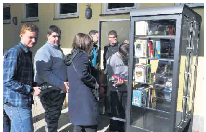
Es dauerte nicht lange, bis die Schülerinnen und Schüler den neuen Schrank mit Leben füllten und eifrig Bücher einstellten.