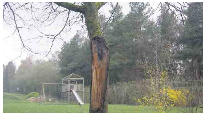
Eiche mit vom Sturm abgerissenen Schlitzast, sehr gefährlich.