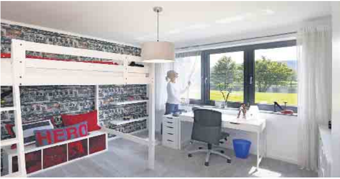
Moderne Fertiggeller sind darauf ausgelegt, dass sie dem Bauherrn hochwertige Wohnfläche und hohen Wohnkomfort bieten.“