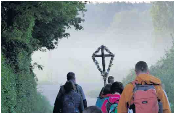
Eine Wallfahrt zum Hermann-Josef-Fest in Steinfeld findet statt am 12. Mai.