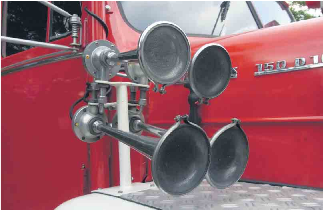
In Deutschland sind kreative Installationen von Schallerzeugern am Privatfahrzeug verboten.

Für das Hup-Konzert im Straßenverkehr gibt es Regeln. Die engen Grenzen der Hup-Erlaubnis haben nicht zu überhörende Gründe: Eine Hupe erreicht in einer Entfernung von sieben Metern 105 Dezibel. Zu viel, denn Lärm beeinträchtigt auf Dauer die Gesundheit nachhaltig: Er schädigt das Gehör und löst körperlichen Stress aus. Die Weltgesundheitsorganisation WHO und das Umweltbundesamt sehen die Zielwerte für die Lärmbekämpfung bei 65 Dezibel tagsüber und bei 55 Dezibel nachts. Grundsätzlich ist Hupen laut Paragraphen 16 der Straßenverkehrsordnung (StVO) innerorts nicht erlaubt, außer es besteht eine berechnigte Gefahrenlage, die einen Unfall nach sich ziehen könnte. Dies gilt auch außerorts - mit einer weiteren Ausnahme: Der nachfolgende Verkehrsteilnehmende möchte überholen und zeigt dies durch ein Hupsignal an. Die verschlafene Grünphase hingegen zählt als Verkehrsverzögerung und rechtfertigt keine Betätigung der Hupe. Wer nun zur Lichthupe greift, verhält sich ebenfalls ordnungswidrig. Stattdessen könnte versucht werden, mit Hilfe von Winken auf die grüne Ampel hinzuweisen. Wer unerlaubt ein Schallzeichen abgibt, muss mit einem Bußgeld in Höhe von fünf Euro rechnen, werden zusätzlich andere dadurch belastigt, sind zehn Euro fällig. Fühlt sich jemand durch das Hupen genötigt, kann der oder die Belästigte eine Anzeige stellen. Wer zu oft wegen unsachgemäßen Hupens ein Bußgeld kassiert, kann