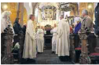
Am 11. und 12. Mai strahlt Steinfeld im Glanz des alljährlichen Hermann-Josef-Festes.

Traktor-Oldtimer-Segnung nachmittags um 16 Uhr. Hierzu sind alle Liebhaber eingeladen, wegen des Platzangebotes ist eine vorherige Anmeldung notwendig (Anmeldung an: info@stiftung-kloster-steinfeld.de ). Hermann-Josef-Pilger-Dienstage mit Frühstück Für Pilger laufen die Feierlichkeiten zum Fest des hl. Hermann-Josef bereits seit dem 12. März, mit einer Messe jeden Dienstagmorgen jeweils um 9 Uhr, bis zum Höhepunkt des Hermann-Josef-Festes am 11. Mai als wichtiges Pilgerziel. Im Anschluss an die Messe werden die Pilger zu einem Frühstück eingeladen. Für die Pilger besteht zwischen 8.15 und 8.45 Uhr die Möglichkeit zur Beichte. „Das Hermann-Josef-Fest gibt den Menschen ein Zeichen der