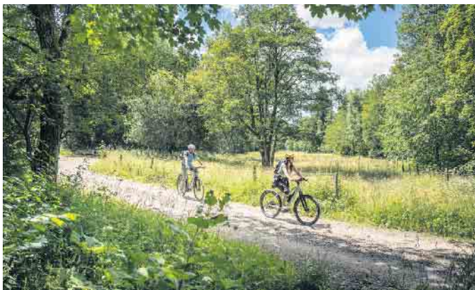
Ein Raderlebnistag auf der EifelRadSchleife „Urft und Olef“ am Sonntag, 28. April 2024 mit Erlebnisstation auch in Kall.

hilfe für unterwegs“ geführte Touren angeboten. Zudem haben im Stadtzentrum von Schleiden von 13 bis 18 Uhr die Geschäfte geöffnet. Parkmöglichkeiten in Schleiden bestehen auf den Parkplätzen Driesch, Poensgenstraße, Burgarten und Schulzentrum. In Kall werden am Sportplatz vom Deutschen Roten Kreuz Snacks und Getränke angeboten. In Hellenthal-Blumenthal können sich Radfahrende auf dem Parkplatz der Firmen Gölz/ Holtec auf eine Hüpfburg für Kinder und eine Vorstellung der Eifel e-bikes freuen. In Nettersheim haben das Naturzentrum Eifel mit der Tourist-Information und das Haus der Fossilien geöffnet. Gäste können sich auf eine Kinder-Mitmach-Aktion und das „projekt.-bike inklusiv“ freuen, das mit einem Bikerescue-Servicemobil für Service und Reparaturen bereitsteht. Wer an dem Tag fleißig in die Pedale tritt, wird mit etwas Glück belohnt. An den vier Erlebnisstationen in Schleiden, Hellenthal-Blumenthal, Nettersheim und Kall können die Teilnehmenden jeweils einen Aufkleber sammeln. Wer mindestens drei