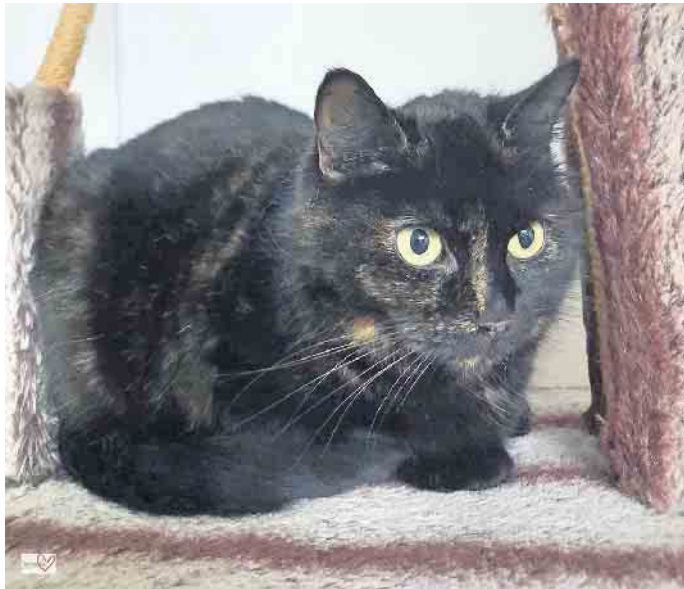
Die zur Zeit noch etwas ängstliche, aber absolut liebe Mucki sucht ein ruhiges Zuhause mit Freigang.

Katze Mucki (geb. Oktober 2016) kam ins Tierheim Kall, weil ihre Besitzerin verstorben ist. Momentan zeigt sie sich im Tierheim noch etwas ängstlich, im Grunde ist sie aber eine absolut liebe Katze. Mucki sucht