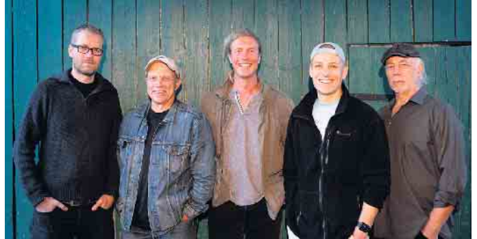
Präsentieren Kölsch-Rock vom Feinsten: Die preisgekrönte Band „Kerk & Bänd“ gastiert am Samstag, 20. April, im Saal Gier in Kall. Foto: Bandfoto