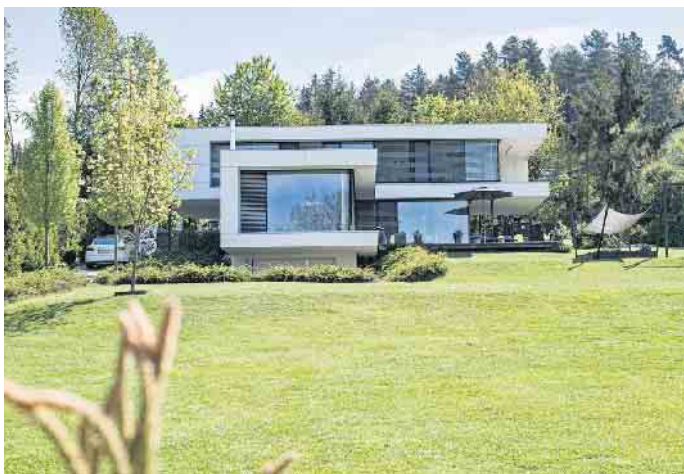
Flaches Dach, kubische Baukörper - das kommt bei vielen Bauherren gut an.

Individualität und Stilsicherheit. „Auch bei anderen Alltagsgegenständen wie Autos, Möbeln oder Smartphones sind funktionale, möglichst schnörkellose Designs beliebt“, so der BDF-Sprecher. Wenn gewünscht hätten Bauherren von Fertighäusern zudem alle Freiheiten, gezielt Akzente zu setzen mit individueller Ausstattung, mit Formen, Farben und Materialien oder mit architektonischen Ergänzungen wie einem Erker, einer Dachterrasse oder einem Carport. Besonders einfach und komfortabel sind Fertighäuser für den Bau-