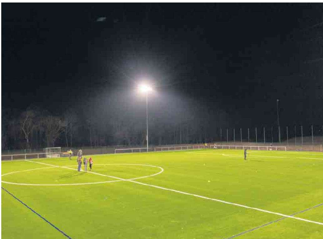
Der Kunstrasenplatz in der Auelstraße Kall ist fertiggestellt.

Ein Interview zum Sachstand der Wiederaufbauprojekte