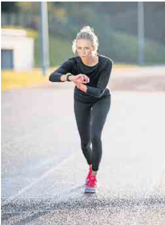
Immer mehr Menschen halten sich mit Sport fit und nutzen dabei auch sogenannte Wearables wie eine Fitnessuhr.

solventinnen und Absolventen, digitale Trainings-, Assistenz- und Datenverarbeitungssysteme speziell für die Sport-, Fitness- und Gesundheitsbranche zu entwickeln. (djd)