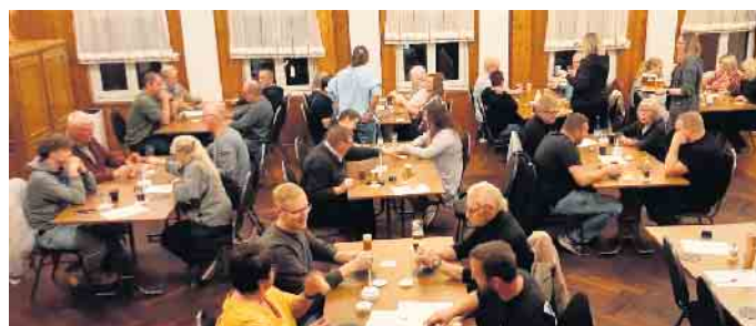
Die zehnte Kaller Schockermeisterschaft um den Großen Preis der VR-Bank Nordeifel und den Wanderpokal „Luisjen-Cup“ startet am Samstag, 18. Mai.