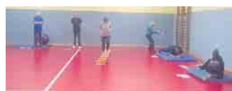
Bewegungsparcours für mehr Gesundheit im Alter