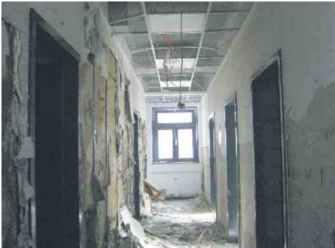
Das Erdgeschoss im Haus der Begegnung wurde bei der Flut völlig zerstört und ist mittlerweile wiederaufgebaut, auch der Betrieb konnte wieder starten.

Haus der Begegnung, das Feuerwehrgerätehaus Kall, die Brücke Weiherbenden, das Hallenbad, das Sportgelände Auelstraße, die Bürgerhalle in Kall sowie die Bürgerhäuser Sötenich und Wahlen.