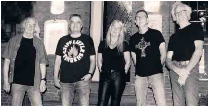
Die Keldenicher Band „Pro terra“ gastiert am Samstag, 25. Mai, mit Folkrock der 80er-Jahre im Saal Gier. Foto: Bandfoto