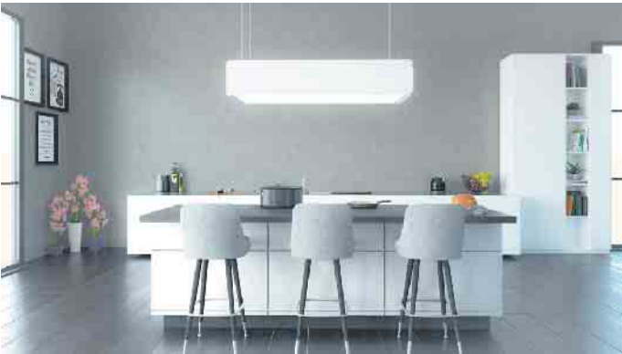
Per Liftfunktion höhenverstellbares, mehrfach ausgezeichnetes und vernetzbares Design-Modell - z. B. für einen komfortablen, automatischen Haubenbetrieb durch Zusammenschalten von Kochfeld und Haube.

sich die vollintegrierten Dunstabzugshauben dann wieder aus. Diese neuen Einbaumodelle können sich in Höhe, Tiefe und Materialstärke flexibel den jeweiligen Abmessungen der Küchenmöbel anpassen. Und der Oberschrank lässt sich trotz flächenbündigem Einbau sogar noch nutzen, da rechts und links vom Kamin Stauraum in Form von Ablagen zur Verfügung steht. Sehr raffiniert: Die Dunstabzugshaube verbirgt sich unsichtbar in einem decken- oder wandhängenden Regalsystem. Es besteht aus Modulen in wählbarer Höhe und Breite. Die Regal-Module lassen sich beliebig erweitern und anhand eines umfangreichen und integrierbaren Zubehörsortiments ganz auf den persönlichen Bedarf abstimmen. Außerdem können sie - wie der Dunstabzug - mit integrierten LED-Leuchtpaneelen ausgestattet werden.