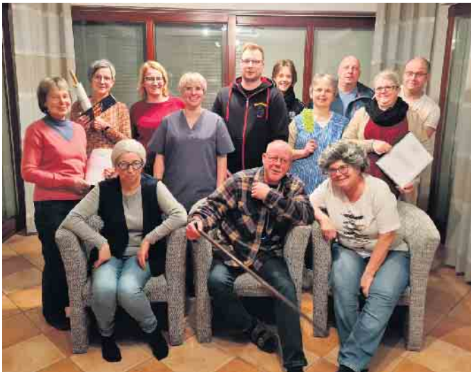
Theaterfreunde „frechunnett“ - Senioren-Roulette - 2024

Theaterfreunde „frechunnett“ Wahlen - Vier Aufführungen in Sistig