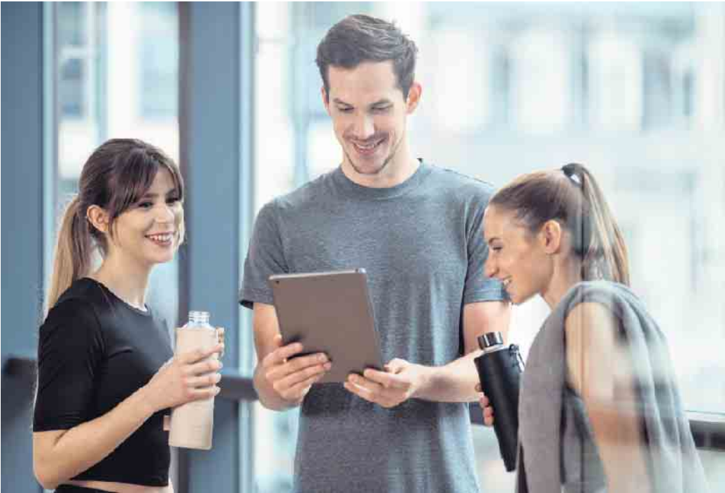
Fitnessstudios leisten einen wichtigen Beitrag zur Gesundheitsversorgung. Auch hier werden dringend Fachkräfte gesucht.

Im Bereich Gesundheit, Fitness und Sport werden dringend Fachkräfte gesucht