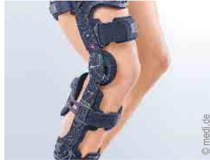
Versorgung des Kniegelenks