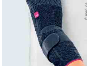
Versorgung von Ellbogen und Schulter

NEU in Mechernich: Mittwochs bis 18 Uhr geöffnet und jeden 1. & 3. Samstag im Monat von 09-13 Uhr!