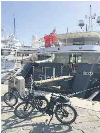
Ein deutliches Plus an bequemer Mobilität vor Ort gewinnt, wer ein kompaktes E-Faltrad am Urlaubsziel nutzen kann.

Auch in den deutschen Großstädten sind E-Falträder die perfekte Lösung für mobile Städter. Im Gegensatz zu Fahrrädern dürfen sie in Bussen und Bahnen überall mitgenommen werden, ein Extraticket ist ebenfalls nicht nötig. Zu Stoßzeiten sind öffentliche Verkehrsmittel ohnehin meist so voll, dass Fahrräder nur mit Mühe transportiert werden können, für das Faltrad findet man immer ein Plätzchen. Das gilt allerdings auch nur dann, wenn das Faltrad qualitativ hochwertig ist und entsprechend schnell und bequem klein gemacht werden kann. (djd)