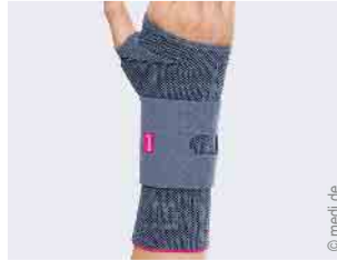
Versorgung der Hand