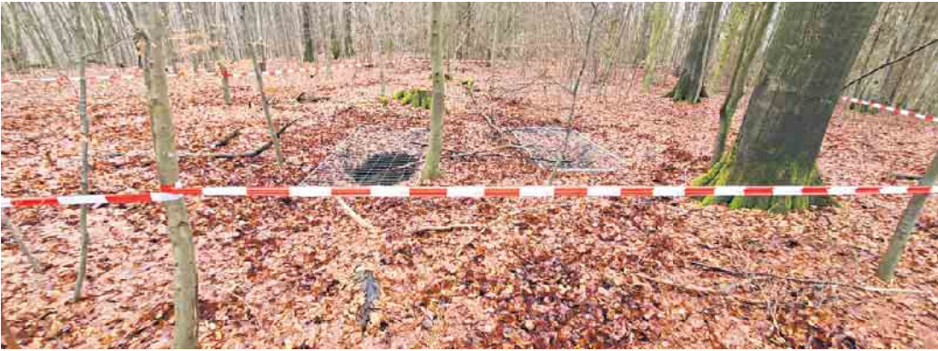
Der Revierförster hatte im Wald zwischen Urft und Wahlen ein tiefes Loch entdeckt und das Ordnungsamt informiert.

Im Kaller Gemeindegebiet wurde früher Bleierz abgebaut - Immer wieder tauchen neue Bergschäden auf - Tiefes Loch im Wald zwischen Urft und Wahlen - Gemeinde und Bezirksregierung veranlassen Sicherung und Verfüllung - Auch „Pingen“ sollten nicht betreten werden