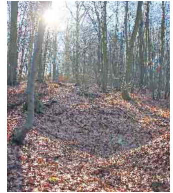
Pingen wie diese sollten nicht betreten werden, da sich darunter Stollen befinden könnten.

Dreßen, dennoch sei große Vorsicht geboten: „Es besteht immer die Gefahr, dass da mal jemand reinfällt, womöglich alleine, und im Loch gibt es keinen Handypfang.“ Vor allem Kinder, so Dreßen, sollten grundsätzlich keine Pingen, also die trichterförmigen Kuhlen im Wald, betreten oder darin spielen. „Es kann immer sein, dass sich darunter Schächte befinden und plötzlich die Erde nachgibt.“ Häufig würden die Pingen für Bombentrichter aus dem Zweiten Weltkrieg gehalten und die Gefahr daher unterschätzt. Dass derartige Bergschäden in Kall Geschichte haben, zeigt auch ein Bericht im Kölner Stadt-Anzeiger vom 20. Januar 2005: „Nur etwa 100 Meter von der Wohnbebauung