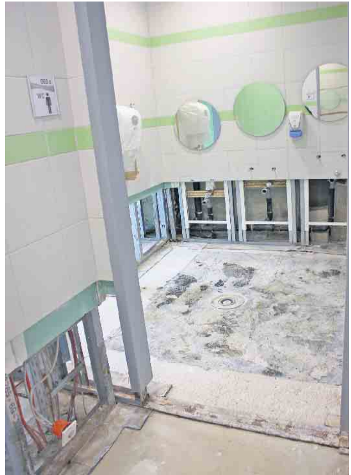
Auch im Sanitärbereich wurden Estrich, Putz und Teile der Trockenbauwände rückgebaut sowie alle Armaturen entfernt.