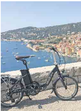
Urlaubsglück mit Ausblick: Auch im Urlaub sorgen die kompakten E-Falträder für viel Bewegungsfreiheit.

Rad umgelenkt werden. Ohne Akku wiegt das Faltrad nur circa 18 Kilogramm, der Lithium-Ionen-Akku sorgt für eine Reichweite von bis zu 180 Kilometern.