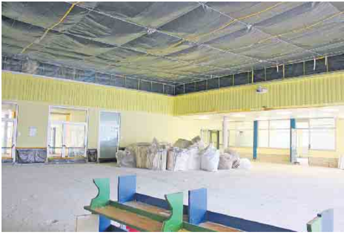
In der Aula wurden die Decke und verbleibendes Inventar sorgfältig mit Folie abgedeckt. So wird auch die erste Etage vor Bauschutz geschützt.

In der großen Aula stehen WC-Schüsseln aufgereiht, Heizungsrohre mit Thermostaten ragen aus dem Boden, wo einmal die Heizkörper installiert waren. Lautsprecher an den Wänden wurden fein säuberlich in Folie verpackt, ebenso ein Beamer. An der Decke wurden Stahlseile gespannt und mit Folien versehen, um den ersten Stock vorm Baustellenstaub zu schützen.