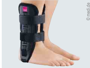
Versorgung des oberen Sprunggelenks