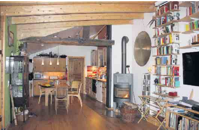
Hell, modern und gemütlich: Küche und Wohnzimmer im kernsanierten Haus.