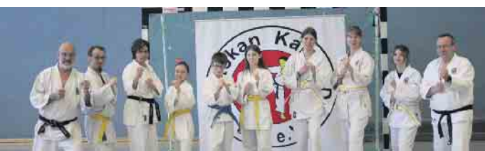
Prüfungspartner, Prüflinge und Prüfer. Alle aus der Jugendlichen- & Erwachsenen-Gruppe.