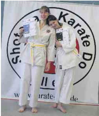
Mutter und Tochter, herzlichen Glückwunsch dazu von allen Mitstreitern!

ke für Jugendliche & Erwachsene ab 13 Jahren. Vielseitiges Training für Ausgleichssport, Fitness und Selbstverteidigung. Entdecke deine wahre Kraft! Am Anfang reichte normale Sportkleidung und etwas zu trinken. Dojo Kall dienstags, ab dem 16. Januar von 18 bis 19.30 Uhr in der Turnhalle der Grundschule Kall, Auelstr. 47 Dojo Scheven freitags, ab dem 19. Januar von 18.30 bis 20 Uhr Im Kindergarten Scheven, Zum Beestental 8 Info und Fragen im Training oder: