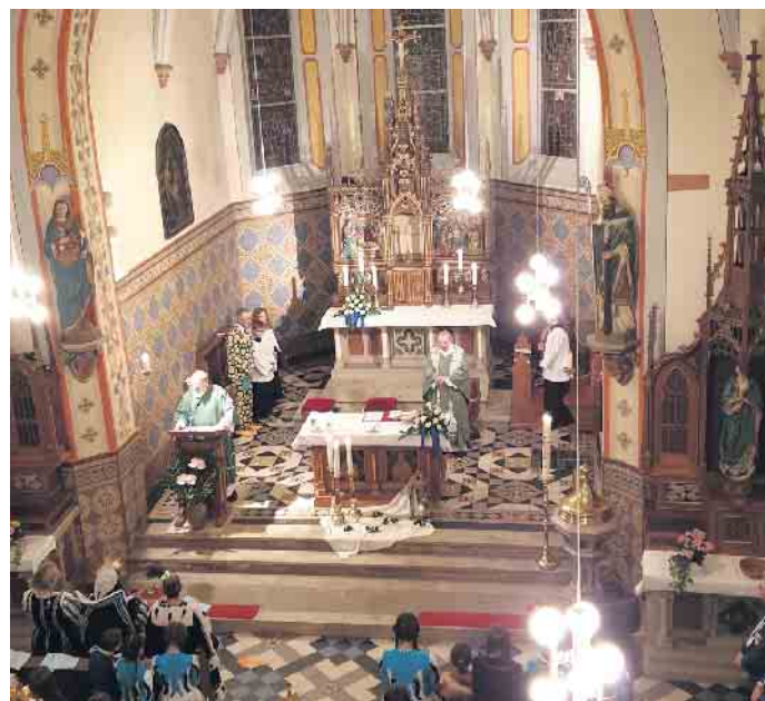
Am Samstag, 13. Januar, findet um 19 Uhr die 31. Mundartmesse in der Kirche St. Apollinaris in Scheven statt.

Interessierte Kirchenbesucher sowie Mitglieder, Freunde und Gönner der Karnevalsgesellschaft sind zu dieser besonderen Messfeier herzlich eingeladen. Im Anschluss an den Gottesdienst findet für alle ein kleiner Umtrunk im Saal „Op de Kier“ statt.