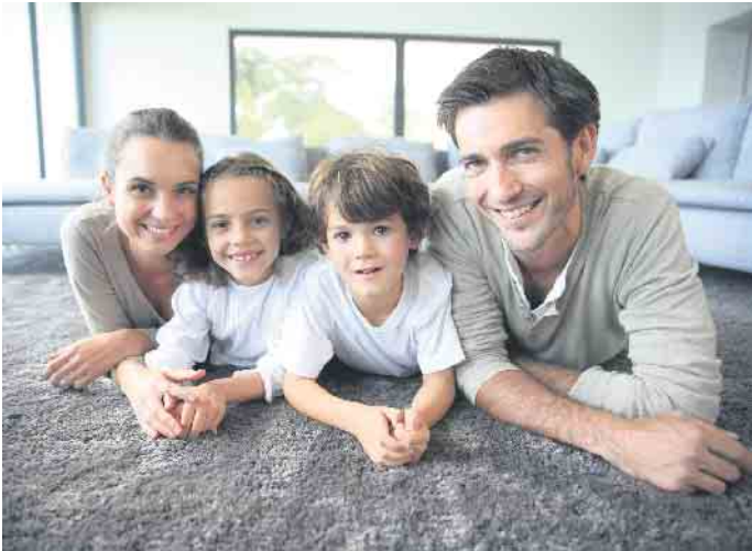
Dank moderner Wohnraumlüftung mit Wärmerückgewinnung fühlt sich die Familie bei gutem Raumklima wohl - und schont zusätzlich ihren Geldbeutel.

wer auf erneuerbare Energien und eine energieeffiziente Haustechnik umsteigt. Lüftungssysteme mit Wärmerückgewinnung beispielsweise regeln automatisch den notwendigen Luftaustausch und wärmen die Frischluft vor. So muss bei kühlen Außentemperaturen deutlich weniger geheizt werden, wodurch sich die Heizkosten geräte- und gebäudeabhängig um etwa 30