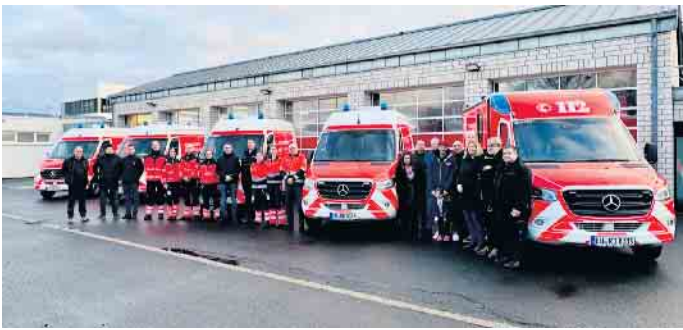
Kurz vor dem Jahreswechsel wurden die neuen Rettungs- und Krankentransportwagen an die Rettungswachen im Kreis Euskirchen übergeben.

zungssysteme wie z.B. Raupen-tragestühle. „Damit können die alltäglichen Belastungen des Rettungsdienstpersonals reduziert und Verletzungen und Erkrankungen vorgebeugt werden“, sagte Abteilungsleiter Martin Fehrmann. Drei Rettungswagen sind mit dem Telenotarzt-System ausgestattet, das bereits seit 2017 fester Bestandteil der Notfallrettung im Kreis Euskirchen ist. Der Telenotarzt kann bei Bedarf durch das Rettungsdienstpersonal online zugeschaltet werden und im Einsatz notfallmedizinische Unterstützung leisten. Alle Fahrzeuge sind mit auto-