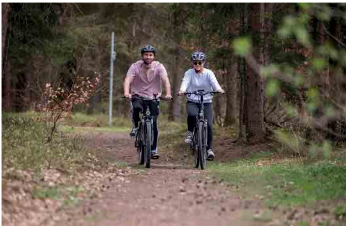
Egal, ob Jung oder Alt: Elektro-Fahrräder liegen voll im Trend.

schätzt werden, kann ein Unfall schnell passieren, dann ist der richtige Versicherungsschutz wichtig. Welche Variante die richtige ist, hängt von der Geschwindigkeit des jeweiligen Modells ab. Bei einem Großteil der Pedelecs handelt es sich um Räder mit einer elektrischen Tretunterstützung, die sich ab 25 km/h abschaltet. Diese Pedelecs sind den Fahrrädern gleichgestellt. Sie lassen sich ohne Zulassung, Führerschein und Versicherungskennzeichen fahren. Das Unfallrisiko ist oft in einer bestehenden Privathaftpflicht-Versicherung kostenlos miteingeschlossen. Ein Blick in die Bedingungen oder ein Gespräch mit dem Versicherer klärt, ob die kostenfreie Mitversicherung wirklich besteht. Andere Spielregeln gelten für Fahrer der schnellen S-Pedelecs, deren Motorunterstützung erst bei 45 Kilometern pro Stunde endet. Wer sich auf den Sattel eines S-Pedelecs setzt, muss mindestens 16 Jahre alt sein, einen Führerschein der Klasse AM und eine Kfz-Haftpflichtversicherung besitzen, das dafür notwendige Versicherungskennzeichen gibt es direkt bei der Kfz-Versicherung. Um gegen Diebstahl eines S-Pedelecs versichert zu sein, brauchen die Fahrer neben der Kfz-Haftpflichtversicherung noch eine Teilkasko-Versicherung. Doch auch für Fahrer der langsameren Varianten ist Diebstahlschutz ein Thema: Verschwinden solche Pedelecs nach einem Einbruch in den