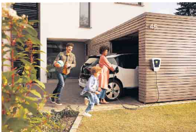
Ob zu Hause oder unterwegs: Das Laden des E-Autos sollte mittlerweile kein Problem mehr sein.