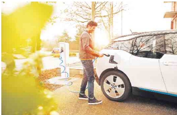
Die Ladeinfrastruktur für E-Autos ist in Deutschland und dem gesamten mitteleuropäischen Raum inzwischen gut bis hervorragend ausgebaut.

Die Ladeinfrastruktur in Mitteleuropa wird in den kommenden Jahren weiter ausgebaut. Vor allem in den Niederlanden, in Skandinavien, Deutschland,