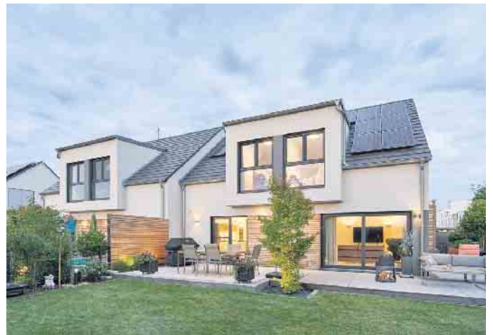
Doppelhaus in Fertigbauweise - das geht achsensymmetrisch oder auch grundverschieden.

all seinen Vorzügen: Denn die Bau- und Grundstückskosten sind durch zwei geteilt günstiger und der Energiebedarf ist im Doppelhaus fast immer niedriger als bei zwei alleinstehenden Häusern.“ Die Hersteller von Holz-Fertig-häusern registrieren ein reges Interesse an Doppelhäusern und haben sich mit attraktiven Grundriss- und Architekturkonzepten darauf eingestellt. „Sie zeigen Baufamilien Eigenheime, die sich trotz hoher Grundstückspreise und steigender Bauzinsen bezahlbar und individuell umsetzen lassen und obendrein besonders energieeffizient und zukunftssicher sind“, so Hannott.