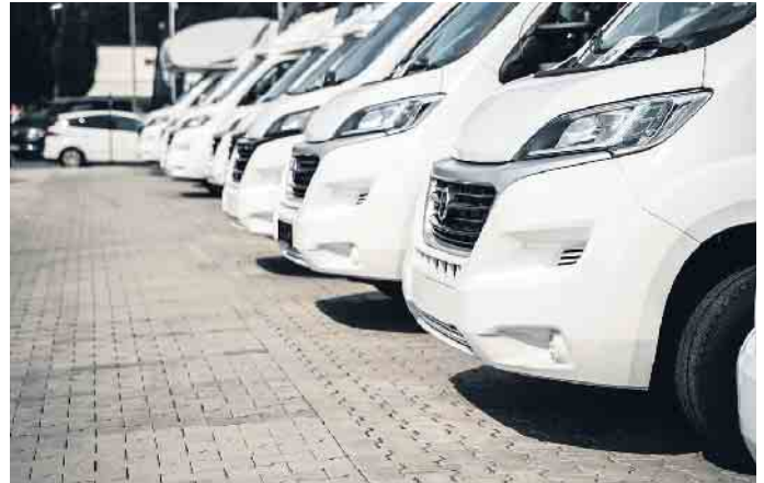
Wohnwagen sind aktuell sehr beliebt.

Unabhängig vom Fahrzeugtyp sollten Mietinteressenten genug Zeit für ihren Urlaub einplanen. Denn unter einer Woche vermieten die wenigsten Händler ihre Fahrzeuge. Das hat aber einen guten Grund, über den sich Kunden freuen können: In den vergangenen zwei Jahren sind die Hygienestandards nochmal gestiegen.