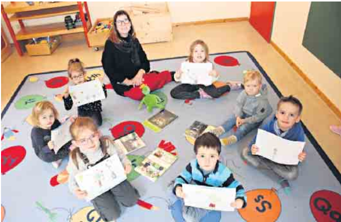
Schon viel erlebt haben die „Jolepicher Pänz“ in der Natur - das halten sie auch künstlerisch fest.

berichtet von Tieren, die sie dort bereits gesehen haben: „Hirsche, Rehe und auch schon mal ein Häschen.“ Beeindruckt waren sie auch von Fuchsspuren, die sie gefunden haben. „Am schönsten finde ich, was für tolle Ideen die Kinder selbst haben, wenn sie in der Natur sind“, berichtet Sandra Esser. So waren es die kleinen Naturforscher selbst, die beschlossen, im Wald aus Ästen und Blättern ein Tipi und aus Holzstämmen einen „Baumkreis“ zu bauen, auf dem sie sitzen und picknicken können. Und nach dem Picknick? „Den Müll muss man einsammeln und darf ihn nicht auf den Boden werfen“, weiß der fünfjährige Louis aus Golbach und ergänzt: „Wenn Menschen Plastik wegwerfen und die Vögel das dann fressen, werden sie krank und müssen ins Krankenhaus.“ Louis ist einer der kleinen Natur- und Umweltexperten in der Golbacher Kita „Jolepicher Pänz“. Sein Kindergarten war Vorreiter in Sachen „Nationalpark-Kita“ und