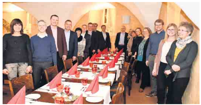
Mitarbeiter der VR-Bank Nordeifel mit „runden“ Dienstjubiläen wurden im Restaurant des Schleidener Schlosses geehrt.

„Bei der Hausbank der Region stehen die Menschen im Mittelpunkt, Mitglieder und Mitar-