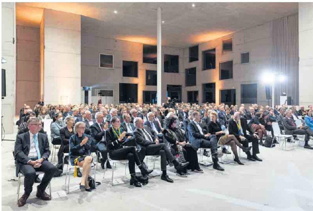
Hochrangige Gäste aus Wissenschaft und Politik waren zur Verleihung des Promotionsrechts an das Promotionskolleg NRW nach Essen gekommen.

FH AACHEN UNIVERSITY OF APPLIED SCIENCES