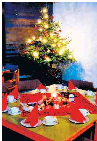
Bildunterschrift: Festlich gedeckter Tisch beim Heiligabend für Alleinstehende 2019.

Auch in diesem Jahr sah es kurz danach aus, als müsse das Fest abgesagt werden, doch eine neue Kooperation zwischen der Evangelischen Kirchengemeinde Jülich, der Pfarrei Heilig Geist