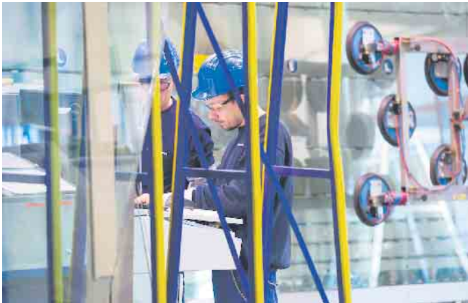
In der Flachglasbranche gibt es spannende Ausbildungsmöglichkeiten.

Im letzten Jahr gab es wegen der Pandemie zehn Prozent weniger Ausbildungsverträge. Viele Betriebe suchen händeringend nach Nachwuchs. Der Bundesverband Flachglas (BF) stellt vier hochinteressante Perspektiven in der traditionsbewussten und gleichzeitig modernen Flachglasbranche vor.