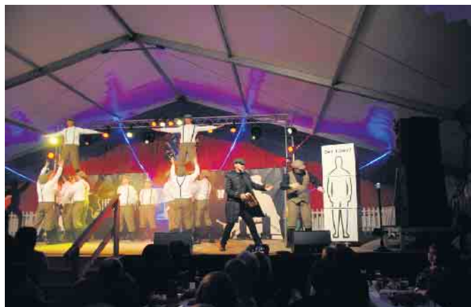
Die Titelverteidiger sind auch dabei am 28. Januar 2023 im Güstener Festzelt