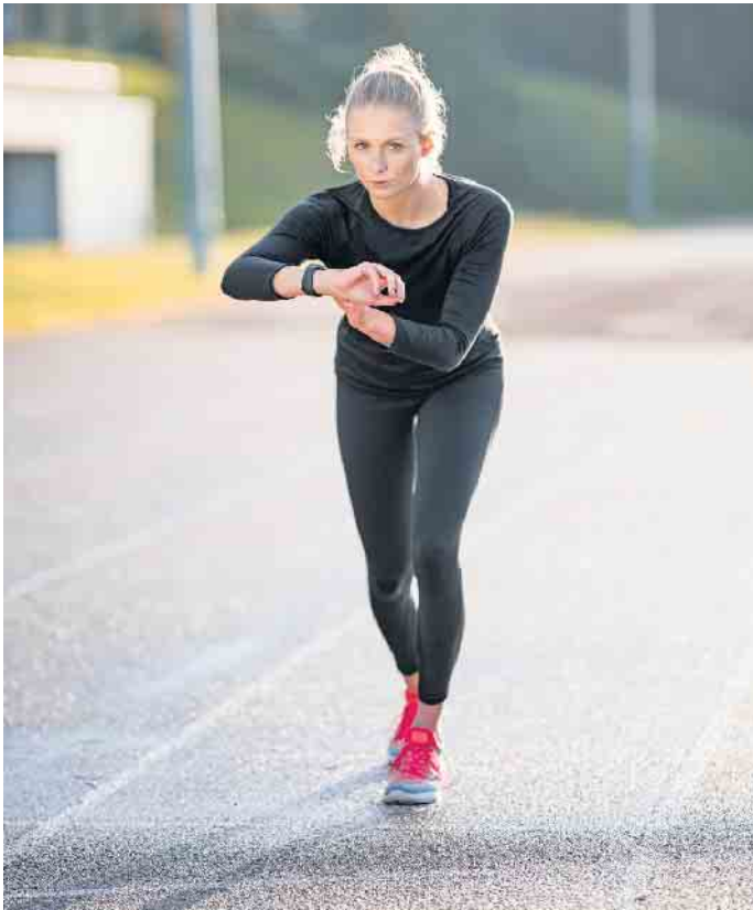
Immer mehr Menschen halten sich mit Sport fit und nutzen dabei auch sogenannte Wearables wie eine Fitnessuhr.

Sport, Fitness und Gesundheit werden bereits von vielen Krankenkassen erstattet. Der interdisziplinäre Studiengang Bachelor-of-Science Sport-/Gesundheitsinformatik etwa qualifiziert die Absolventinnen und Absolventen, digitale Trainings-, Assistenz- und Datenverarbeitungssysteme speziell für die Sport-, Fitness- und Gesundheitsbranche zu entwickeln. (djd)