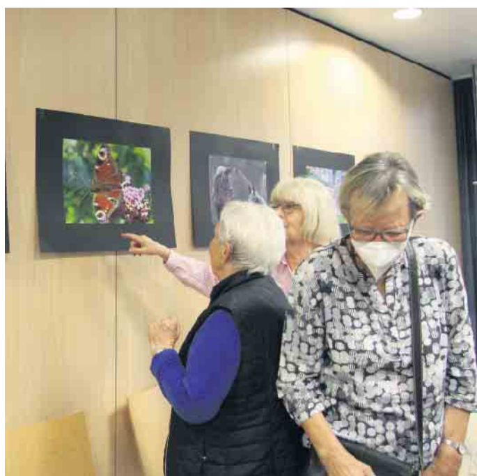
Besucherinnen erfreuen sich an der Fotoausstellung der Fotofreunde.

nen zu den jeweiligen Angeboten zu erhalten. Auch eine Fotoausstellung mit Bildern der „Fotofreunde“ aus Wettbewerben gab es zu sehen. Sehr beliebt war auch das Buffet aus kleinen Häppchen, welches von den Mitgliedern des „Digitalen Kochbuchs“ hergerichtet wurde. Die Mitglieder von „Senioren ins Netz“ sowie auch die zahlreichen interessierten Besucherinnen und Besucher blickten auf einen erfolgreichen Abend zurück. Wenn auch Sie Interesse an den Angeboten des Projekts „Senioren ins Netz“ haben, dann wenden Sie sich gerne an den Fachbereich für Quartiersmanagement und Mehrgenerationen der Stadt Jülich unter 02461/63211 oder per E-Mail: SHaxha@juelich.de . Auch online unter www.juelich.de/seniorensnetz sind Informationen zum Projekt zu finden.