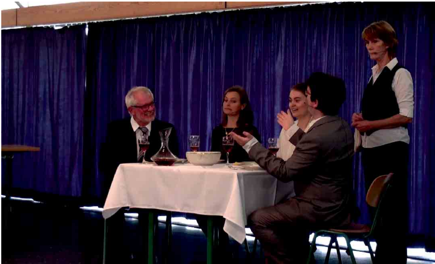
Die „Bühne 80“ begeistert am Seniorentag mit Lorient-Sketchen.

Mit Lorient und Musik in die Herzen der Bürger