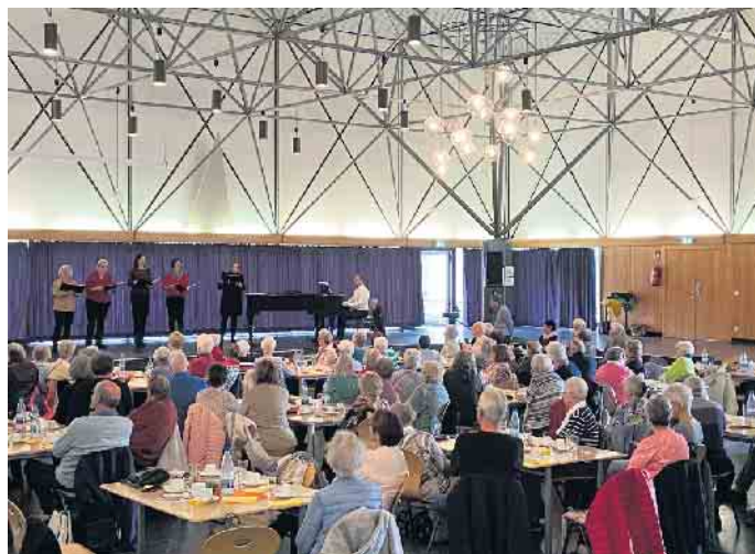
Der „Tonalita-Chor“ verwöhnt das Publikum mit engelsgleichen Tönen.

geführt wurden und einer weiteren musikalischen Darbietung der Bläsergruppe unter der Leitung von Klaus Luft von der Musikschule, schloss der Seniorentag mit vollem Erfolg. Und was darf nicht fehlen? Für das leibliche Wohl wurde bestens bei Mittagessen und einer Kaffeetafel gesorgt. So konnten die Anwesenden am Ende auf einen Tag zurückblicken, der in Erinnerung bleibt und zur Wiederholung aufruft. Informationen zu den Aktionen des Seniorenbeirates der Stadt Jülich erhalten Sie im Fachbereich für Quartiersmanagement und Mehrgenerationen unter 02461/63211 oder per E-Mail: SHaxha@juelich.de.