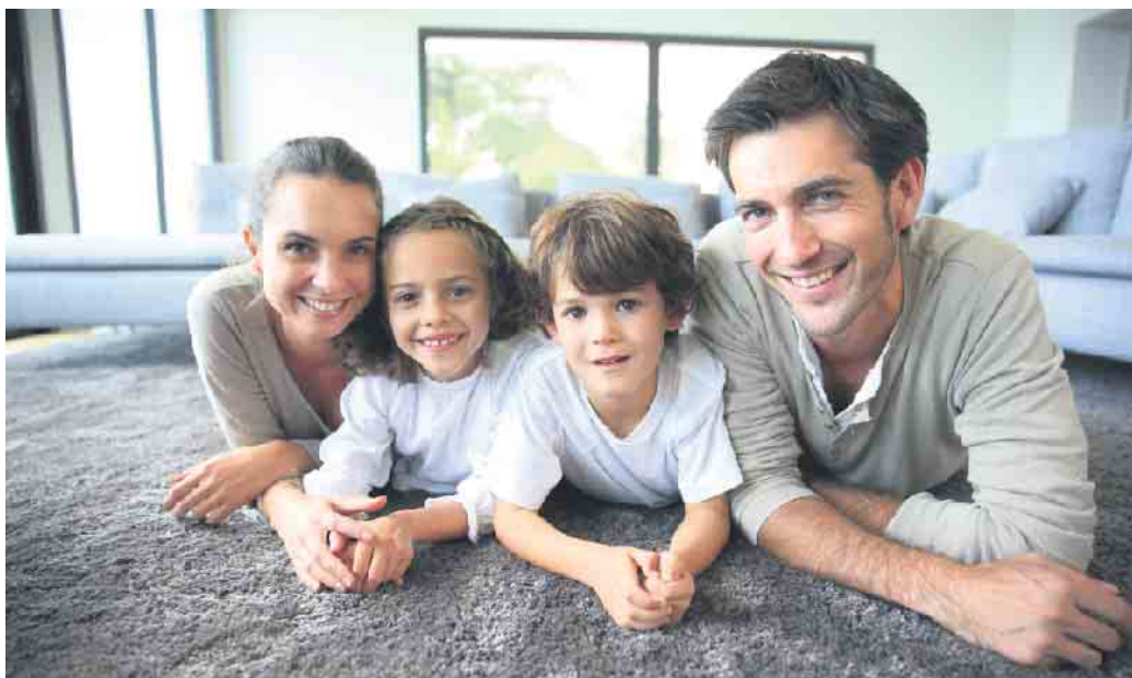
Dank moderner Wohnraumlüftung mit Wärmerückgewinnung fühlt sich die Familie bei gutem Raumklima wohl - und schont zusätzlich ihren Geldbeutel.

Auf diese Weise können Lüftungssysteme bis zu 90 Prozent der Wärme aus der Abluft zurückgewinnen. Es muss deutlich weniger geheizt werden, gleichzeitig wird der Wärme komfort erhöht.