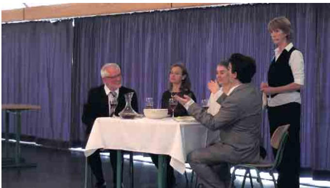
Der „Tonalita-Chor“ verwöhnt das Publikum mit engelsgleichen Tönen.

der Stadt Jülich erhalten Sie bei der Stadt Jülich im Fachbereich für Quartiersmanagement und Mehrgenerationen unter 02461/63211 oder per E-Mail: SHaxha@juelich.de.