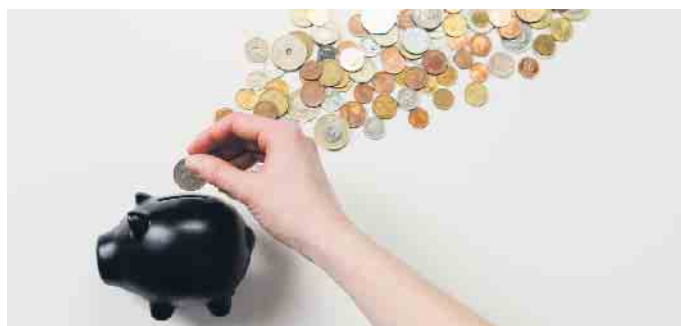
Mit energieeffizienter Haustechnik wie einer modernen Wohnraumlüftung mit Wärmerückgewinnung lassen sich wertvolle Heizkosten einsparen.

Gerade in Neubauten oder bei der energetischen Sanierung, wenn die Gebäudehülle fast luftdicht ist, spielt die Lüftungstechnik ihre Vorteile aus. (djd)