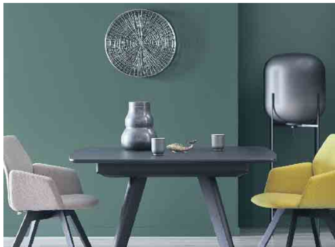
Der Dschungel in den eigenen vier Wänden: Der Name dieser Trendfarbe für die Wand ist hier Programm.

Erst Abwechslung macht das Leben bunt und fröhlich. Das gilt auch und gerade für die eigenen vier Wände. Schließlich spiegelt die Einrichtung die eigene Persönlichkeit wider, vom Design und Stil bis hin zu den verwendeten Farben. Weiße Wände zum Beispiel sind zwar praktisch, aber auf Dauer auch etwas monoton. Für Farbtupfer sorgen heute gezielte Akzente an einer oder mehreren Wandflächen, ob in natürlichen Grüntönen, einem behaglichem Blau oder warmen Naturfarben. Besonders praktisch dabei: Eine neue Wandfarbe verändert das Zuhause so schnell und einfach wie kaum eine andere Modernisierung.