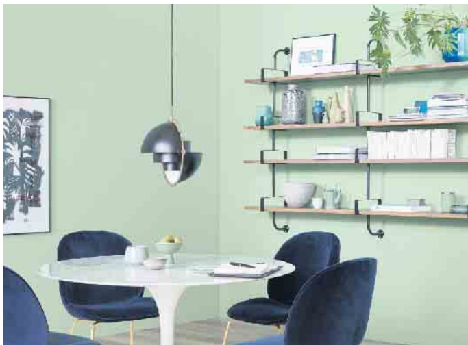
Mehr Mut zur Farbe: Das kreative Kombinieren von Wandfarben, Bödenbelägen und Möbeln verleiht dem eigenen Zuhause mehr Ambiente.

Mit Kreativität erhält das Zuhause einen individuellen Look