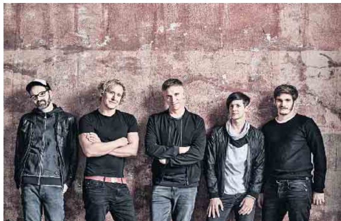
Die fünf Jungs von Kasalla sorgen bei der Großen Kostümsitzung für Kölsche Töne.

Wer diese und weitere Programmpunkte nicht verpassen möchte, kann ab sofort Karten zum Vorverkaufspreis von 33 Euro (bis 21 Jahre 15 Euro, AK 35 bzw. 17 Euro) vorbestellen: online auf www.kg-schnapskännchen.de oder telefonisch unter 02463/1499 . Wie auch in den letzten Jahren gibt es einen besonderen Gruppenrabatt „11 für 10“.