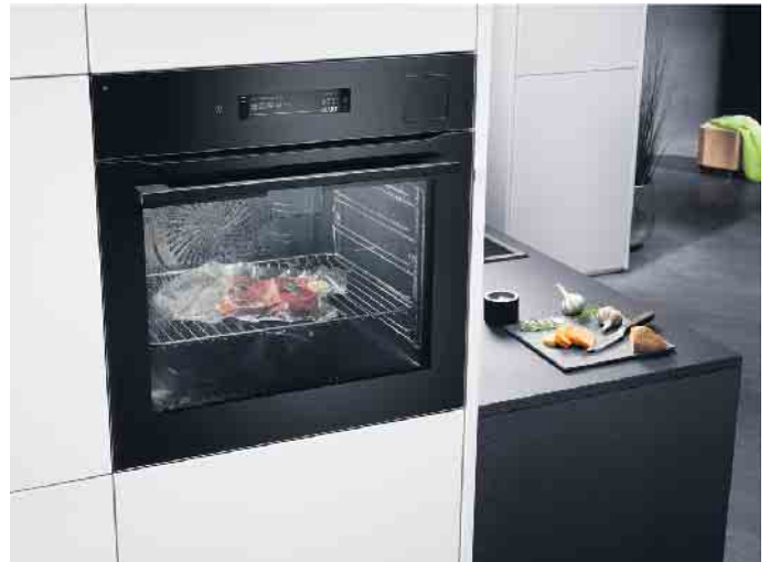
Sehr energieeffizient (A++) und zudem WLAN-fähig. Dieser Dampfbackofen - u. a. mit Kochassistent, Kerntempersensor und Sous-Vide-Funktion - ist mit einer integrierten Videokamera im Türgriff ausgestattet.

mehr, warum die Kompetenz von Küchenfachgeschäften, Küchenstudios und Möbelhändlern mit Küchenfachabteilungen so sehr gefragt ist“, so das Resümee von AMK-Geschäftsführer Volker Irle, wenn es um die Planung hybrider Wohn- und Arbeitswelten geht, in denen beide optimal und intelligent aufeinander abgestimmt sind. Ein gelungenes Beispiel hierfür sind all jene Komfort-Features und vielen Möglichkeiten, die eine zeitgemäße Wohnküche mit, aber auch ohne integrierten Homeoffice-Platz bietet: z. B. ein nachhaltiges und gesundes Lebensmittelmanagement im Kühlschrank - per App jederzeit und von jedem Ort aus überschaubar und steuerbar. Integrierte Kameras im Gerät machen es möglich, auch aus der Ferne den Überblick zu bewahren oder zu überprüfen, was an Lebensmitteln vorhanden ist und was auf dem Heimweg bei einem Zwischenstopp in Geschäften noch aufzustocken ist. Zuhause eingetroffen, kommt alles in die richtigen Frischelagerzonen und Spezialschubladen für Empfindliches wie Obst, Gemüse, Salate & Kräuter, Meeresfrüchte, Fisch-, Fleisch- und Milchprodukte. Ist man nicht ganz sicher, was wo am besten gelagert wird, einfach die App oder den Smart Speaker fragen. Das gleiche gilt bei der Suche nach einem neuen, leckeren Rezept. Nach der Auswahl werden auf Wunsch alle relevanten Voreinstellungen wie Betriebsart, Tempera-