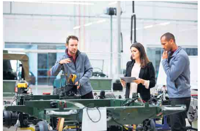
Vorbeugung ist der beste Schutz: Regelmäßige Mitarbeiterschulungen tragen zu mehr Arbeitssicherheit bei.

weit. Zwar sind Arbeitsunfälle stark rückläufig, laut Zahlen von Statista von knapp 1,4 Millionen Fällen im Jahr 2000 auf gut 760.000 Unfälle in 2020. Doch das Hantieren mit Maschinen und Werkzeugen birgt je-