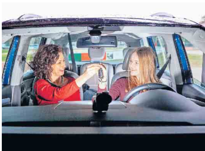
Beim BF17 sammeln Fahrenanfängerinnen und -anfänger begleitet und unterstützt hilfreiche Erfahrungen im Straßenverkehr.

der Familie geplant, kann eine frühzeitige Nachfrage bei der eigenen Kfz-Versicherung sinnvoll sein. (djd)