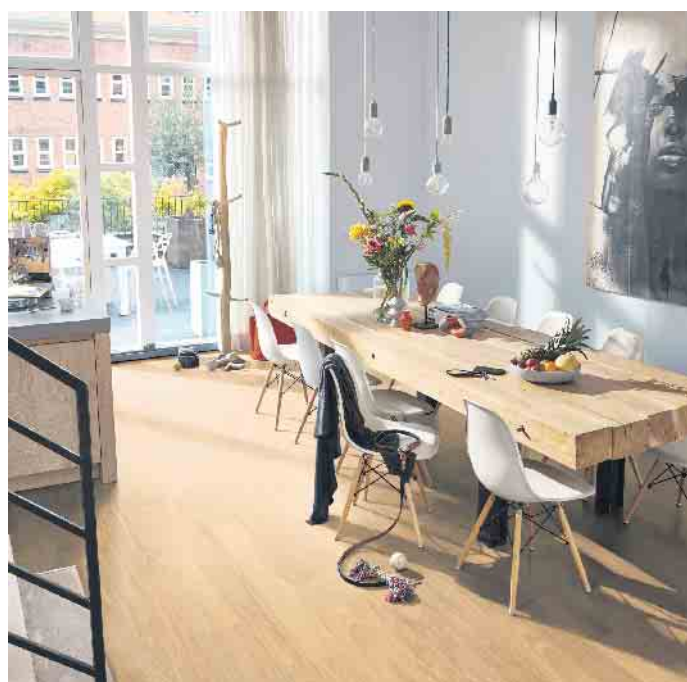
Formschön, nachhaltig und gesund - für Parkett spricht vieles.

Gesund, langlebig, nachhaltig – die Vorteile von Holzfußböden machen deutlich, wie sehr es sich lohnt, auch im Jahr 2022 auf das Naturprodukt zu setzen. „Entscheidet man sich für einen Parkettboden, sind einem nicht nur die vielen ästhetischen Vorteile von echtem Holz sicher“, betont Schmid abschließend. „Mit der Wahl für Parkett tut man sowohl etwas für sein persönliches Wohlbefinden als auch nachhaltig etwas für die Umwelt. Was könnte noch moderner sein?“ (vdp/fs)