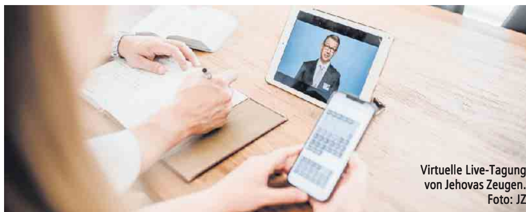
Virtuelle Live-Tagung von Jehovas Zeugen.

Der Wunsch nach Frieden ist aktueller denn je. Passend dazu steht die Kongressserie 2022/23 von Jehovas Zeugen unter dem Motto Frieden. Anhand der Bibel wird gezeigt, was echter Frieden bedeutet und wie man ihn fördern kann. Jehovas Zeugen in Jülich laden ein, die digitale Tagung am 25. September ab 9.40 Uhr live zu verfolgen. Infos auf jw.org und der kostenlose Zugang zur Tagung unter: 02403/32611