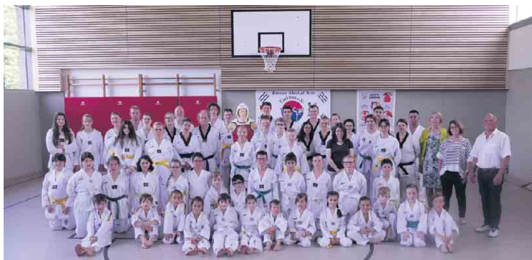
Neues Trainingsgerät für den Verein Text: Christina Dohmen

Jehovas Zeugen aus Julich laden am Sonntag, 28. August, um 10.30 Uhr zu einem biblischen Vortrag mit dem Thema „Sichtbare Belege für die Existenz Gottes“ ein. Jeder ist willkommen, den Gottesdienst in der Kapuzinerstr. 35 in Aldenhoven entweder in Präsenz oder per Videokonferenz zu besuchen. Der Eintritt ist frei. Es finden keine Kollekte oder Spendenaufrufe statt. Infos auf www.jw.org oder unter 02403 32611.