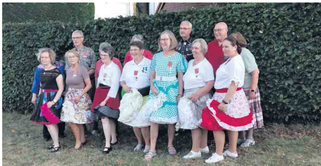
Gruppenfoto Lucky Dukes e.V. Jülich

Wir freuen uns Sie begrüßen zu dürfen. Ihre Lucky Dukes e.V. DER Jülicher Square Dance Club Sie finden uns unter www:https://lucky-dukes.de