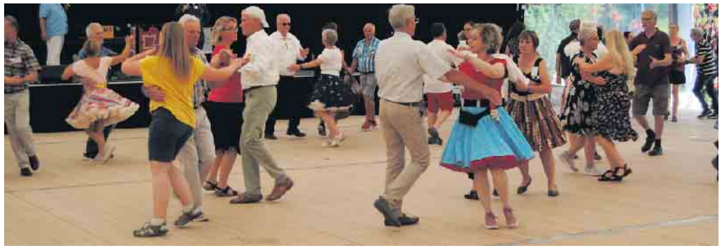
11. Lucky Summer Dance im Brückenkopf-Parks Jülich