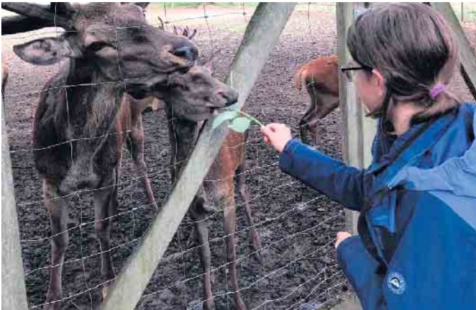
Die Rehe freuen sich über die Leckerbissen.