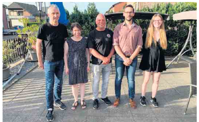
Der Vorstand 2022

der Kinder gefreut, die zum ersten Mal eine Prüfung abgelegt haben. Im Juni waren dann Vertreter des Lions Club Jülich bei der Prüfung zugegen. Der Anlass hierfür war eine Spende des Clubs, von der neues Trai-