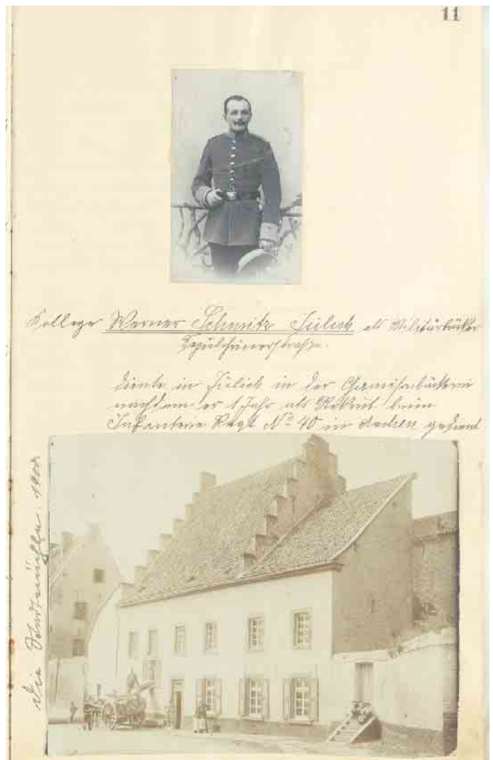
Eine Urkunde im digitalen Lesesaal (Stadtarchiv Jülich)

Die maschinengeschriebenen Texte wurden mit automatischer Texterkennung gescannt und können durchsucht werden. Im Rahmen des Programmes WissensWandel