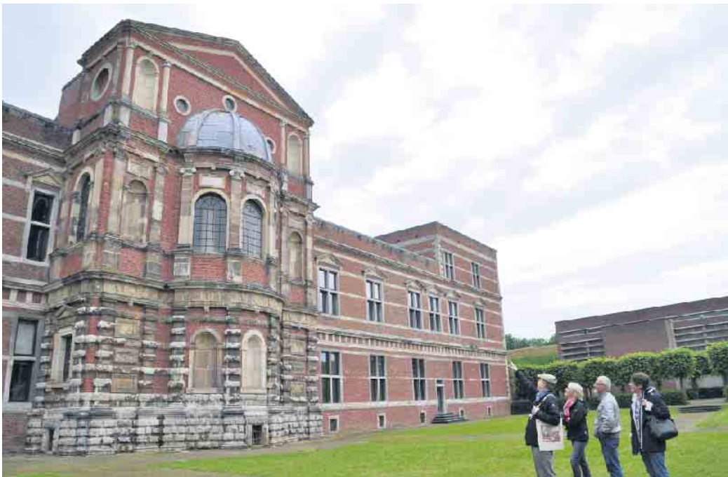
Zitadelle Jülich.

Architektonisches Schmuckstück der Anlage ist die restaurierte Ostfassade des herzoglichen Schlosses. Die zentrale Schloss-