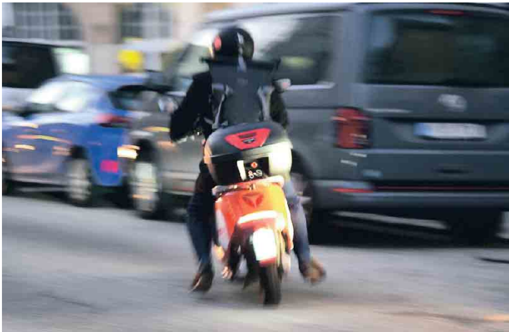
Kurvenfahren sollte man auf den Roller schon können.

Erfahrung braucht es auch fürs Lesen der Straße. „Selbst kleinste glatte Stellen führen schnell zum Sturz“, sagt der TÜV Süd-Motorradexperte. Besonders glättegefährdete Bereiche in der Stadt sind Kreuzungen und Ampeln, weil dort besonders viele Straßenmarkierungen sind. Bei Kanaldeckeln sollte der Rollerfahrer besondere Vorsicht walten lassen.