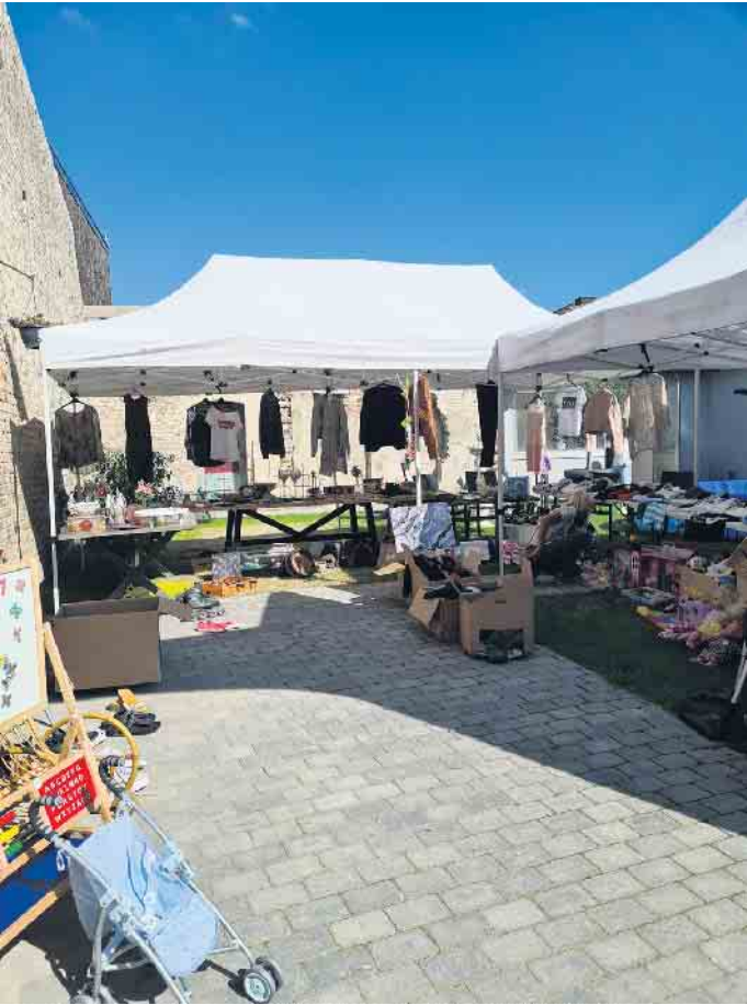
Foto vom Dorftrödel 2022