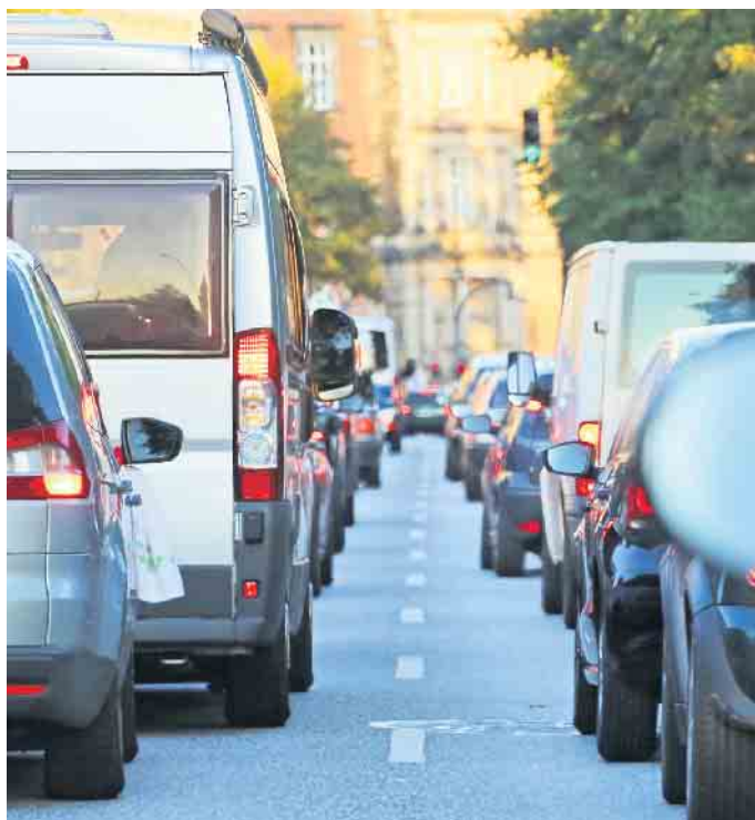
Der Stadtverkehr mit permanentem „Stop-and-go“ bietet geradezu ideale Bedingungen für die Rekuperation von Elektro- und Hybridautos.

Die Rekuperation bietet weitere Vorteile: Bei üblichen Bremsvorgängen reicht bereits der Generator aus, um das Fahrzeug zum Stehen zu bringen. Die konventionelle Bremse kommt somit seltener zum Einsatz und verschleißt weniger, sodass Autofahrer bares Geld bei der Wartung sparen. Gleichzeitig können nach Berechnungen von Bosch die Bremsstaubemissionen um bis zu 95 Prozent gesenkt werden. Regenerative Bremssysteme gibt es für Fahrzeuge mit unterschiedlichen elektrifizierten Antrieben. Dazu zählen reine Elektrofahrzeuge, die ausschließlich mit einem Elektromotor ausgestattet sind, sowie Hybridautos. Neben dem Verbrennungsmotor haben diese zusätzlich einen Elektromotor an Bord. Plug-in-Hybride lassen sich ebenfalls per Ladekabel über das Stromnetz aufladen. Ihre Fahrzeugbatterie ist entsprechend größer dimensioniert als bei konventionellen Hybridfahrzeugen. Sie können in der Regel mindestens 50 Kilometer rein elektrisch fahren. Auch sie profitieren im Fahrbetrieb von der Energierückgewinnung über die Batterie. (did)