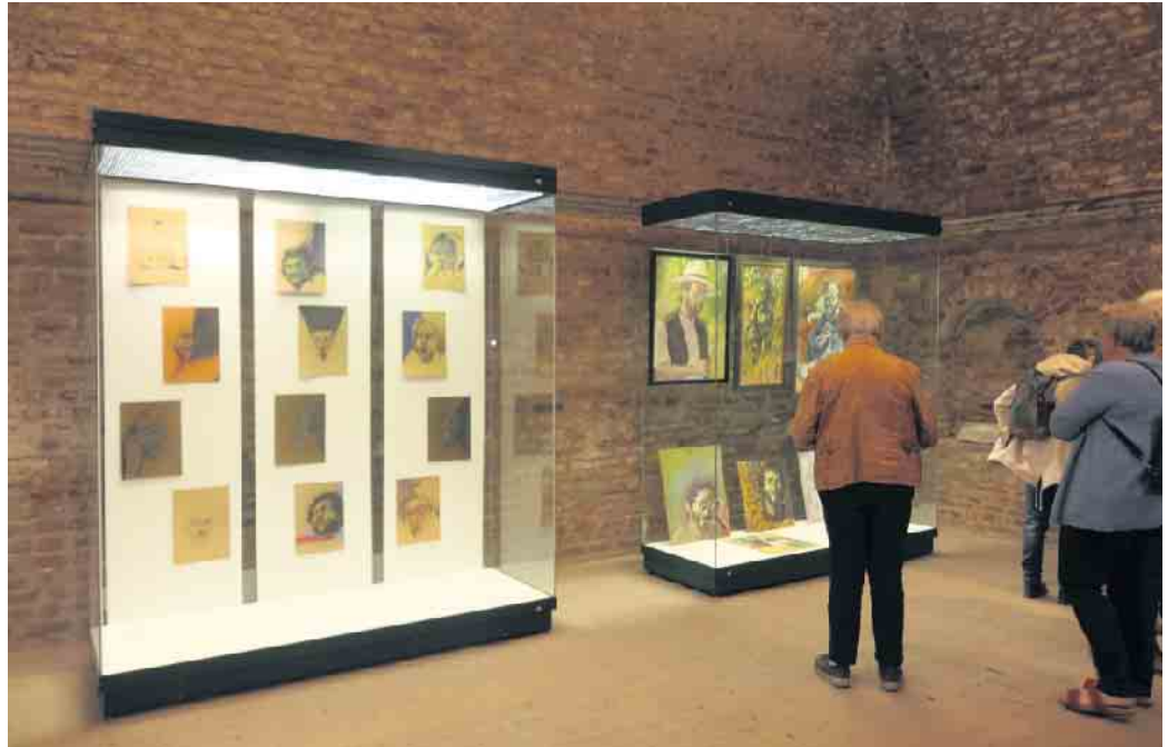
Ausstellung „ECCE EGO“, Foto: Museum Zitadelle/B. Dautzenberg

Die Führung ist kostenlos, der reguläre Eintritt ist zu entrichten. Treffpunkt ist um 11 Uhr der Info-Pavillon in der Zitadelle. Die nächste Führung findet am 17. September statt.