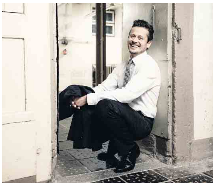
Roman Knizka.

Das Bläserquintett OPUS 45 spielt Kompositionen u.a. von Pavel Haas, Hans Krása, Viktor Ullmann und Gideon Klein. In Theresienstadt inhaftiert und von den Nationalsozialisten ermordet, geriet das Werk dieser bedeutenden Komponisten nach Ende des Zweiten Weltkriegs lange Zeit in Vergessenheit.