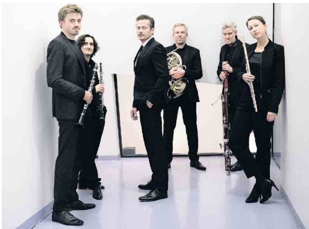
OPUS 45.

Musikalische Lesung über das Ghetto Theresienstadt