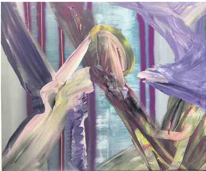
Ursula Schregel, ohne Titel, 2022, Acryl und Tape auf Leinwand, 100x120cm

Ausstellungseröffnung und Kulturprogramm im Atelier der Malerin Ursula Schregel