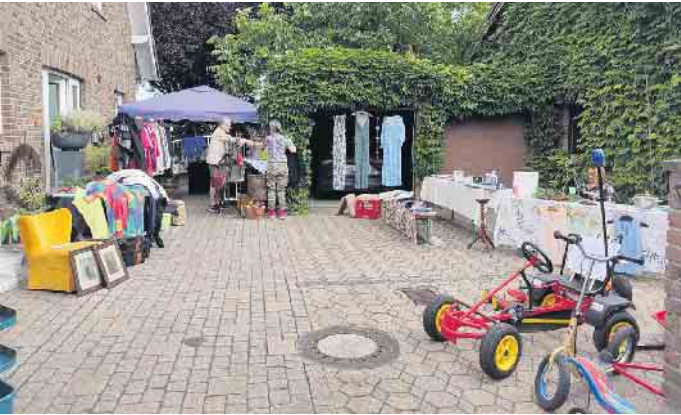
Foto vom Dorftrödel 2022