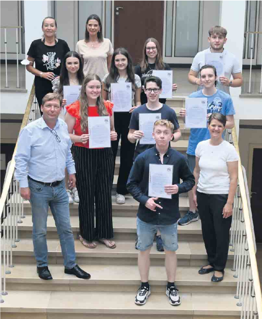
Bürgermeister Axel Fuchs empfing die Jugendlichen im Großen Sitzungssaal und auf der Rathautreppe präsentierten die Geehrten ihre Bescheinigungen.

Aus den Händen von Bürgermeister Axel Fuchs erhielten kurz vor Ferienbeginn insgesamt acht Jugendliche des Gymnasiums Zitadelle ganz besondere Ehrenamtsbescheinigungen. Seit Beginn dieses Schuljahres nimmt das Gymnasium Zitadelle an dem bundesweit agierenden Mentorenprogramm „Balu und Du“ teil, das sich zum Ziel gemacht hat, die Chancengleichheit und Bildungsgerechtigkeit für Grundschülerinnen und -schüler zu steigern. Ein Schuljahr lang haben sich acht Oberstufenschülerinnen und -schüler des Gymnasium Zitadelle im Pädagogik-Projektkurs „Balu und Du“ ehrenamtlich in der Stadt Jülich engagiert. Sie übernahmen in diesem Rahmen für ein Jahr eine Patenschaft für Grundschülerinnen und -schüler, die unter schwierigen Bedingungen aufwachsen. Beide trafen sich einmal wöchentlich in ihrer Freizeit und durch die persönliche Zuwendung gewannen die Kinder der Grundschule an Selbstvertrauen und wurden beim Aufbau eines positiven Selbstbildes unterstützt. Die Wirkung des Programms ist durch Langzeitstudien belegt und zeichnet sich durch einen großen positiven Mehrwert für die Kinder aus. Zum Ende des Schuljahres und damit auch des Projektkurses wurden die engagierten Jugendlichen von Bürgermeister Axel Fuchs ins Rathaus eingeladen, wo sie ihm von ihren Erfahrungen berichteten. Er zeigte sich interessiert und beeindruckt und bedankte sich bei der feierlichen Übergabe Ehrenamtsbescheinigungen auch mit kleinen Präsenten als Zeichen der Wertschätzung des sozialen Engagements der Jugendlichen.