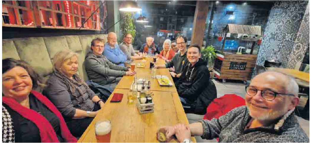
GRÜNER Stammtisch am 14.07.2023 um 19 Uhr im Café GusToso

Alle interessierten Menschen können ab 19 Uhr im Café GusToso am Marktplatz ihre Fragen und Anregungen an die Grünen loswerden. In ungezwungener Atmosphäre werden wir dort Rede und Antwort stehen und gerne Stellung zu strittigen Beschlüssen der letzten Monate nehmen. Auch wer uns einfach nur kennen-