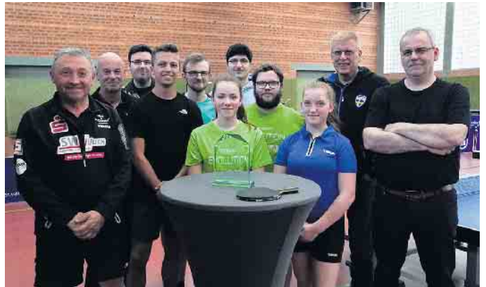
Die Trainer und Trainerinnen des TTC indeland Jülich

Dazu kam der unermüdliche Einsatz bei den Minimeisterschaften des Deutschen Tischtennisbundes. Seit 2018 nahmen insgesamt 717 Kinder an den Veranstaltungen des TTC indeland Jülich teil. Großturniere wie der Kreis-, Bezirks- und Verbandsentscheid der Minis, sowie die Deutsche Meisterschaft der Jugend-Para wurden in der Nordhalle organisiert und durchgeführt. Die Auszeichnung motiviert die Trainer und Trainerinnen, den Tischtennissport in Jülich weiter voran zu treiben.