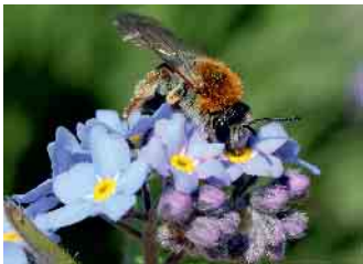
Sandbiene (Andrena haemorrhoa).

ger. Denn diese Flächen können wertvolle Lebensräume für Insekten, Vögel und andere Tiere bieten und zugleich Orte für das Naturerleben und für soziale Begegnungen schaffen. Hierzu braucht es allerdings Fachwissen, insbesondere in den „grünen Berufen“. In über 100 Einheiten mit insgesamt fünf Stunden Videomaterial und über 20 Quiz- beziehungsweise Testfragen können sich Interessierte dieses gut aufbereitete Wissen zeit- und ortsunabhängig und in ihrem individuellen Lerntempo aneignen. Der Einstieg ist jederzeit möglich. Das Lernangebot beinhaltet folgende Module: 1) Einführung Naturgarten, 2) Pflanzen & Tiere, 3) Anlage naturnaher Flächen, 4) Pflege naturnaher Flächen, 5) Kommunikation. Dominik Jentzsch, Projektmitarbeiter und Online-Referent von