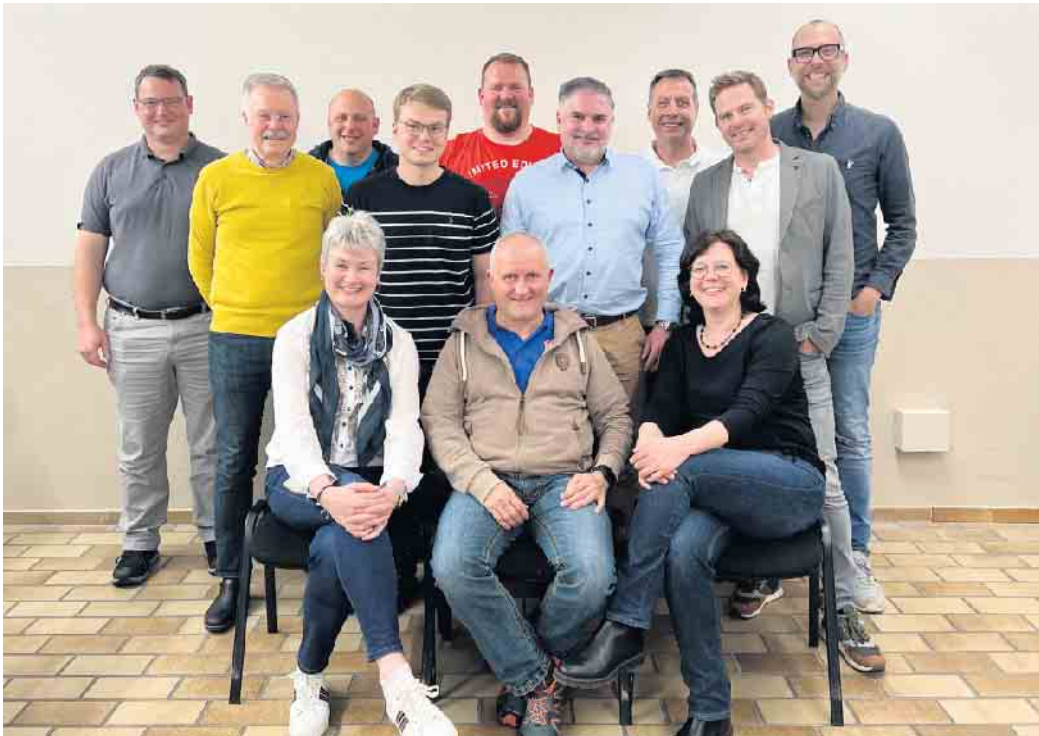
Der neue gewählte Vorstand führt die KG Schnapskännchen Gästen 1936 e. V. in die Jubiläumssession

Blick zurück auf erfolgreiche Session und Vorfreude auf Jubiläumssession 23/24