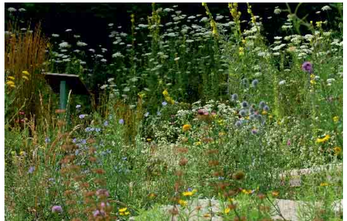
Naturgärten sind Blüh- und Insektenparadies zugleich.

ist die Stiftung für ihre Initiative Deutschland summt! bekannt. Damit lenkt sie seit 2010 die Aufmerksamkeit auf Möglichkeiten, dem Insektensterben entgegenzutreten. Es entstand ein Netzwerk aus über 35 Gemeinden, Kommunen und Landkreisen, das sich vor Ort für mehr biologische Vielfalt einsetzt. Mehr über das Projekt „Treffpunkt Vielfalt“ unter: https://berlin.treffpunkt-vielfalt.de/home-berlin.html