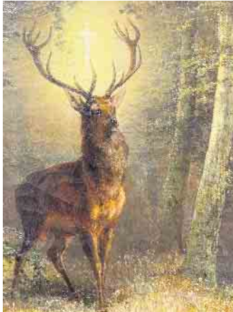
Foto: Museum Zitadelle, A. v. Wille - Waldlichtung mit heiligem Hubertus

Phantasievolle Tierwesen und wie sie zu finden sind