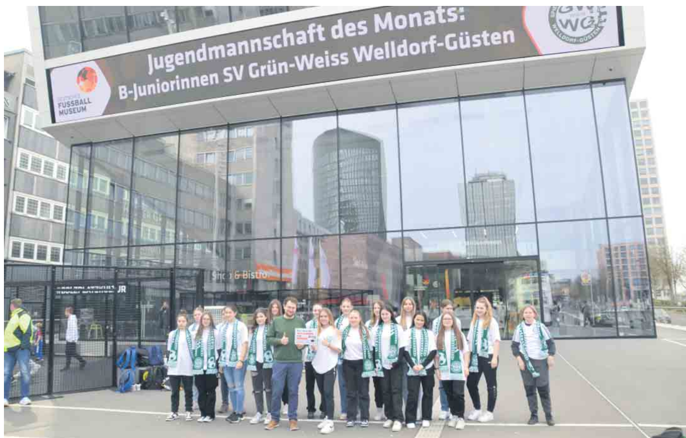
Empfang vor dem Fussballmuseum

Grün-Weiss-Ladies vom Deutschen Fußballmuseum gewählt