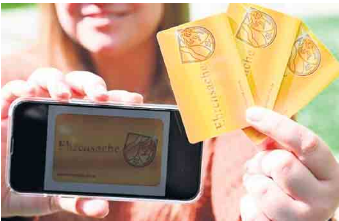
Die Ehrenamtskarte gibt es im Scheckkartenformat oder neu auch als App für das Smartphone.