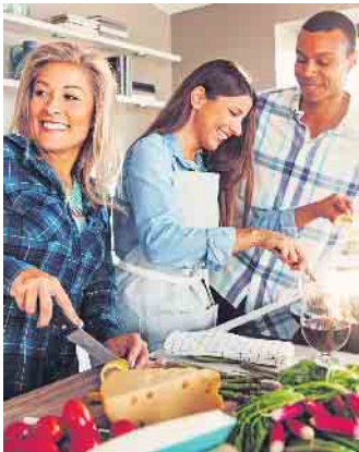
So macht Shoppen Spaß. Bei einer gemeinsamen Küchenparty lässt sich vor der Kaufentscheidung alles in Ruhe ausprobieren.

Direktvertrieb bietet flexible Bedingungen und gute Chancen für Quereinsteiger