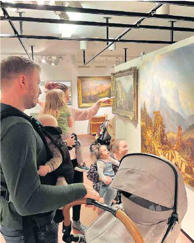
Besucher in der Landschaftsgalerie am Kulturhaus

mung in die für gewöhnlich stillen Räume. Bei der Aktion „Museum zum Anfassen“ gibt es sogar einiges mit den Händen zu entdecken. Weitere Informationen sind den Terminankündigungen zu entnehmen. Termine und Anmeldungen sind unter www.museum-zitadelle.de zu finden.