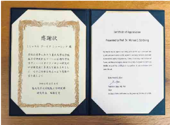
Urkunde der Graduate School of Biomedical Engineering / Tohoku Universität