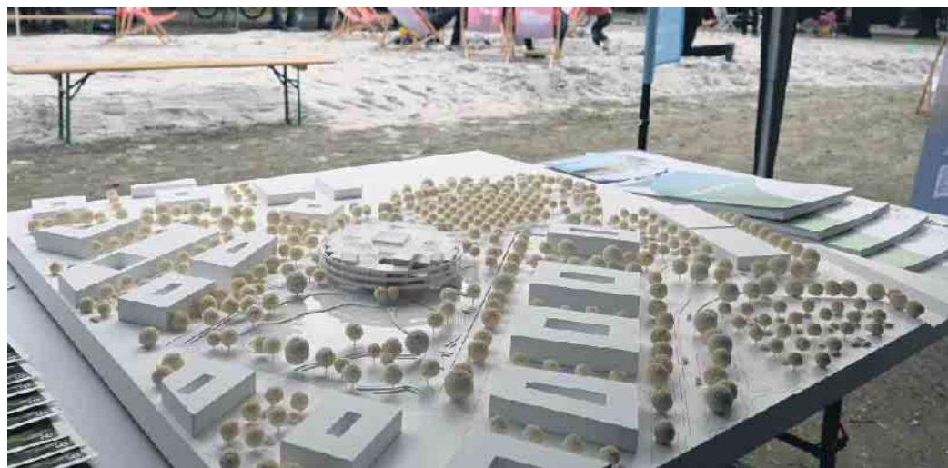
Neben der Stadt sind auch viele andere Akteure vor Ort und präsentieren ihre Planungen.

Revier (ZRR), die Entwicklungsgesellschaften indeland GmbH und Neuland Hambach GmbH sowie das FZ Jülich und RWE. Zudem wird der Campus Jülich der FH Aachen, das Zentrum für Luft und Raumfahrt (DLR), das HC H2 Helmholtz Cluster Wasserstoff, der Kreis Düren, die Stadtentwicklungsgesellschaft SEG, das Strukturwandelmanagement sowie das NaMoK Team der Stadt Jülich vor Ort sein.