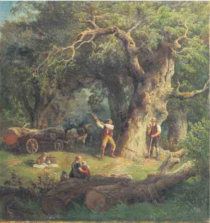
Museum Zitadelle W. Porttmann - Das Fällen der Eiche, Inv.Nr. 2013-0067.