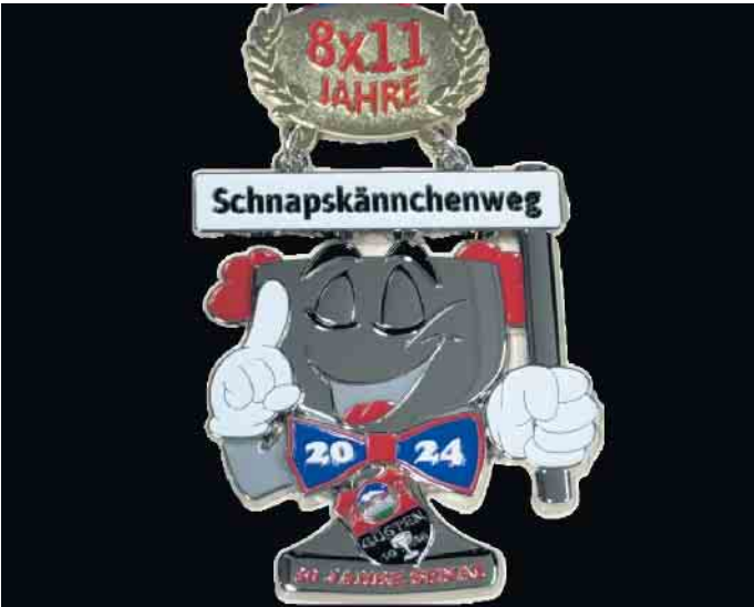
Der Orden im Jubiläumsjahr - genauso in Feierlaune wie die KG Schnapskännchen

Zum 8x11-jährigen Bestehen wird ausgiebig am letzten Aprilwochenende gefeiert