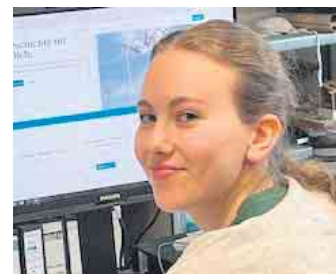
Bildarchiv Museum Zitadelle: Bundesfreiwilligendienstleistende

Bewerben kann man sich unter 02461-63510 oder museum@juelich.de . Aber was macht man im Museum? Unsere Bundesfreiwilligendienstleistende hat einen Erfahrungsbericht geschrieben, der Einblicke in ihre alltäglichen Aufgaben gibt. Diese sind unter www.museum-zitadelle.de zu finden. Wir freuen uns auf deine Bewerbung!