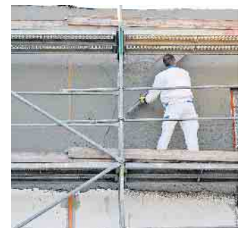
Der Kauf einer Eigentumswohnung in einem Mehrgeschoß-Neubau ist eine Alternative zum Bau eines Eigenheims.

Auch in neu gebauten Eigentumswohnungen haben Besitzer das Recht auf ein mangelfreies Werk. Laut einer BSB-Studie zu Mängeln in Mehrfamilienhäusern ist das nicht immer selbstverständlich. Ähnlich wie beim Bau eines Eigenheims empfiehlt es sich daher auch beim Wohnungserwerb im Neubau, einen unabhängigen Bauherrenberater mit einer baubegleitenden Qualitätskontrolle zu beauftragen. Frühzeitig festgestellte Mängel lassen sich rechtzeitig beim Bauträger oder Verkäufer anzeigen und können in vielen Fällen mit überschaubarem Aufwand behoben werden. Nachbesserungen, wenn die Wohnung bereits bezogen ist, sind dagegen lästig und oft aufwendig. (djd)