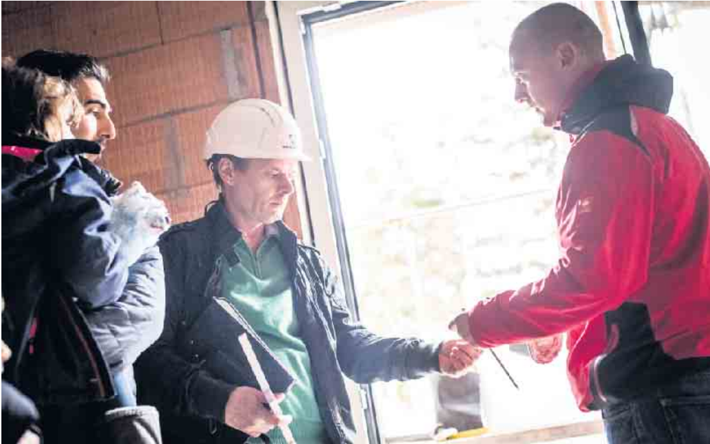
Beim Erwerb einer Eigentumswohnung im Neubau lassen sich Baumängel durch eine baubegleitende Qualitätskontrolle oftmals vermeiden.

Auch beim Wohnungskauf gibt es Fallstricke, die man kennen sollte