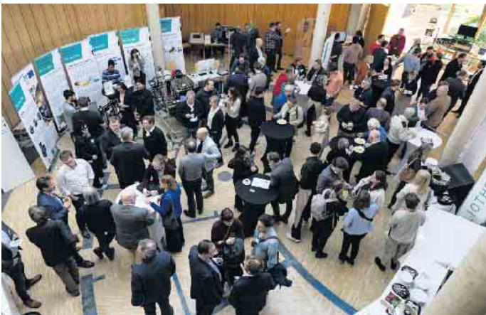
Forschungs-, Innovations- und Transfertag an der FH Aachen