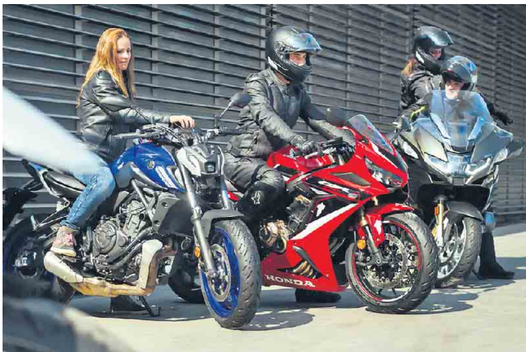
Die Freiheit auf zwei Rädern genießen - hochwertige und gut gepflegte Reifen sorgen dabei für ein sicheres Vergnügen.

Für Biker gibt es kaum Schöneres als eine Tagestour mit Freunden, bei der man besondere Augenblicke teilt. Gute Reifen verbinden dabei Fahrspaß mit Sicherheit und Komfort. Allgemein dürfen Reifen gefahren werden, bis die gesetzliche Verschleißgrenze von 1,6 Millimetern Profiltiefe erreicht ist oder Alterungsspuren sichtbar werden. Auf Nummer sicher gehen alle, die Motorradreifen nach fünf Jahren einmal jährlich von einem Fachmann prüfen lassen und die Reifen nach maximal sieben Jahren austauschen. Durch einen Wechsel profitieren Motorradfahrer gleichzeitig von aktuellen Weiterentwicklungen unter anderem bei der Profilgestaltung, den Rohmaterialien und dem Reifenaufbau. Mit verbesserten Eigenschaften verbin-