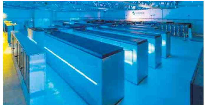
Der Jülicher Superrechner JUWELS bietet mit seinem Booster-Modul Deutschlands stärkste Plattform für KI.