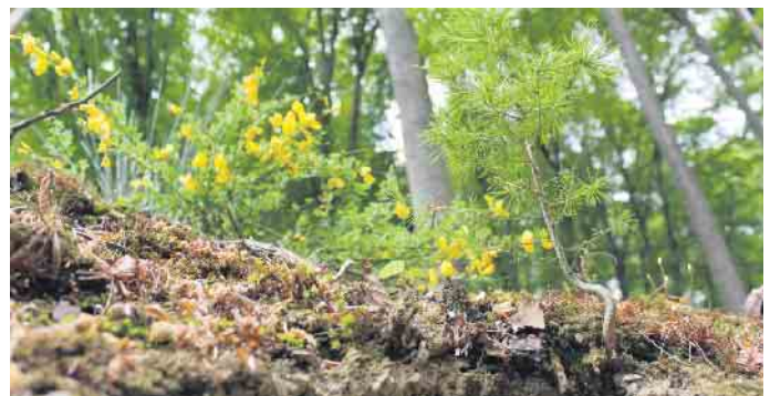
Nachwachsender und klimafreundlicher Rohstoff: Holz speichert während seines Wachstums große Mengen an Kohlendioxid.

aus nachhaltiger Waldbewirtschaftung stammt. Dazu sollte man auf die Herkunft und entsprechende Zertifizierungen achten. „Wer Holzprodukte benötigt, sollte zum örtlichen Fachhändler gehen, der garantiert nur Material aus unbedenklichen Quellen verkauft“, rät Thomas Goebel. Die Europäische Holzhandelsverordnung (EUTR) etwa schreibt vor, dass der legale Ursprung des Holzes nachgewiesen werden muss - das gilt sowohl für einheimisches als auch importiertes Holz. Ergänzend sorgen Zertifizierungssysteme wie PEFC und FSC für Transparenz. Unter www.holzvomfach.de gibt es dazu mehr Informationen sowie weitere Tipps zum nachhaltigen und klimaschonenden Bauen. (djd)