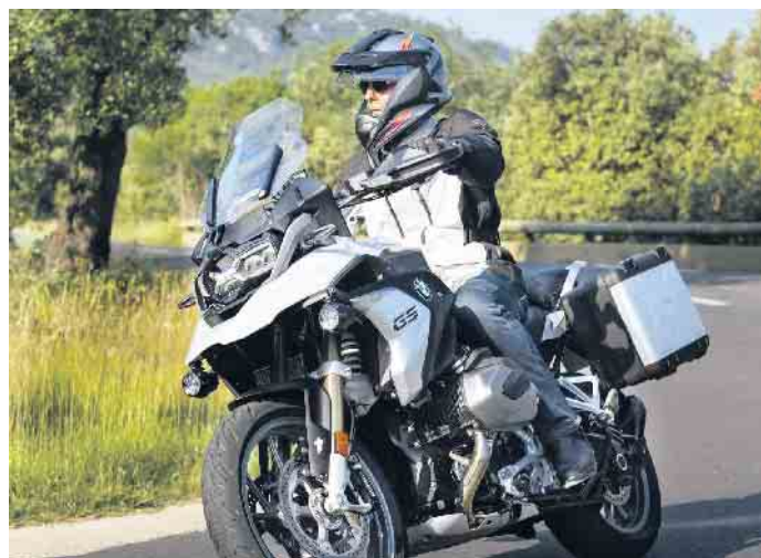
Für genug Grip sollten Biker den Reifenfülldruck alle 14 Tage überprüfen.

Dauerhafter Kontakt zu Öl, Benzin, Lösungsmitteln und Chemikalien sollte in jedem Fall vermieden werden. Eine kurze Behandlung, zum Beispiel beim Entfernen eines Etiketts mit Bremsenreiniger, schadet dem Reifen jedoch nicht. Ebenfalls unbedenklich verwendet werden kann Shampoo - anschließend mit klarem Wasser gründlich abspülen. Wer zum Dampfstrahler greift, sollte einen Mindestabstand der Düse zu den Reifen von 15 Zentimetern einhalten, um Beschädigungen zu vermeiden. (djd)