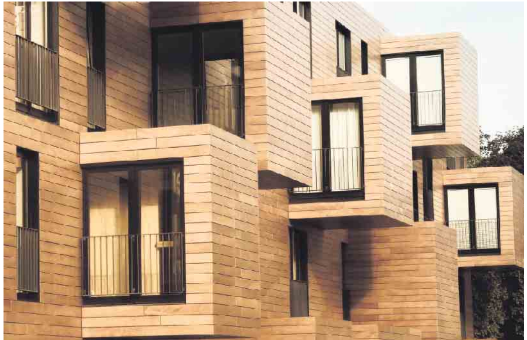
Holz zählt zu den ältesten Baumaterialien, die der Mensch nutzt - und ist unter Aspekten des Klimaschutzes gleichzeitig Rohstoff der Zukunft.

Wichtig für die Klimabilanz ist es zudem, dass das verwendete Holz