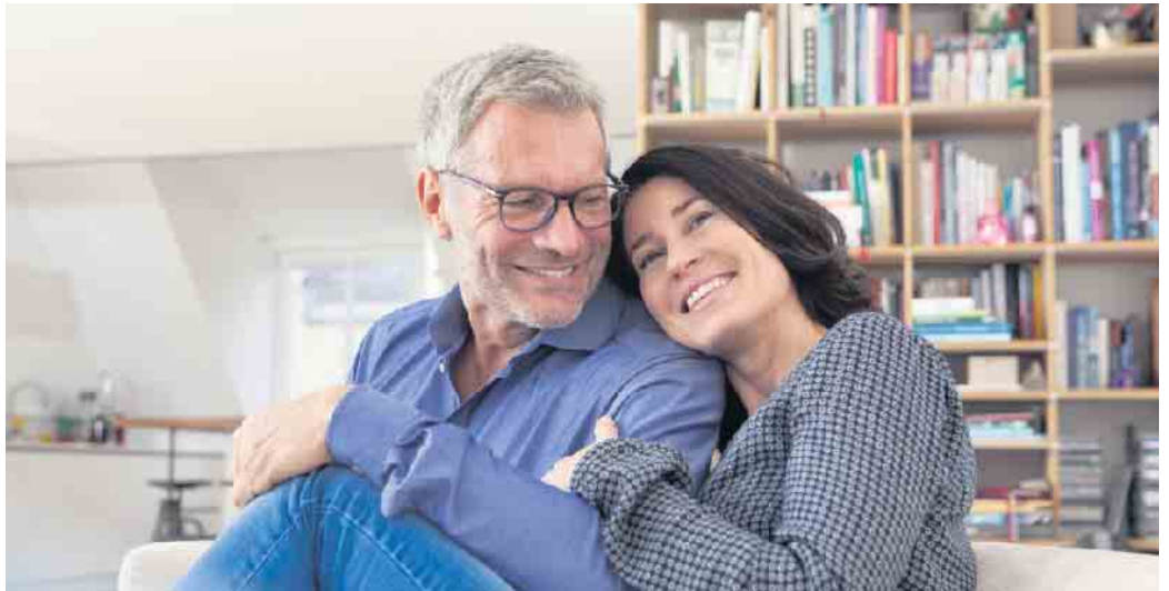
Gemütlichkeit muss nicht auf Kosten des Energieverbrauchs gehen. Eine hochwertige Dämmung der Wände hält die Wärme besser in Haus oder Wohnung.

Ein klammes Raumklima trotz aufgedrehter Heizungsthermostate ist ein deutliches Zeichen dafür, dass das Zuhause dringend modernisiert werden sollte. Bei schlecht oder gar nicht gedämmten Außenwänden geht permanent Wärme verloren, es muss entsprechend nachgeheizt werden - das wiederum erhöht unnötig den Energieverbrauch. Eine professionell geplante und ausgeführte Wärmedämmung hingegen hält die Heizenergie besser im Raum. Sie sorgt für wärmere Oberflächen und verbessert so spürbar das Raumgefühl - Gemütlichkeit und Sparsamkeit lassen sich vereinen. Der erste Schritt zu mehr