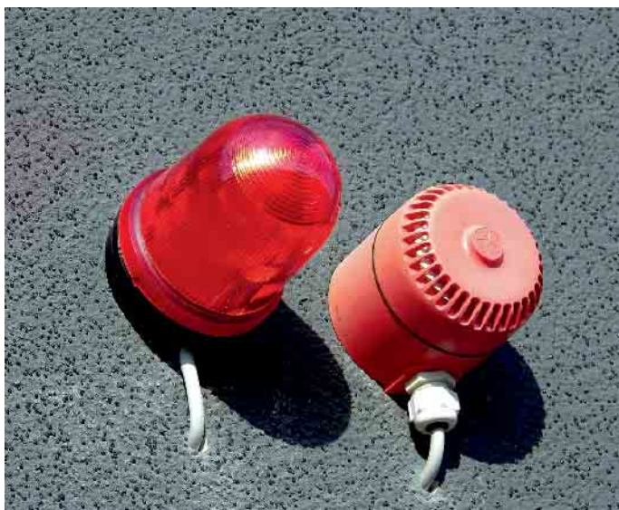
Am 14. März findet der landesweite Warntag mit Auslösen des Sirenenalarms statt.

Die Auslösung der Sirenen erfolgt in folgender Dauer und Tonfolge: 1 Minute Entwarnung - 1 Minute Warnung - 1 Minute Entwarnung mit einer Pause von jeweils 5 Minuten zwischen den Tonfolgen. Die Entwarnung erfolgt um 11.20 Uhr. Diese Entwarnung wird systembedingt nicht über den Warnkanal „Cell Broadcast“ erfolgen. Alle Informationen zum Thema „Cell Broadcast“ als neues Warnmittel des Bundes gibt es beim Bundesamt für Bevölkerungsschutz und Katastrophenhilfe (BBK). Thema Cell Broadcast (inkl. FAQ): www.bbk.bund.de/DE/Warnung-Vorsorge/Warnung-in-Deutschland/So-werden-Sie-gewarnt/Cell-Broadcast/cell-broadcast_node.html#vt-sprg-4