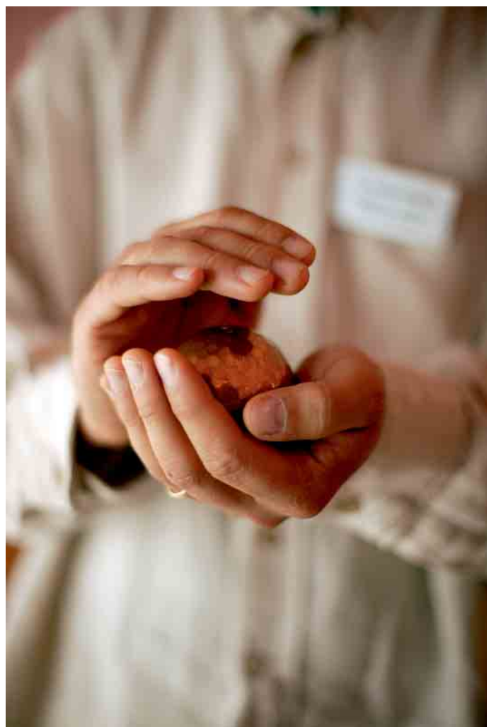
Die eigenen Bedürfnisse wahrnehmen - das unterstützt den Heilprozess.