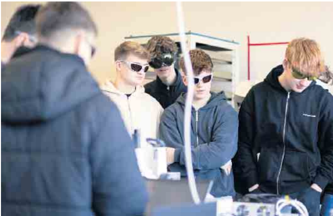
Experimente mit Lasertechnik

„Physik in der Industrie“ schafft Einblicke in den Studiengang Physikingenieurwesen und berufliche Perspektiven