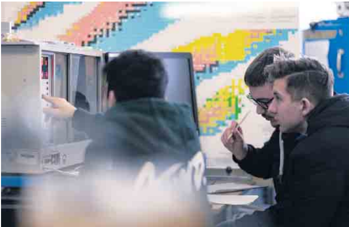
Schüler:innen am Röntgengerät

Wo lassen sich Wellen überall feststellen? Was macht die Lasertechnik so bedeutsam für industrielle Anwendungen? Und welche Verbindung gibt es eigentlich zwischen der Teilchenphysik und der Röntgenstrahlung? Beim Praxistag „Physik in der Industrie“ konnten 29 Schüler:innen des Franken-Gymnasiums Züllich diese und viele weitere Fragen bei einem Besuch des Campus Jülich der FH Aachen klären. Die Schüler:innen aus den Physik-Grundkursen der Jahrgangsstufe 12/Q2 konnten nun viele Inhalte des Physikunterrichts mit praktischen Experimenten und Beispielen verknüpfen und vertiefen. Die Tagesveranstaltung beinhaltete neben drei intensiven Laborbesuchen der Lasertechnik, Materialwissenschaft und Teilchenphysik auch ein Rahmenprogramm mit Informationen zum Studiengang Physikingenieurwesen und zu den beruflichen Perspektiven. Außerdem standen ein Campusrundgang und ein gemeinsamer Mensabesuch auf dem Plan, und die Möglichkeit zum persönlichen Austausch mit den Studierenden