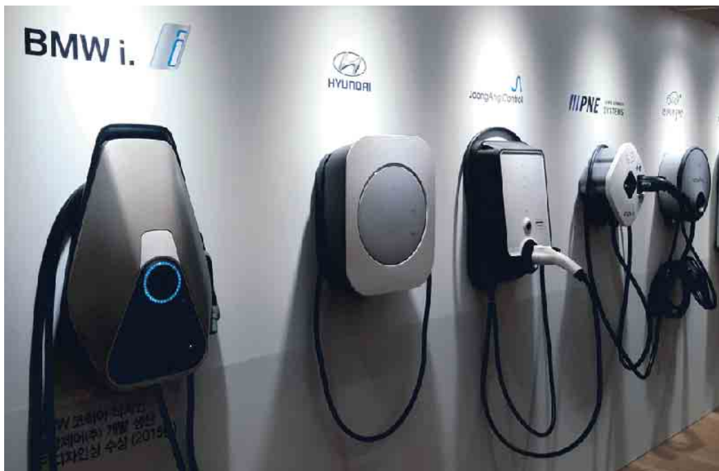
Für Autofahrer ist das Ladeangebot noch recht unübersichtlich.

Ab 2035 dürfen in der ganzen EU nur noch emissionsfreie Neuwagen zugelassen werden. Mobilitätsexperten des Autoclubs Europa (ACE) erläutern, was die Entscheidung des EU-Parlaments für Autofahrer konkret bedeutet.