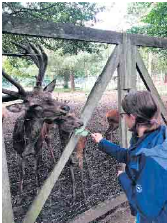
Tierfütterung bereitet den Kindern immer eine große Freude

gebucht werden. Der Beitrag beträgt 88 € pro Kind. Die Registrierung über das online-Portal kann vom 1. bis 9. Februar vorgenommen werden. In den Sommerferien können Einzelwochen oder zwei Wochen im Block gebucht werden. Es stehen drei Wochenblöcke zur Verfügung. Das Zwei-Wochen-Programm wiederholt sich in den Folgewochen. Der Beitrag beträgt pro Woche 110 € pro Kind. Die online-Registrierung ist vom 1. bis 16. Februar möglich. Der Link www.ferienspiele-juelich.de ist benutzerfreundlich zugänglich an Computer, Tablet und Handy. Ohne Zeitstress können sich alle Interessierten dort registrieren. Der Vorteil: Alle haben damit die gleiche Chance auf einen Platz. Nach Ablauf der Registrierungszeit werden aus allen Registrierungen 40 Plätze verlost und jede