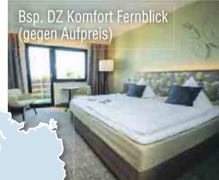
Bsp. DZ Komfort Fernblick (gegen Aufpreis)