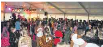
Am Fettdonnerstag steigt wieder die große Zeltdisco auf dem Schlossplatz.

Dinge bleiben am besten auch zuhause. Das Amt für Kinder, Jugend, Schule, Sport lädt zu der Party ein, die mit Unterstützung zahlreicher Fachkräften aus der Jugendarbeit, Jugendamt, Ordnungsamt, THW und DRK organisiert wird. Und noch eine gute Nachricht für Eltern: Selbstverständlich wird wieder ein professionelles Security-Unternehmen die Eingangskontrollen übernehmen, damit alle unbesorgt „Party machen“ können.