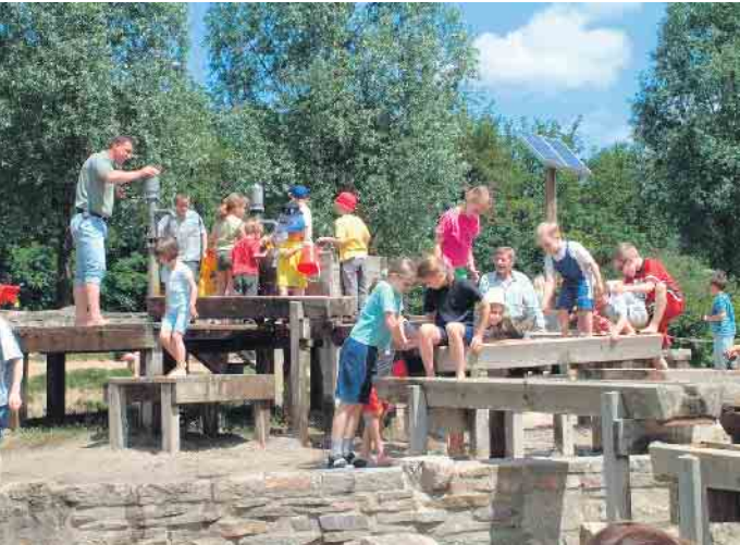
Der Wasserspielplatz ist äußerst beliebt.

Online-Registrierung startet am 1. Februar