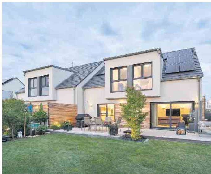
Doppelhaus in Fertigbauweise - das geht achsensymmetrisch oder auch grundverschieden.

Wand an Wand mit Freunden, Familie oder Bekannten - das bietet schon beim Hausbau einen großen Vorteil: Die Planungs- und Baukosten werden durch zwei Parteien geteilt und sind dadurch geringer als bei zwei getrennt voneinander stehenden Einfamilienhäusern. Zudem lässt sich durch ein Doppelhaus wertvolle Grundstücksfläche einsparen, denn nur die Außenwände müssen den gesetzlich vorgeschriebenen Mindestabstand zu den Nachbargrundstücken einhalten. Der so gewonnene Platz kann für das Haus oder den Garten eingeplant werden. Auf einem kleineren Grundstück ist ein Doppelhaus mitunter sogar die einzige Chance auf zwei unabhängige Eigenheime und damit auf eine kostengünstigere Alternative zum Einfamilienhaus. Ein weitere-