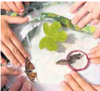
Es wurde genau beobachtet, wie aus der Raupe ein Distelfalter wird, dann hieß es Abschied nehmen auf der Schulwiese.

sich zum Forschen: Luft, Wasser, Wetter, Pflanzen und Tiere... Geforscht wurde bei der Kartoffelernte der Familie Lieven von der Titzer Mühle. Kooperationspartner sind zudem das Gymnasium Haus Overbach, das die GrundschülerInnen regelmäßig zum Programmieren der BeeBots einlädt, sowie das JuLab des Forschungszentrums, das beim Boden-Erforschen und beim Thema Strom gerne wissenschaftlich begleitet. Geforscht wird aber auch gerne im Mathematikunterricht, hier besonders auch bei geometrischen Themen. Geforscht wird analog und