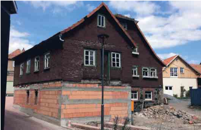
Bevor die Maler kamen, war die Mühle in einem traurigen Zustand.

und Kirchenmalerei, Bauten- und Korrosionsschutz ermöglichen es, Karriere zu machen. Die Nachwuchsförderung und damit die Zukunft der „Next Generation“ im Maler- und Lackierhandwerk ist wesentlicher Bestandteil der Caparol-Firmenphilosophie. Mit der Initiative „Mal Dir Deine Zukunft aus!“ werden Berufseinsteiger oder frischgebackene Selbstständige - mit einem breiten Förderangebot unterstützt. Mehr unter www.caparol.de/nachwuchsfoerderung (akz-o)