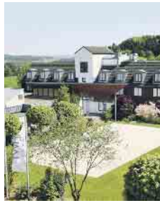
Beispiel DZ Comfort