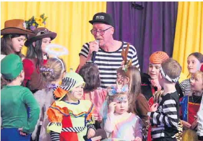
GKG Kindersitzung 2023