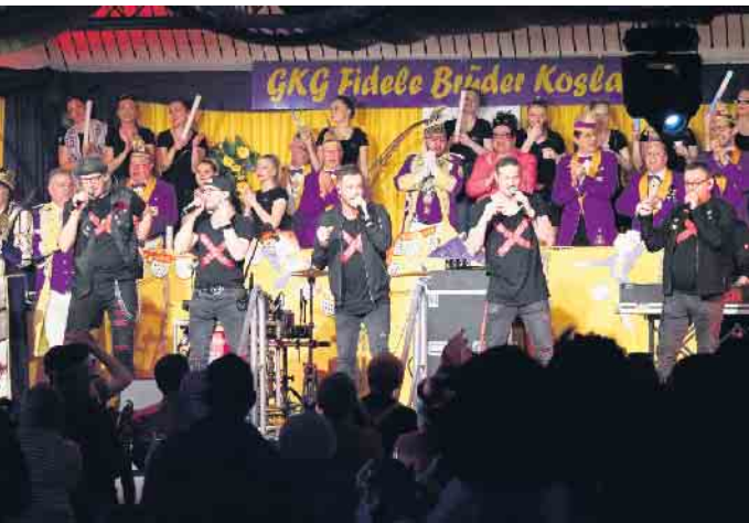
GKG Kostümsitzung 2023

Der Karnevalsumzug mit anschließender After-Zoch-Party und Kostümpremierung findet wieder am Samstag, 10. Februar, statt. Anmeldungen zum Umzug sind bis zum 28. Januar möglich. Am Tulpensonntag nimmt die GKG erneut am Jülicher Kengerzoch teil. Alle Infos zur GKG unter www.gkg-fidele-brueder-koslar.de