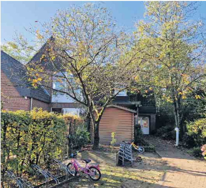
Ki-IsS Familienzentrum-St. Nikolaus Kindergarten

www.fbs-geldern-kevelaer.de oder Telefon: 02831-134-600