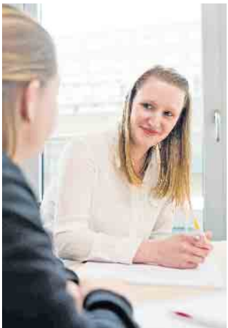
Von Mensch zu Mensch: Im Einzelcoaching werden die beruflichen Potenziale der Arbeitssuchenden ermittelt.