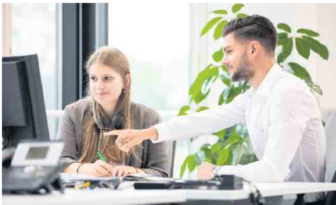
Die künftigen Vertriebstalente im Außendienst sind gefragt und die Entwicklungsperspektiven ausgezeichnet.

dem Kölner Versicherer. Diese Entscheidung hat die junge Frau nicht bereut, die Ausbildung macht ihr großen Spaß: „Ich bin stolz darauf, dass am Ende des Tages meine Kunden zu mir sagen ‚Ich vertraue Ihnen‘. Das ist ein sehr schönes Gefühl und motiviert mich“, erzählt sie. Auch die vielseitigen Ausbildungsinhalte gefallen Gizem: „Von der Kundenberatung über die Angebotserstellung bis hin zum Verkauf werden wir in vollem Umfang in die Arbeitsabläufe einbezogen.“ Die Auszubildenden haben direkten Kontakt zur Kundschaft, sie nehmen Außentermine wahr und beraten Kundinnen und Kunden auf Wunsch zu Hause. Während der gesamten Ausbildung erfah-