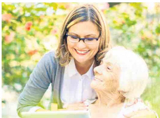
Senioren-Assistentinnen begegnen den älteren Menschen auf Augenhöhe, mit Wertschätzung, Würde und Respekt.