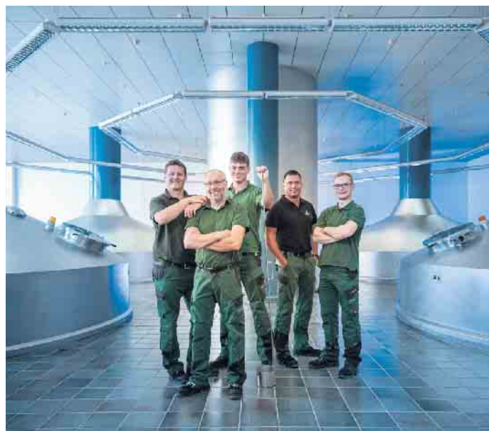
Ein traditionsreicher Beruf setzt heute auf fortschrittliche Technik: Das macht den Reiz der Tätigkeit des Brauers und Mälzers aus.

Bier und Holz zu vermeiden, mussten Küfer die Holzfässer mit flüssigem und extrem heißem Pech auskleiden. War die dünne Schicht beschädigt, musste mühsam eine neue aufgetragen werden. (djd)