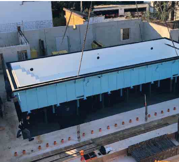
Poolbau mit Präzision.

Als Handwerker ist man derzeit in vielen Branchen gefragt - auch und ganz besonders in der Schwimmbadbranche. Hier gibt es nicht nur sichere Arbeitsplätze und faire Bezahlung, sondern etwas, das andere Wirtschaftszweige nicht bieten können: Arbeiten mit Urlaubsfeeling.