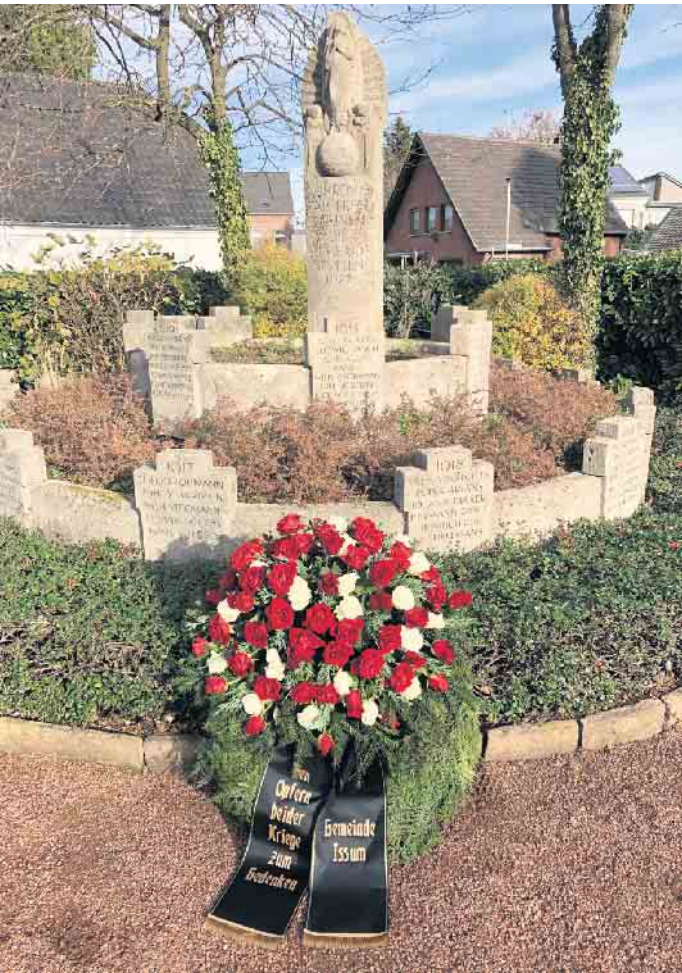
Das Ehrenmal auf dem Ehrenfriedhof in Sevelen - „Wir erinnern und mahnen zum Frieden“

Mit freundlichen Grüßen Gemeinde Issum Der Bürgermeister Brüx