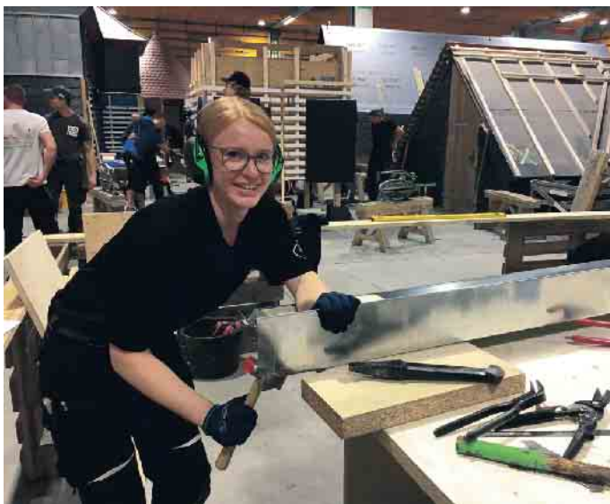
Im Dachdeckerhandwerk ist nicht mehr nur reine Muskelkraft gefragt. Dafür aber vielseitige Fähigkeiten, die den Beruf zunehmend für Frauen interessant machen.

Traditionelle Männerberufe werden zunehmend auch für Frauen interessant. Denn mittlerweile ist nicht mehr reine Muskelkraft gefragt. Zum Beispiel im Dachdeckerhandwerk: Dachziegel werden nicht mehr nach oben geschleppt, dafür gib es Lastenaufzüge, mittlerweile auch für sperrige Photovoltaik-Anlagen. Für erste Dach-Begutachtungen werden Drohnen losgeschickt, Materialien werden in kleinere Pakete gepackt, damit sie weniger wiegen. Dafür ist es ein unglaublich vielseitiger Beruf: Fassaden und Dächer werden gedämmt, mit ganz unterschiedlichen Materialien und Verfahren. Bei Sanierungen wird auch mal ein Dach komplett neu eingedeckt, zum Beispiel mit Schiefer, Dachziegeln, Holzschindeln