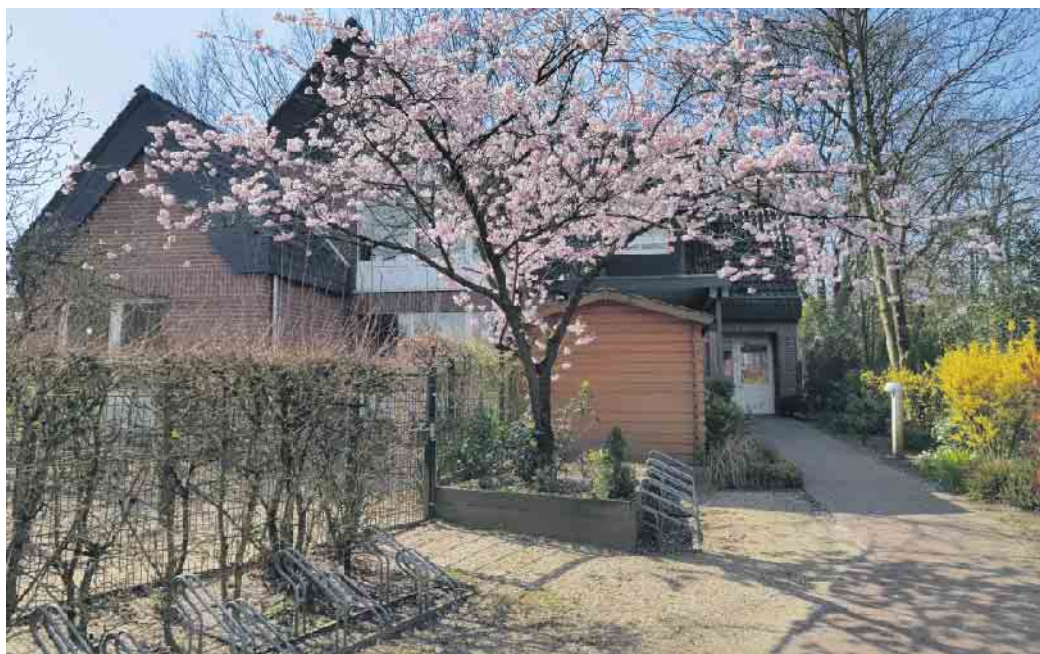
Ki-IsS Familienzentrum-St. Nikolaus Kindergarten

fz.ki-issum@bistum-muenster.de oder telefonisch unter: