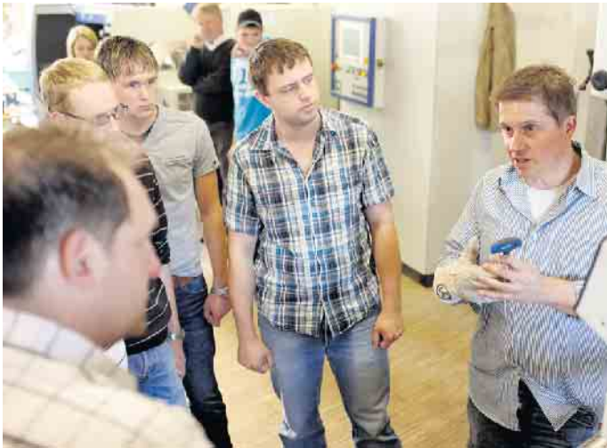
Nachhaltig die berufliche Zukunft gestalten: Rund um das Naturmaterial Holz bieten sich im Fachhandel viele Ausbildungschancen.

Eine Ausbildung im Holzfachhandel bietet attraktive Perspektiven