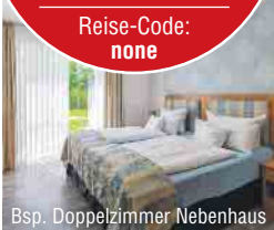
Bsp. Doppelzimmer Nebenhaus

Termine & Preise in €/Person im DZ Nebenhaus