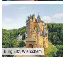
Burg Eltz, Wierschem