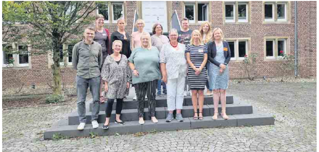
Gruppenfoto der Gleichstellungsbeauftragten im Kreis Kleve mit den Akteurinnen und Akteuren der Workshops.

Auf Einladung der Gleichstellungsbeauftragten besuchten ca. 70 Auszubildende der Kommunen im Kreis Kleve und der Kreisverwaltung Kleve die Ausstellung. Sie nahmen an Workshops teil, in denen sie sich intensiv mit dem Thema „Sexuelle Belästigung am Arbeitsplatz“ auseinandersetzten. Diese Workshops, geleitet