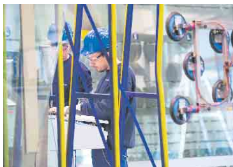
In der Flachglasbranche gibt es spannende Aus-bildungsmöglichkeiten.

Expertentipp von Julian Henning, Bundesarbeitgeberverband Glas und Solar e.V.: „Zukunft im Glas - kurz ZIG - ( www.zukunftimglas.de ) ist das Ausbildungsstellenportal der Glasindustrie. Neben zahlrei-chen Stellenangeboten finden Ju-gendliche, Eltern und Lehrer hier Hintergrundinformationen, Videos und Tipps rund um die beliebtes-ten Berufe der Branche. Ganz gleich ob Ausbildung, Praktikum oder Studium, auf ZIG geht es mit wenigen Klicks zum Traumjob“.