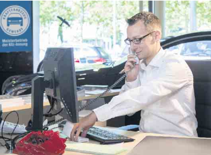
Die Kraftfahrzeugbranche bietet gute Karrieremöglichkeiten auch im kaufmännischen Bereich.

Darüber hinaus steht auch der Weg zu Führungspositionen oder zur Selbstständigkeit offen. Der klassische Meister etwa kann zum Werkstattmanager oder Betriebsleiter aufsteigen, einen Betrieb übernehmen oder selbst einen gründen. Auch akademische Abschlüsse bis zum Bachelor oder Master of Business Administration in technischen und kaufmännischen Studiengängen liegen in Reichweite. (djd)