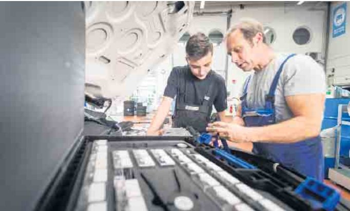
Eine Ausbildung im Kfz-Gewerbe eröffnet vielfältige Berufsbilder und Karriereoptionen.