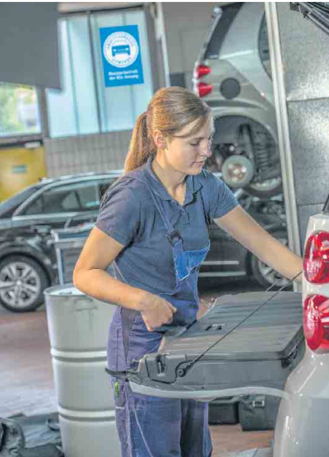
Berufe in der Kfz-Branche leisten einen wichtigen Beitrag zur Mobilität der Gesellschaft.

Darüber hinaus steht auch der Weg zu Führungspositionen oder zur Selbstständigkeit offen. Der klassische Meister etwa kann zum Werkstattmanager oder Betriebsleiter aufsteigen, einen Betrieb übernehmen oder selbst einen gründen. Auch akademische Abschlüsse bis zum Bachelor oder Master of Business Administration in technischen und kaufmännischen Studiengängen liegen in Reichweite. (djd)