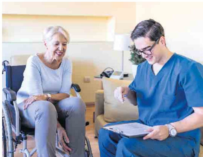
Ein Pflegeberuf bringt viel Kontakt mit anderen Menschen mit sich.

Jobs in der Pflege sind sinnvoll und gut bezahlt